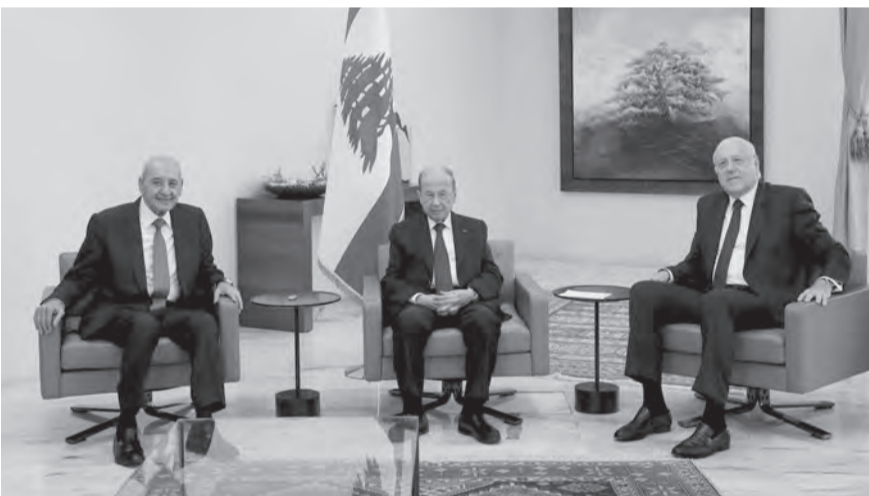
وفي هذا الإطار، استغرقت مصادر تدور في فلكه آثار كلام وزير الداخلية بسام الحلوي عن أن إستقالة قرداحي «طال إنتظارها والتأخير يزيد من الضرر على اللبنانيين»، باعتبار أن وزير الداخلية المحسوب على ميقاتي يظهر بكلامه وكأنه يعبر عن موقف رئيس

الحكومة. وعليه، فالتعويل على اللقاء الثلاثي في بعبدا، لم يحدث الخرق المطلوب وانتصاح الصورة الحكومية تترقب الأسبوع المقبل، وسلسلة اتصالات ومشاورات سيكشفها مع مختلف الأطراف فور عودته من الخارج، وكذلك ما قد تنتج عنه الزيارة المرتقبة لرئيس الجمهورية إلى الدوحة. وبالانتظار فلا حكومة ولا من يحكمون، إلا إذا أراد ميقاتي تسجيل موقف على قاعدة: «سأدعو لجلسة وليحضرها من يريد وليتحمل الجميع مسؤولياته»، سيناريو يستبعد الفئتين الشيعية، ولا ينفخه المطلعون على كواليس الاتصالات الحكومية. هل يفعلها ميقاتي تسجيلاً لموقف تجاه المملكة في عز الأزمة التي تعصف بحكومة رسمت لها شعارا «معا للأنقاذ» فباتت تبحث عن بندقية؟