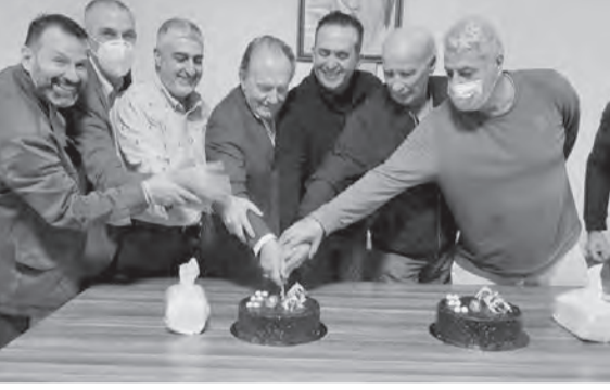
كبار الحضور يقطعون قالب الحلوى

يلعبه اتحاد التنس في تطوير اللعبة وصقل المواهب الواعدة. بدوره، نوه فيصل بنادي التعاضد العريضة ودوره الفاعل ضمن عائلة المناسبة.