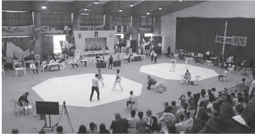
منظر عام للقاعة خلال البطولة