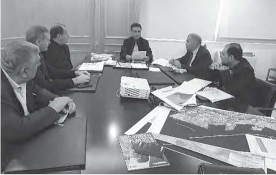
حماية خلال الاجتماع

الغرامات. واكد «ان اي شخص ما زال مخالفا ولم يتم بالتسوية سيتم تحويل ملفه الى القضاء المختص لاتخاذ الإجراءات القانونية اللازمة بحقه». وأكد «ان معالجة الإشغالات للأعمال البحرية تتم ضمن اطار صون حقوق الدولة المالية والحفاظ على المستثمرين». واعلى توجيهاته الى الادارة للتنسيق مع نقابة السياحة لبلورة مقترحات في هذا الموضوع لما فيه مصلحة الدولة والمستثمرين.