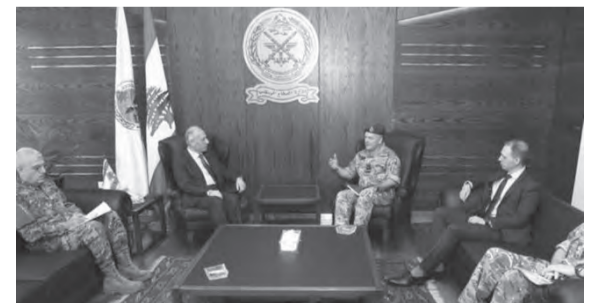
سليم مستقبلاً سامبوس وكولارد

عرض وزير الدفاع الوطني موريس سليم، مع كبير مستشاري وزارة الدفاع البريطانية لشؤون الشرق الأوسط المارشال Martin Sampson، يرافقه السفير البريطاني في لبنان إيان كولارد، مجالات التعاون بين الوزارتين وأهمية الإستمرار في الدعم البريطاني العسكري للبنان.