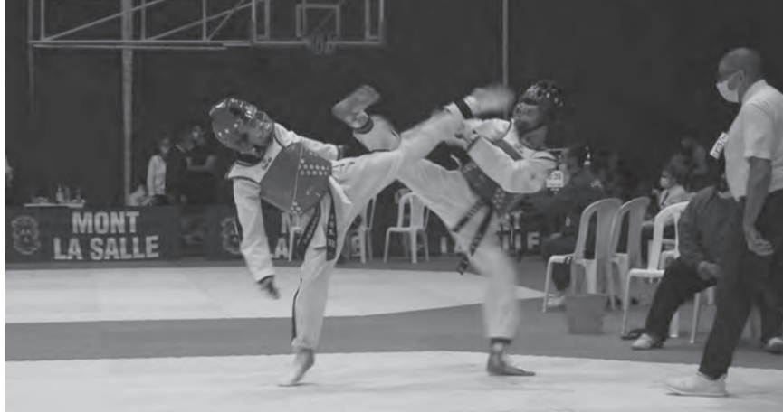
لقطة من احدى المباريات