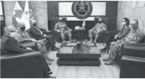
قائد الجيش مستقبلاً الوفد العسكري الهنغاري

استقبل قائد الجيش العماد جوزاف عون في مكتبه في البرزة نائب قائد القوات المسلحة الهنغارية اللواء Zsolt SANDOR يرافقه كل من: القائم بأعمال السفارة الهنغارية في لبنان Rita HEREC SAR والمحقق العسكري الهنغاري العقيد Jozsef GULYAS، وتمّ البحث في علاقات التعاون بين جيشي البلدين.