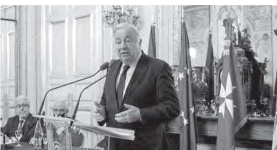
لارشييه يلقي كلمته خلال الندوة

عقدت في قصر لوكسمبورغ، برعاية رئيس مجلس الشيوخ في باريس جيرار لارشييه، ندوة حول الجهود لمساعدة الشعب اللبناني الذي يعيش أزمة غير مسبوقه على كافة الاصعدة. وتساءل لارشييه في كلمته عن مفهوم السيادة اليوم في وقت يحتفل فيه لبنان باستقلاله ويعيش مأسى غير مسبوقه تضرب اللبنانيين بالصميم، ودعا الى عقد مؤتمر يشمل الأطراف اللبنانية للبحث في موضوع السيادة. واكد أهمية لبنان ودوره، لافتاً الى انه بلد الرسالة للعالم على الرغم من كل ما يحدث، نظراً لتنوعه وإرثه الثقافي، وانه شكل دوماً مثلاً». وتطرقت الندوة الى العمل الانساني والمساعدات التي تقدمها منظمة مالطا لبنان لكافة الشعب دون أي تمييز في هذه الظروف الصعبة التي تجتازها البلاد، حيث شكلت محور الندوة في مجلس الشيوخ، التي جرت بحضور عدد كبير من الشخصيات البرلمانية وعدد من الوزراء من كل من فرنسا، ألمانيا، وموناكو، وأخصائين في مجالات عدة، منها الصحة، الصيدلة والزراعة، جاؤوا خصيصاً للمشاركة وللاشارة بشهادتهم حول الإنجازات التي قدمتها المنظمة في التخفيف من معاناة الشعب اللبناني. والقى عدد من المتحدثين كلمات بهذا