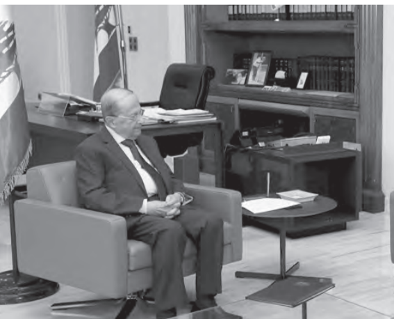
عون مستقبلاً السفير الروسي (دالاتي ونهرا)

المتحدة أنطونيو غوتيريش الى بيروت، والتي يفترض ان تكون في الثلث الأخير من الشهر قبل أو بعد عيد الميلاد بساعات، وهذه الزيارة التي تأتي بعد دعوة رسمي قدمها ميقاتي الى المسؤول الأممي في غلاسكو، يُفترض أن تدل على حرص الأمم المتحدة على صمود لبنان ومنع سقوطه. وترى المصادر أن زيارة غوتيريش ليست بأهمية الزيارة الفرنسية الى الخليج، ولكنها دون أدنى شك ترسم بعض المؤشرات، علماً أن الرجل سيزور القوات الدولية العاملة في لبنان، كما البطريرك الراعي، حيث يُفترض ان يشكل الحياذ طبق الحوار الرئيسي.