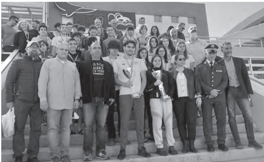
ممثل قائد الجيش مع اركان الاتحاد والمشاركين في السباق