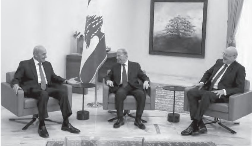
لقاء الرؤساء الثلاثة في قصر بعبدا بعد العرض العسكري امس