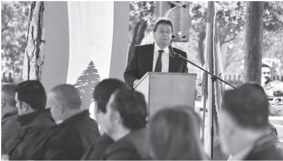
كنعان يلقي كلمته

وتابع «جوابي لا. فمن رحم الصعوبات تولد الفرصة ومن صلب الأزمات يبرز الأمل. ونعم علينا أن نولد من جديد لبنانيين. تعرفون أن من يقف أمامكم، هاجر يوماً واحتمل صعوبات النفي والعيش في الخارج ولكنه عاد ليواصل هنا لاستعادة لبنان وعافيته واستقلاله. لذلك ما أقوله قناعة الى حد القسم ونحن نلتقي اليوم، ونرفع علمنا في ذكرى استقلالنا، نقسم أننا سنولد من جديد لبنانيين ناضل من داخل مؤسساتنا، من داخل عائلاتنا من داخل قرانا وبلداتنا ومصانعنا ومصالحنا وبلدياتنا ومن داخل متاجرنا هنا وأينما وجدنا نعمل ونثابر مقتنعين بأنها شدة ويتمرق». وختم كنعان «فلنتحد كما فعلنا في السنتين الماضيتين صحيان واجتماعياً... في مستشفياتنا ومستوصفاتنا ومدارسنا. ولنحول اليوم كل غصة وألم، الى فعل مقاومة وعمل لنجعل منها مقاومة للواقع السيء لنهجم الفساد والهدر والخنوع والارتهاق لعقبة الدولة البقرة الحلوب فكر المحاصصة، ولتكن الانتخابات النيابية استفتاء حقيقياً لأي لبنان نريد، ولنح الثقة لمن سيكون على قدر التحدي وصورة لبنان الذي نطمح اليه».