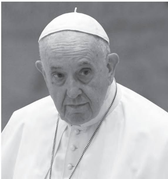
هذا الخلل من دون اي نتيجة على ارض الواقع، وختم المصدر: هذه الهواجس سطرخ خلال لقاء البابا مع ميقاتي».

ثغرة امل في الجدران اللبناني المقل. وينقل المصدر عن رئيس الحكومة اعلانه دائماً، بأنه يلقي الدعمين الفرنسي والأميركي، ويطمح لنيله الدعم الفاتيكاني خلال ايام، خصوصاً أن الحبر الاعظم يُبرز اهتمامه بلبنان وتمسّكه بالدولة وليس بالطائفة المسيحية فقط، كما يدعوا دائماً للحفاظ على المناصفة، ولا يظهر بأنه مع فريق ضد آخر من منطلق طائفي، وإن كانت هواجسه تتفاقم كل فترة، من تغيير وجه لبنان بسبب الاختلال الديموغرافي، وخوفه من تقلص عدد المسيحيين المستمر، لانه الممثل الاول للمسيحيين في العالم. وهناك قلق دائم لديه من تهيمشهم وإبعادهم عن المراكز الحساسة في الدولة، خصوصاً بعد تراجع دورهم السياسي بشكل فاعل، وغيباهم عن صنع القرار فيه، من هنا يتحدث البابا مع المسؤولين اللبنانيين حين يزورونه، عن الهواجس التي تعتربه، من فقدان التوازنات وأسس العيش المشترك وغيرها من الأمور الهامة، إذ لا يخفى عليه أنّ المسيحيين يعيشون حالة قلق على المصير، بعد ان كان لبنان يحوي أكبر وجود مسيحي فاعل في الشرق، فالمسيحيون أصيبوا منذ التسعينات بتراجع سياسي كبير، لان عوامل عدة لعبت دوراً في تناقص عددهم، من ضمنها الخلل الطائفي الذي يسيطر على المؤسسات، حيث يتراجع المسيحيون بوضوح، على الرغم من الكلام المعسول الذي نسمعه، بضرورة إصلاح