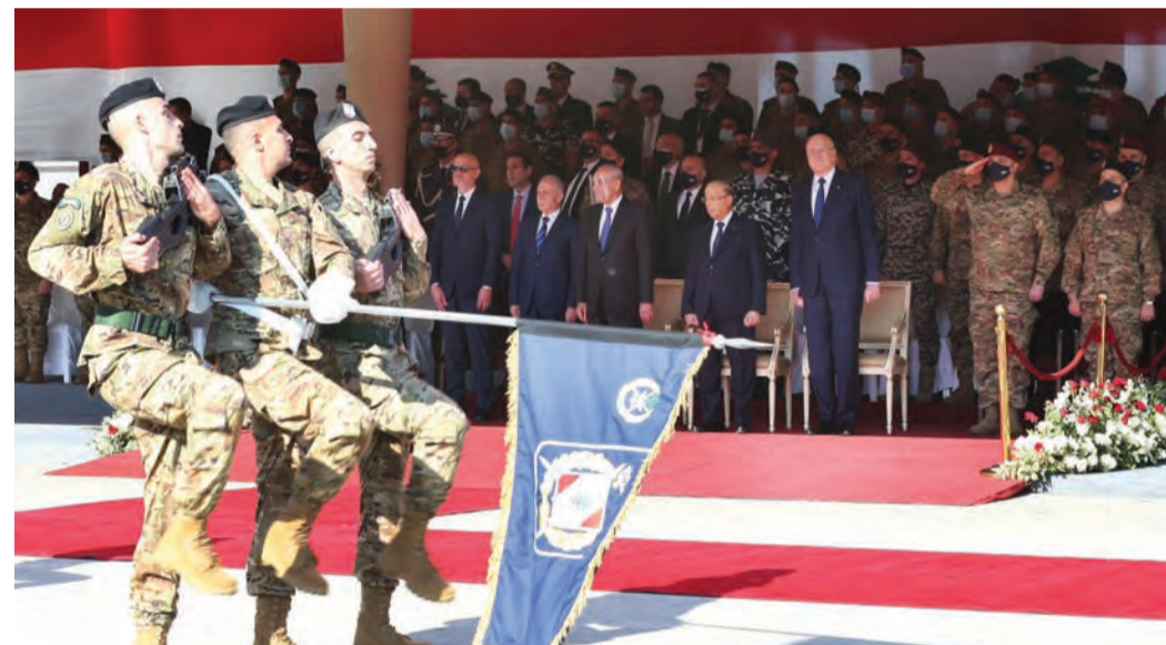
خلال الاحتفال الرمزي في وزارة الدفاع بمناسبة عيد الاستقلال