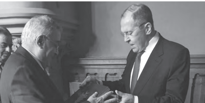
لافروف يسلمّ بو حبيب صوراً للأقمار الصناعية

من هذا المنطلق، فإن جنبلاط يدرك تمام الإدراك صعوبة المرحلة، وثمة هواجس وقلق لديه من خطورة الأيام القادمة، وهذا ما يفضي به أمام القرّبين منه، ولهذه الغاية لن يقدم على أي خطوات واصطفايات قد لا تتماشى مع هذه المخاوف.