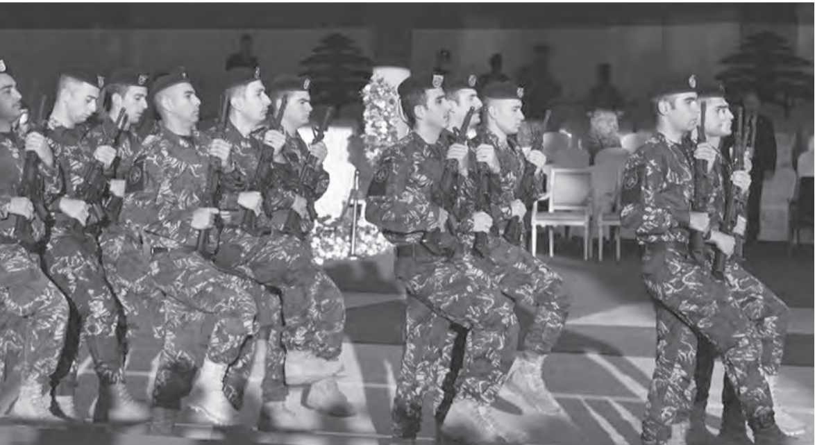
من العرض العسكري

رئيس الجمهورية معلنا انتهاء العرض، وغادر بعد ذلك الرئيس عون والرئيسان بري وميقاتي مودعين من قبل وزير الدفاع وقائد الجيش وكبار الضباط. ثم تقبل قائّد الجيش تهاني الضباط قبل ان يغادر علم الجيش موقع الاحتفال.