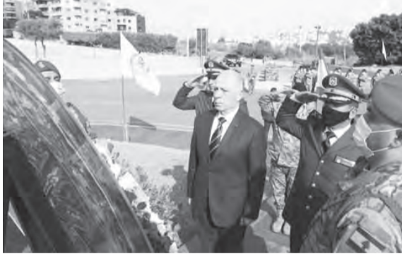
سليم يضع اكليلا على ضريح فخر الدين

وضع وزير التربية والتعليم العالي القاضي عباس الحلبي، إكليلا من الزهر، بإسم رئيس الجمهورية اللبنانية العماد ميشال عون، أمام اللوحة التذكارية في محلة الطريف، حيث استشهد الرئيس رينيه معوض، في ذكرى استشهاده، في حضور عائلة الرئيس الشهيد الزورية السابقة نائبة معوض والنائب المستقبل ميشال معوض وعائلته.