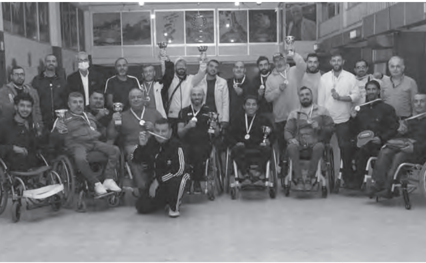
رئيس وامين عام الاتحاد مع المنظمين والفائزين