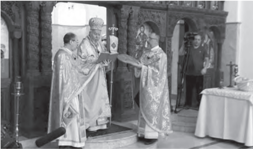
بسترس يترأس القداس الاحتفالي

يُخاطبون بعضهم بالشتائم ويبدو أنهم لا يقرؤون الإنجيل