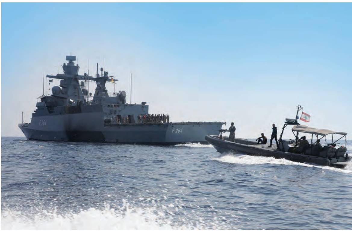
بحرية الجيش اللبناني واليونيفيل

عون يرفض تقريب موعد الانتخابات... الاستحقاق النيابي في مهب الريح! تخط داخل مجلس القضاء الاعلى في مقاربة ملف البيطار... وخشية من تحول الحكومة لتصرف الاعمال بكركي تدخل على خط تحقيقات «الطيونة»... لبنان للموفد الاميركي: بدنا ناكل عنب!