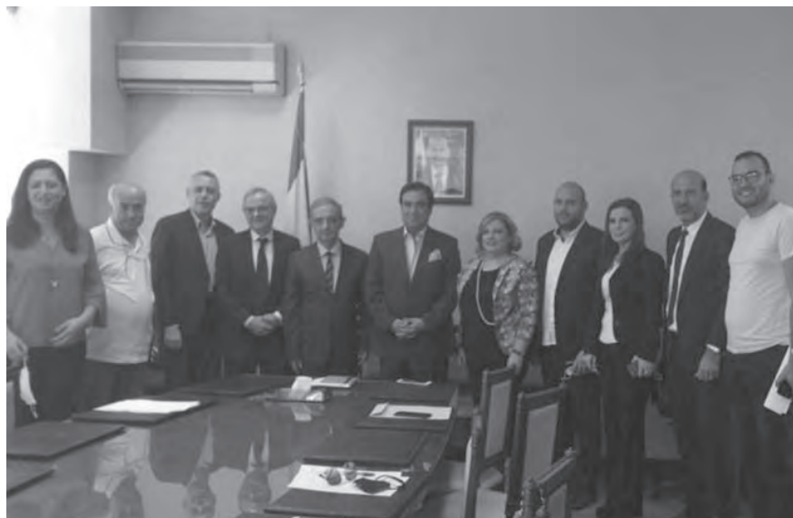
قرداحي مع وفد «رابطة خريجي الاعلام»

وكشف عن تأجيل موضوع البطاقة التمويلية الى المرحلة المقبلة، لان المشروع بحاجة الى الدرس، اما في ملف ارتفاع الدولار، فقال: نحن بحاجة الى مليار دولار في السوق لضبط سعر الصرف، والطلب على الدولار مرتفع جداً، كما ان المازوت يباع بالدولار مما يزيد الطلب عليه. ووصف قرداحي الحكومة الحالية بأنها من افضل الحكومات لجهة العمل والانسجام، والقلوب الصافية والتجانس والاصرار على الانتاجية، وختتم حديثه عن شؤون المهنة وضرورة تعديل صلاحيات عمل المجلس الوطني للاعلام، مبدياً «عتبا اخويماً» على الصديق عبد الهادي محفوظ الذي عقد مؤتمراً صحافياً عن الاعلام الالكتروني دون علم الوزارة «فاننا بطبعي مع مركزية العمل»، وأكد انه سيوزر سوريا عندما تدعو الاوضاع.