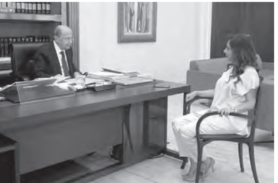
عون مستقبلاً عكر

ووفق هذه الأوساط، فإن الأزمة ما زالت في مراحلها الأولية وهي مرشحة بالطبع للتعاقد وبالتالي فإن ما يحصل اليوم، هو بمثابة المقدمة للإنهيار الذي جرى التحذير منه منذ العام ٢٠١٩ وتحديداً قبل «ثورة ١٧ تشرين الأول»، وأي اتساع للتدهور المعيشي في ضوء ما يتمّ التحضير له من تحركات واعتصامات عمالية ونقابية في الشارع إعتباراً من منتصف الأسبوع المقبل، ينذر بالوصول إلى ما يشبه «التفلت الميداني» فيما لو اتفقت النقابات كلها على الإقفال إحتجاجاً على تفاقم الأزمة العيشية، ومن أبرزها نقابة موظفي المصارف والسائقين والإتحاد العمالي والأساتذة في القطاعين العام والخاص، إحتجاجاً على ارتفاع أسعار المحروقات الذي سيؤدّي الى ارتفاع الأسعار في كل المجالات.