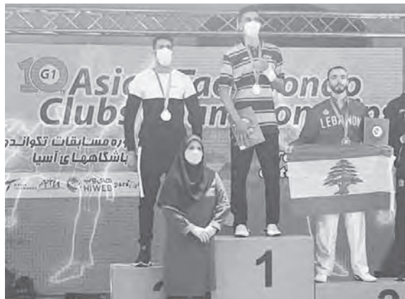
حبيقة (الى اليمين) على منصة التتويج