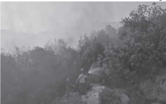
... في حرش البيدر

عند حرش البيدر، وكادت النيران تصل إلى المنازل، لكن فريق اطفاء «الهيئة الصحية الإسلامية» - مركز جبشيت، سارع إلى تطويق الحريق وأخمّده، لتقتصر الأضرار على احتراق الأشجار البرية.