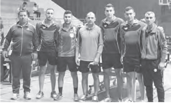
فريق الجيش اللبناني