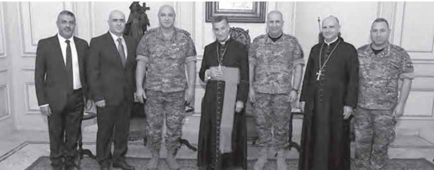
الراعي مع قائد الجيش والوفد المرافق

استقبل البطريك الماروني الكاردينال مار بشارة بطرس الراعي قائد الجيش العماد جوزاف عون، وكان عرض للتطورات الامنية في البلاد وأوضاع المؤسسة العسكرية. وفي سلامة المواطنين».