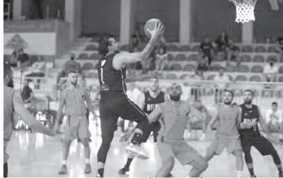
محاولة تسجيل لأحد لاعبي أطلس

ضمن منافسات الاسبوع الثاني لبطولة لبنان في كرة السلة، حقق فريق أطلس فوزاً مستحقاً بنتيجة ٧٣ - ٦٢ ويفارق ١١ نقطة على فريق هومنتمن في لقاء أقيم على ملعب مزهر. وبسبب اطلس سيطرته في الربعين الاولين وانتهى الاول بـ ٣٥ - ١٥ و ٢١ - ٦ نقطة قبل ان ينتهي الربع الثاني بنتيجة ٣٩ - ٢٧ ويفارق ١٢ نقطة لصالح اطلس.