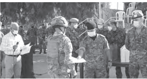
خلال تسليم الشهادات للعسكريين

اعلنت قيادة الجيش عبر «تويتر» عن «حفل تخريج وتوزيع إفادات على عسكريين من لواء المشاة الخامس نفذوا تدريباً مشتركاً مع عناصر من قوة الامم المتحدة المؤقتة في لبنان في مركز التدريب الخاص باللواء - الشواكير».