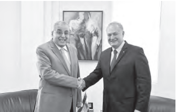
السفير الروسي يزور بو حبيب

استقبل البطريك الماروني الكاردينال مار بشارة بطرس الراعي قائد الجيش العماد جوزاف عون، وكان عرض للتطورات الامنية في البلاد وأوضاع المؤسسة العسكرية. وفي سلامة المواطنين».