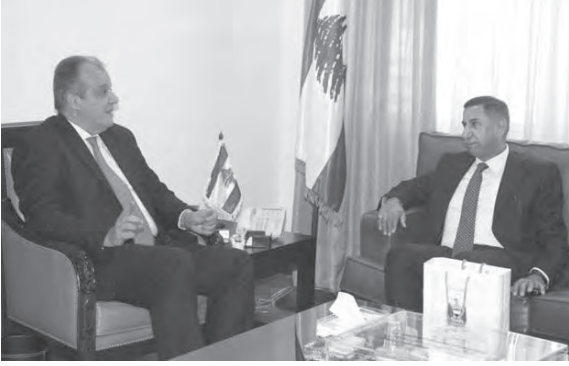
بوشكيان وسفير العراق

حيث يتابع نحو عشرين الف عراقي تحصيلهم العلمي في لبنان، فضلاً عن الآلاف الذين يقومون بالسباحة العلاجية والاستشفائية. ورحب الوزير بالعراقيين في لبنان بلدهم والثاني، مشدداً على أنهم يلقون كل الترحيب والتقدير من جانب اللبنانيين.