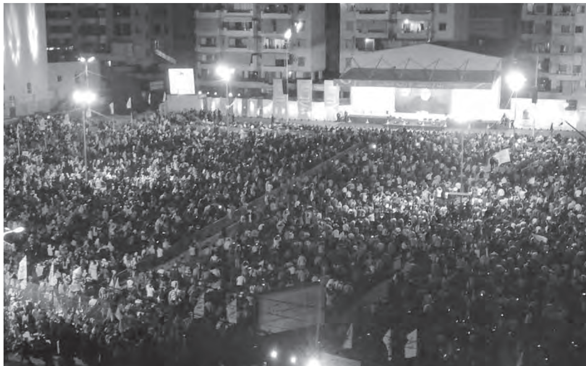
الحشود في باحة عاشوراء في الحدث

أكد الأمين العام لحزب الله السيد حسن نصر الله، «أن المقاومة عندما تجد أن نطف وغاز لبنان في دائرة الخطر ولو في المنطقة المتنازع عليها مع العدو الصهيوني ستنتصر على هذا الأساس».