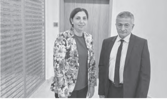
الخليل مع دشتي

التقى وزير المال يوسف الخليل وفداً من الإسكوا (ESCWA) برئاسة الأمانة التنفيذية للجنة الاقتصادية والاجتماعية لغربي آسيا رولا دشتي، وتم البحث في الأوضاع المالية والاقتصادية واستعداد الإسكوا لدعم تنفيذ الإصلاحات المطلوبة عبر تقديم الخبرات الفنية لوزارة المالية.