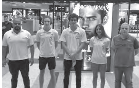
بعثة السياحة في مطار رفیق الحريري الدولي

المتحدة الأمريكية السّباحة سيمون كباره التي ستشارك في سباقات ٢٠٠ متر و ٤٠٠ متر متنوع و ٢٠٠ متر ظهر و ٢٠٠ صدر. وعلى هامش البطولة، سيشارك الأمين العام فريد ابي رعد في اجتماع الجمعية العمومية للاتحاد العربي الذي سيعقد يوم ٢٤ تشرين الأول الجاري في فندق «هيلتون» (أبو ظبي) ممثلاً للاتحاد اللبناني.