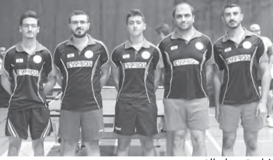
شاريتيه دار النور