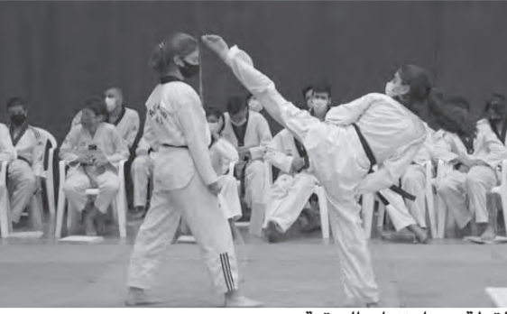
لقطة من امتحان الترقية

نظم الاتحاد اللبناني للتايكواندو امتحان ترقيية لحملة الحزام الأسود لدرجات اول، ثاني، ثالث، رابع دان /يومو خامس دان في نادي المون لاسال (عين سعاده). شارك في الامتحان ١٢٣ لاعب و لاعبة ينتمون الى الأندية التالية: