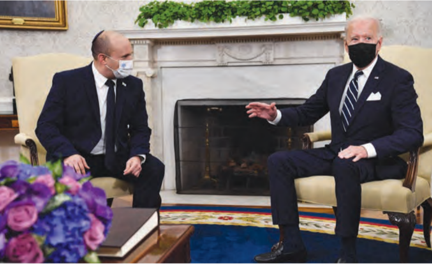
بايدن وبينيت في صورة ارشيفية

كشفت إذاعة الجيش الإسرائيلي أمس الأربعاء، أن رئيس الوزراء نفتالي بينيت أبلغ وزراءه خلال جلسة الكابينة (المجلس الوزاري السياسي والأمني المصغر) الأخيرة، أنه فوجئ بالضغط الأميركي ضد الاستيطان في الضفة المحتلة. وبحسب إذاعة الجيش الإسرائيلي، قال بينيت «لقد فوجئت بالضغط الأميركي ضد