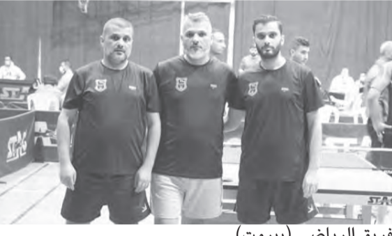
فريق الرياضي (بيروت)