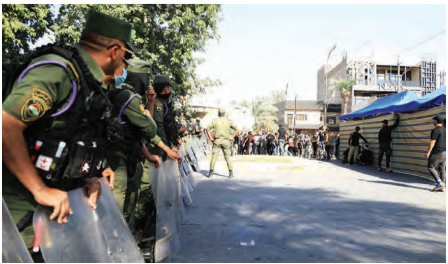
المتظاهرون نصبوا الخيم في الطرقات

وقان في استقبال باقري، نائب هيئة الأركان الروسي اللواء سيرغي ايستراكوف، في مطار فنوكوفو في موسكو. واعتبر باقري أن تأخر زيارته لموسكو كان بسبب جائحة كورونا، مؤكداً أنه «سيكون هناك محادثات مؤثرة وبناءة من أجل