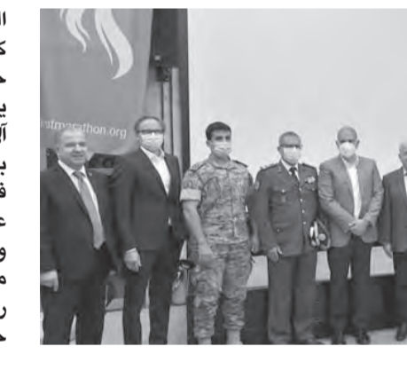
كبار الحضور في صورة تذكارية

التي مازالت قائمة على كافة الصعد وهو ما فرض جملة إجراءات منها أن يكون سقف المشاركة ٦ آلاف مشارك ومشاركة من بينهم ألف مشارك افتراضياً في الخارج ولن يتم إستقدام عدائين محترفين أجانب وعرب وبالتالي لا جوائز مالية وستكون جميع رسوم التسجيل لمصلحة ٨ جمعيات هي: Teach a Child ,The Neonat Fund ,Brave Heart , Live Love,Children Cancer ,Lebanese Autism Society