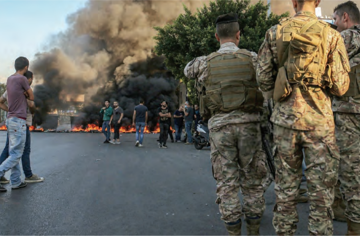
قطع الطرقات أمس

والامنية على هواها، والمجيء «بالازلام» والمحاسب، فوق البلد في المأزق الحقيقي جراء ضرب كل «الادام» والكفاءات، والإختبار على اساس الولاء المذهبي الاعمي، والاتى اعظم، اذا لم يبادر اللبنانيون الى التغيير الحقيقي الجدي والخروج من مستنقعاتهم وكئس هذه الطبقة من خلال الشارع وصناديق الانتخابات والا فان البلد امام ازمة وجودية. وفي ظل هذا المشهد المؤلم، يبقى «القهر الاكبر»، ما كشفتته احصائية احدي المواقع المهتمة بالشأن الاجتماعي وظهرت ان ٩٧٪ من عائلات الرؤساء والزعماء والوزراء والنواب الحاليين والسابقين وقادة الاجهزة العسكرية والمدراء العامين واصحاب المصارف ورجال الاعمال غادروا لبنان ومعظمهم الى فرنسا والدول الاوروبية وسجلوا اولادهم في اقبح المدارس واستأجروا منازلا في ارقى هذه البلدان، حتى تتغير الاحوال في البلد كما ذكرت عقيلة احد المسؤولين لوكالة اجنبية بان «الحياة لم تعد تطاق في بيروت»، وهذا ما يؤكد ان الفقراء وحدهم يدفعون الثمن... ■ الخلفات السياسية ■