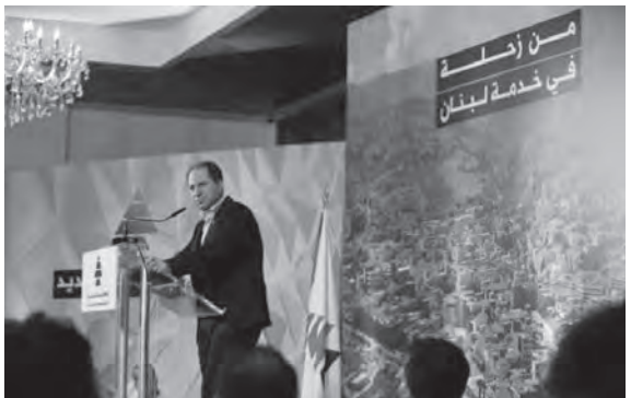
الجميل يلقي كلمته خلال حفل تكريمي في زحلة

حول ان لا شيء سيبقيهم وان الطاقم القديم سيعود نفسه، وهذه ليست سوى دعاية يومية تقوم بها السلطة السياسية لاحباط اللبنانيين ودفعهم الى اليأس أو وضعهم أمام ثلاثة خيارات، أما الهجرة، أو الاستسلام أو اللجوء الى من يمكن ان يقدم له المساعدات والخدمات».