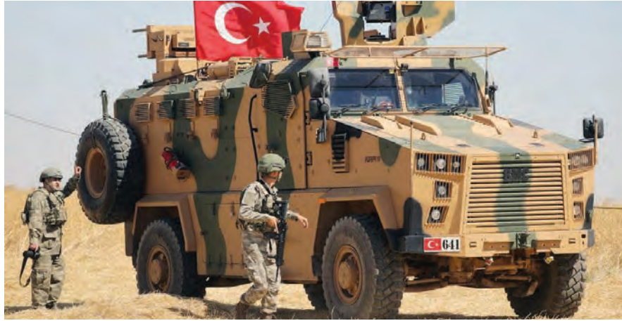
قوات تركية في سوريا

أعرب وزير الخارجية السوري فيصل المقداد عن استعداد دمشق لتطوير علاقاتها مع جيرانها في المنطقة، على الرغم من مواقفهم السابقة إزاء النزاع السوري. وأشار المقداد في تصريحات صحفية، إلى أن بعض أنحاء بلده شهدت «دماراً لا يمكن تصور مستوئ أهواله»، مضيفاً أن أغلب هذا الدمار تم «بأموال عربية وبدعم في بعض الأحيان من دوائر عربية»، مضيفاً «لقد حان الوقت لتركيا سحب قواتها من سوريا».