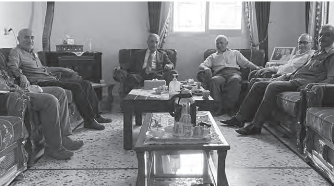
هاشم مستقبلاً زواره

اعتبر عضو كتلة «التنمية والتحرير» النائب قاسم هاشم، بعد جولة له ولقائه في منطقة مرجعيون والعرقوب، أنه «أمام صعوبات الازمة الاجتماعية وما يواجهه المواطن من تحديات مع غياب خطة حكومية للتخفيف من انعكاس الازمات المتتوعة عن كاهل اللبناني والمترافقة مع غياب الرقابة عن جشع واحتكار بعض التجار، والمطلوب من الحكومة قرارات استثنائية لظروف أكثر من استثنائية، واجتماعات الحكومة يجب ان تبقى مفتوحة لمناقشة كل الحلول آنية ومستدامة للتخفيف من آثار الازمة الاقتصادية على يوميات المواطن ولاعادة بناء الثقة بدولته التي غابت عن دورها في الرعاية الاجتماعية لأبنائها، وهذا أمر مهم في هذه اللحظة المصرية التي يمر بها وطننا وشعبنا»، وختم هاشم «لأننا حريصون ومتمسكون بإجراء الانتخابات في موعدها كما أكد الرئيس نبيه بري أكثر من مرة، فكنا منفتحين على النقاش وما تم التوصل اليه في الكتل النيابية والقبول مرغمين على السير بالقانون الناقد ومتطلباته القانونية التي تفرضها بعض الظروف على أن يصل اللبنانيون لقناعة أن الخروج من أزمتهم لن يحصل الا بالخروج من النظام الطائفي والمذهبي الى نظام دولة المواطنة وعبر قانون انتخابات يعتمد لبنان دائرة واحدة، وفق النظام النسبي خارج القيد الطائفي»، سانلاً «هل سيسمح بعض تجار الدين والطائفية والمذهبية الوصول الى وطن المواطنة والحق والعدالة في يوم من الايام».