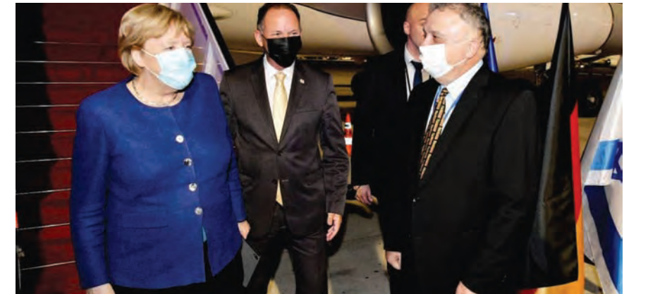
ميركل في فلسطين المحتلة

أكدت المستشارة الألمانية أنجيلا ميركل، أمس الأحد في القدس المحتلة، أن أمن «إسرائيل» سيبقى أولوية «لأي حكومة ألمانية»، في بداية زيارة رسمية «لإسرائيل» في إطار جولة وداع قبل انسحابها من الحياة السياسية التي استمرت ١٦ عاماً. واجتمعت ميركل، في ثامن وآخر زيارة تقوم بها لـ «إسرائيل»، منذ توليها السلطة، مع رئيس الوزراء الإسرائيلي بنيامين نتانياهو.