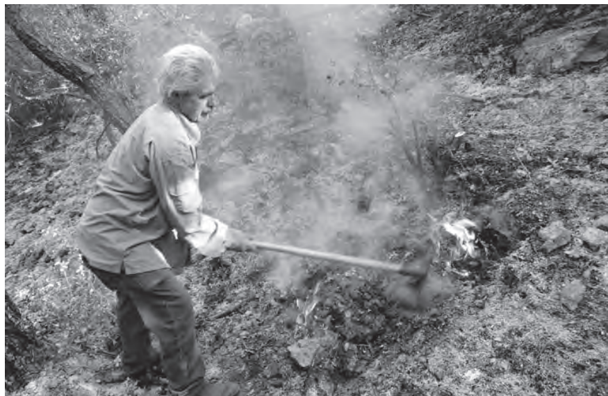
في السفيرة - الضنية

تمكنت طوافات الجيش وبجهود عناصر الدفاع المدني في مراكز برقابيل، السدقة، بيتين-العبدة إضافة الى المشاركة الفعالة لتطوعي فريق التدخل السريع في جمعية درب عكار البيئية وبلدية بزّال والإهالي، من السيطرة شبه التامة على النيران التي اندلعت في أحياء بلدات بزّال، حبشيت وعين الذهب على مدى يومين متتاليين.