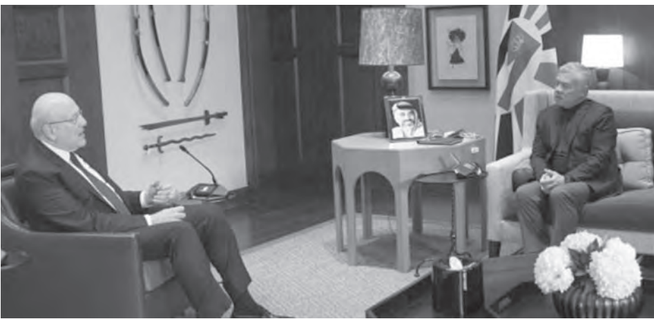
ميقاتي يزور الملك عبدالله

استقبل ملك الأردن عبدالله الثاني رئيس مجلس الوزراء نجيب ميقاتي، بعد ظهر امس في قصر الحسينية في العاصمة الأردنية عمان. وأذاع الديوان الملكي الهاشمي البيان الاتي: «استقبل الملك عبدالله الثاني في قصر الحسينية، امس الأحد، رئيس الوزراء اللبناني نجيب ميقاتي. وتناول اللقاء العلاقات الأخوية المتميزة التي تجمع البلدين والشعبين الشقيقين، وعبر الإعلام، وتحدث عن مئات ملايين الدولارات، حيث تكشف المصادر أن الدعم المالي في الإنتخابات ستخطى ٢ مليار دولار، بعضها للأحزاب كالقوات اللبنانية التي تحظى بدعم كامل وشامل من قبل السفارة السعودية في بيروت، وتعمل بالتنسيق مع السفير الذي يُشرف شخصياً على تحضيرات القوات الانتخابية، وبعضها لمجموعات حديثة العهد تمثل الوجه «المدني» لأحزاب ١٤ آذار. كذلك تتوقف المصادر في ٨ آذار عند مساعي الحركات «التغييرية» للحصول على الدعم المالي والسياسي الخارجي، مشيرة إلى أن الخارجية يريد التحالف مع الخارج لمواجهة قوى السلطة لأنه يتهمها بالإرتباط بالخارج، وهذا أمر مثير للتساؤل، فهل أصبح أمراً عادياً في لبنان أن يطلب التمويل من الخارج لخوض الإنتخابات النيابية تحت شعار الثورة والتغيير؟