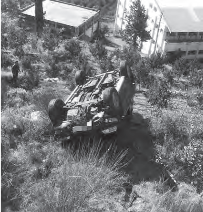
حادث على طريق حراجل - كسروان

أفادت احصاءات غرفة التحكم المروري للحوادث التي تم التحقيق فيها خلال الـ٢٤ ساعة الماضية، بأن قتييلين و٨ جرحى سقطوا في ٧ حوادث سير.