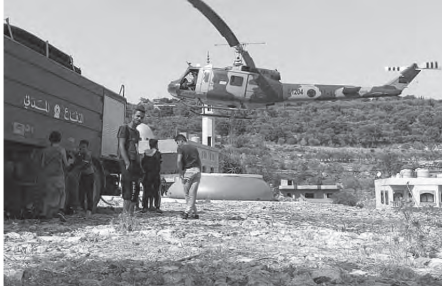
... وطوافه للجيش في عكار

ولخص المدربون مطالبهم ب «إصدار عقودهم من مجلس الوزراء حتى يتسنى لهم الحصول على راتب شهري، والخروج من مسلسل انتقال الملف من الجامعة إلى التشريع ومن ثم الديوان، والدخول في هذه الدوامة شهرها، رفع أجر الساعة ليكون ثلثي أجر الأستاذ، تعديل بدل النقل إسوة بالإدارات