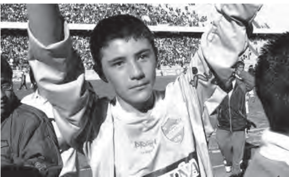
الأميركي أكسل كي

وتظهر بيليه لأول مرة مع سانتوس في ٧ أيلول ١٩٥٦ عن عمر ١٥ عاماً وذلك ضد كورينثيانز سانتو أندريه وكان له أداء رائع في فوز فريقه بنتيجة ١-٧، حيث سجل هدفاً بثلث المواجهة.