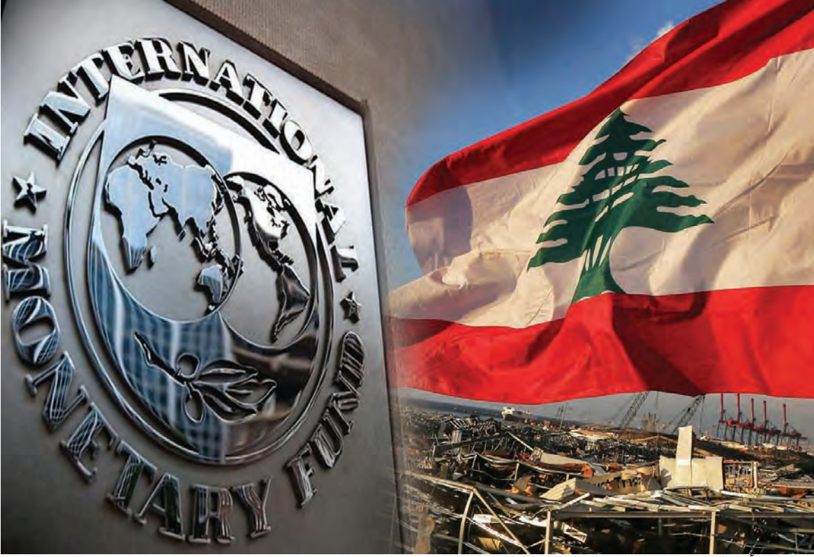
متى ستبدأ المفاوضات بين لبنان والبنك الدولي؟

الأول ٢٠٢١ - هناك ثلاثة مبادئ ترعى أي مفاوضات لصندوق النقد الدولي مع دولة عضو في هذا الصندوق: المبدأ الأول - ويض على الإنفتاح على التجارة العالمية بأبعادها الإستثمارية والتجارية؛ المبدأ الثاني - ترك حرية تحديد سعر الفائدة للسوق من خلال آلية العرض والطلب وعدم التدخل إلا ضمن إطار السياسات النقدية المتعارف عليها أي الفائدة على المدى القصير؛ المبدأ الثالث - خروج الحكومات من المجال الإقتصادي بالكامل وتركه للقطاع الخاص مع الإحتفاظ بدور الرقابة والتشريع والتنظيم التي تنص عليها النظرية الإقتصادية. فكل برنامج إصلاح يجب أن يلتزم هذه المبادئ الثلاثة على أن يكون البرنامج الحكومي المعتمد يؤدي حقيقة للإصلاح وليس فقط مطية للحصول على أموال الصندوق!.