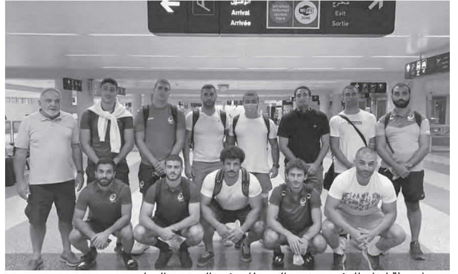
وصول بعثة لبنان للرجبي يونيون الى مطار رفيق الحريري الدولي