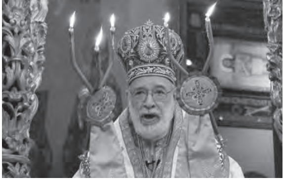
عوده يلقي عظته

يعرف أن الحياة هي فسحة ممنوحة لنا للتوبة والعودة إلى الله، وأن الوقت عطية ثمينة يجب ألا نضيعها بالإهتمام بالأمور الزائلة والفانية، بل علينا الانصراف إلى ما يؤدي بنا إلى الخلاص والحياة الأبدية. عندما صوت الإنسان هذه الأمور ويتأمل في أبعدها ربما قد يخفت صوت الشر، وتخف النزاعات والحروب، وتراجع الجرائم، ويعود الإنسان إلى إنسانيته».