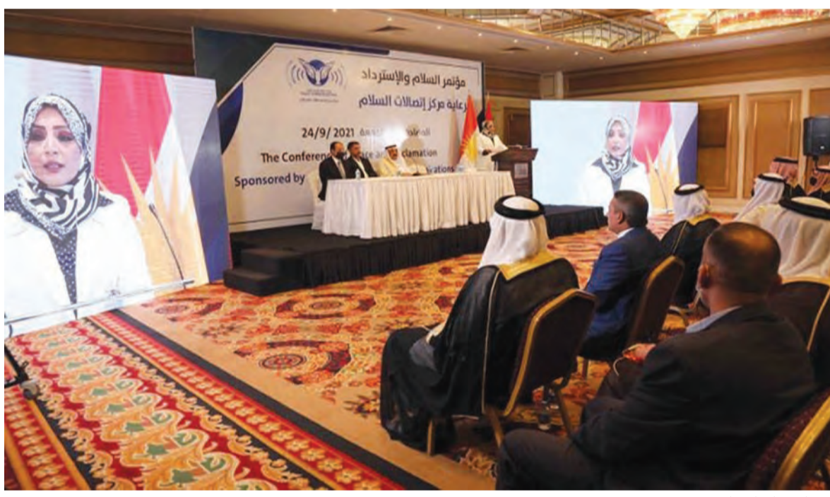
من اجتماع اربيل

أعلنت الرئاسة العراقية في بيان أمس رفضها محاولات التطبيع مع «إسرائيل»، وجددت موقفها الداعم للقضية الفلسطينية.