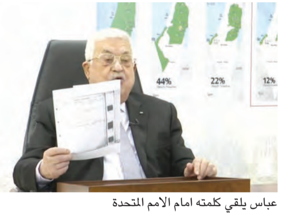
عباس يلقي كلمته امام الامم المتحدة

قالت حركة «حماس» إن الخطاب الذي ألقاه الرئيس الفلسطيني محمود عباس أمام الامم المتحدة «تضمن اعترافاً واضحاً وصريحاً بعجزه وفشله في تحقيق أي إنجاز عبر مسار أوسلو الذي يتزعمه».