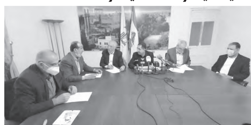
الحاج حسن يلقي كلمته خلال الاجتماع

عقد تكتل بعلبك المرمل النيابي اجتماعه الدوري في مكتبه في بعلبك، بحضور أعضائه، وتناول البحث المستجدات السياسية والاقتصادية والحياتية، بعد نيل الحكومة ثقة المجلس النيابي. وصر عن المجتمعين بيان تلاه رئيس التكتل النائب حسين الحاج حسن، طالب فيه الحكومة بـ «إقرار وتنفيذ خطة متكاملة للانتقال في ما يتعلق بالملفات الاقتصادية والمالية والنقدية وكذلك الكهرباء والمحروقات والدواء والطاقة التمويلية، فضلاً عن حماية اللبنانيين وخصوصاً الفئات الشعبية الفقيرة من خلال ملاحقة المحكرين والمتلاعبين بأسعار الغذاء والدواء والمحروقات عبر السوق السوداء».