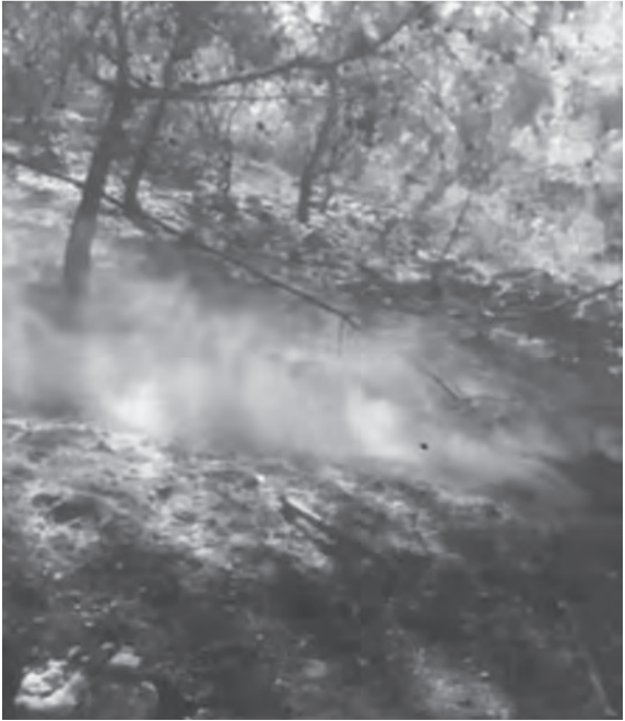
الحريق في احراج كفرحبو