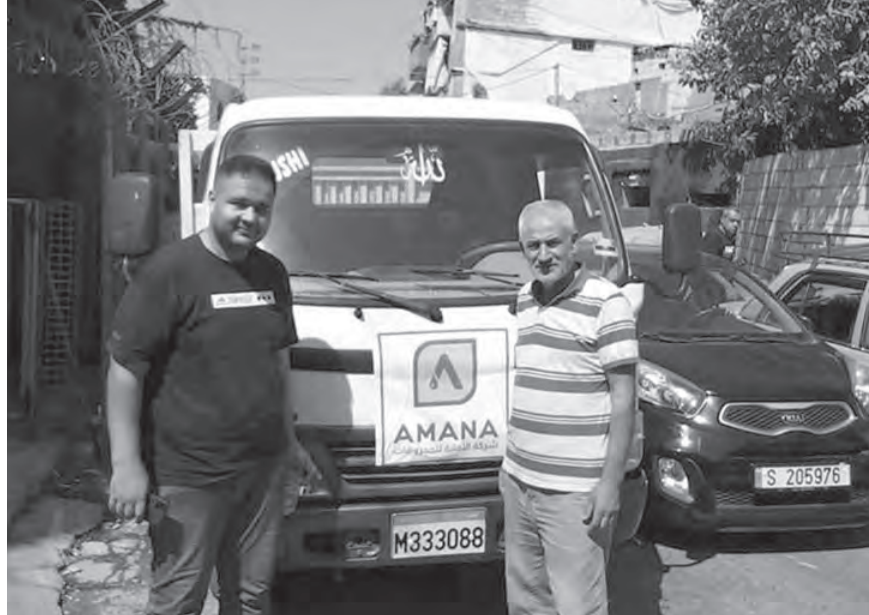
توزيع المازوت في الجنوب

وكان لافتاً طريقة الشكر باللغة الإيرانية، حيث قال نكد: «خوش آمدید».