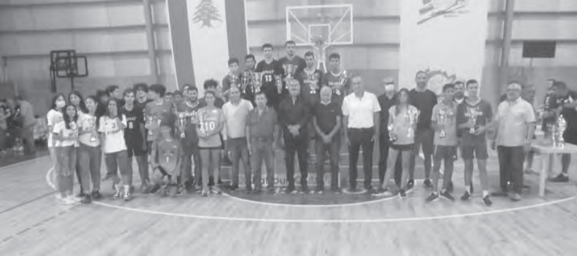
... ومع الفائزين ببطولات داخل الصالات