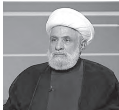
قاسم خلال المقابلة التلفزيونية

*أعلن نائب الأمين العام لحزب الله نعيم قاسم، أنه «في حال لم تتحرّك الشركات ومصرف لبنان لتأمين حاجات البلاد من المحروقات سنستمر في إدخال المواد النفطية»، مؤكداً أن «حزب الله على استعداد لإدخال المازوت عبر المعابر الحدودية المعروفة ولكنّ البعض في البلد يخاف من أميركا وعقوباتها». وقال قاسم في حديث تلفزيوني، أن «الكمية التي طلبها التجار اللبنانيون وصلت إلى نحو ٢٥ مليون لتر»، مشيراً «إلى أن موازين القسوى هي التي أدت بالمازوت الإيراني إلى لبنان، وأني اعتدنا إسرائيلي على لبنان مستقباله ردّ من حزب الله حتى لو جرّ إلى حرب».