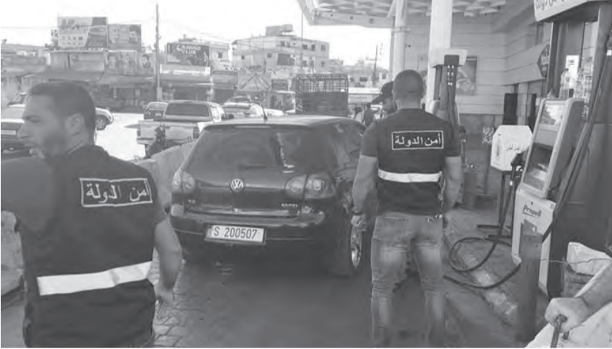
دوريات لقوى الأمن في صور

وفيما رحب أهالي إقليم الخروب، بخطوات قوى الأمن، شددوا على التمسك بالدولة ومؤسساتها، الذين هم خزائنها والرافد الأساسي لها، لكنهم اعرىوا عن أسفهم غياب وزارات الدولة ومؤسساتها واجهزة الرقابة عن المنطقة، خصوصا لجهة مراقبة الأسعار وضبطها من قبل الجهات المعنية.