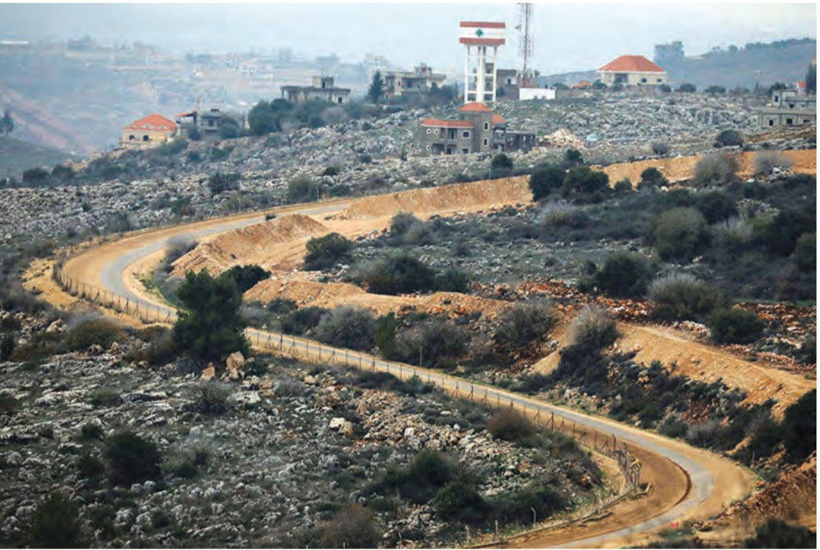
الحدود اللبنانية الجنوبية مع فلسطين المحتلة

بول مراد الهدوء الذي طبع نهاية الاسبوع في لبنان من المرتقب ان يتلاشى قريباً بالتزامن مع الزخم الحكومي المتوقع مع عودة رئيس الحكومة نجيب ميقاتي من زيارتين خارجيتين سريعتين وانطلاق الاستعدادات الحزبية للانتخابات ما يؤدي تلقائياً الى ارتفاع حدة الخطابات السياسية لزوم التجيش الانتخابي.