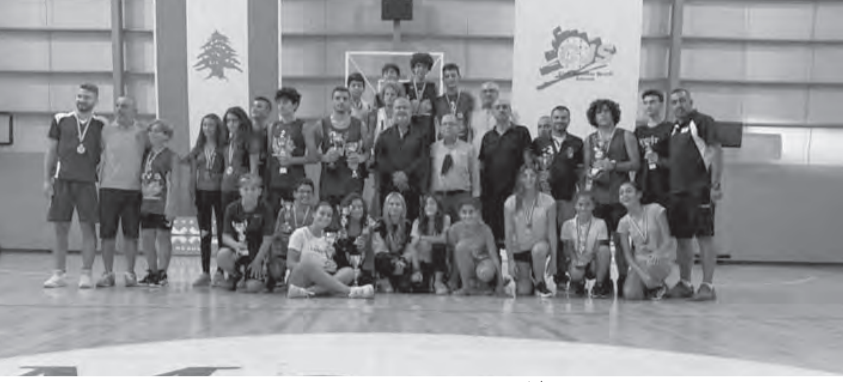
كبار الحضور مع الفائزين ببطولات الطائرة الشاطئية