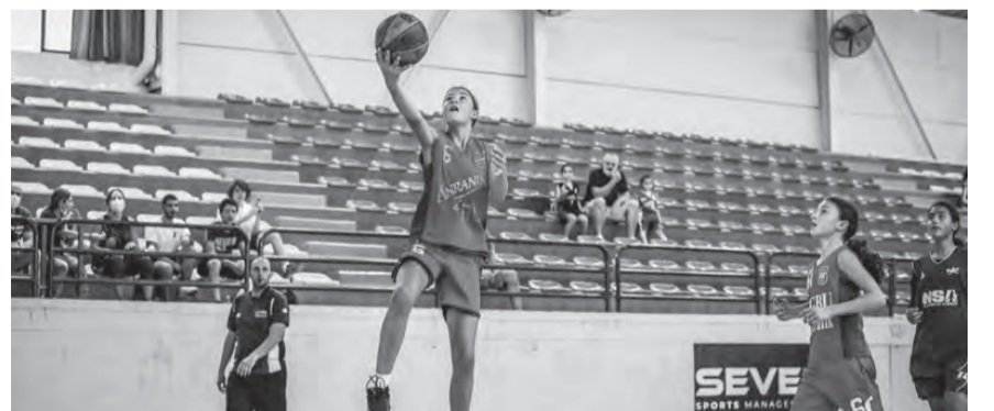
من مباريات الدور الأول للذكور