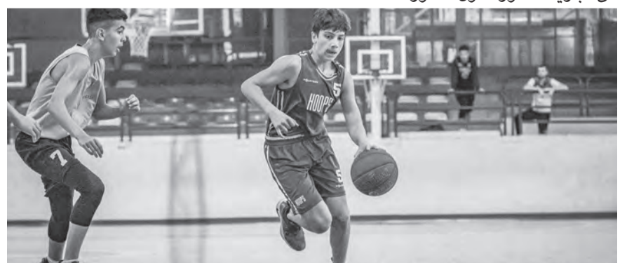
لقطة من احد اللقاءات

تواصل بطولة لبنان لكرة السلة للفئة العمرية (تحت الـ ١٤ سنة) للذكور والاناث التي ينظمها اتحاد اللعبة برعاية «Seven Sports Management»، فلدَى الذكور ينطلق السبب والأحد المقبلين الدور الثاني مع تأهل ١٢ فريق الى هذا الدور قسماً الى ٤ مجموعات كالتالي: - المجموعة الأولى: الشباب زحلة، تشامبس والأطوني. - المجموعة الثانية: الشياح، سكوادرا ودير الأحمر. - المجموعة الثالثة: هويس، حمامات وساحل