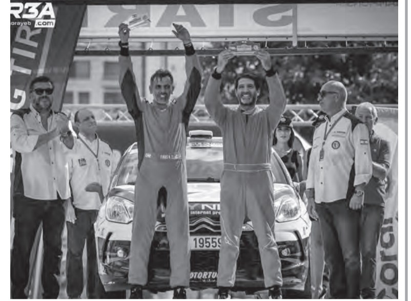
حاوره جلال بعينو

وعبر ابو حمدان عن رضاه عن نتائجه في العام ٢٠٢١ اذ احرز لقب بطولة لبنان للراليات للدفع الامامي واحتل المركز الثاني في بطولة لبنان لسباقات تسلق الهضبة ليحز