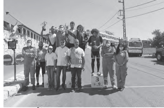
الفائزون مع اعضاء الاتحاد وعناصر الصليب الأحمر

نظم الإتحاد اللبناني للدرجات الهوائية سباق كأس لبنان للدرجات للعام الجاري انطلاقاً من طبرجا ذهاباً إلى شكا ومنها العودة إلى جبيل ثم صعوداً إلى عنابا، حيث نقطة الوصول.