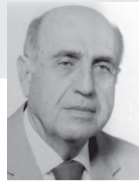
اعداد : لوران ناكوزي

الحفلة القادمة الأحد ٢٦ ايلول الساعة الثانية