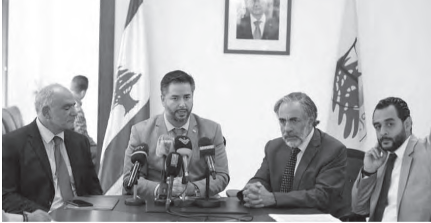
وزير الاقتصاد يعلن محضر الاسعار

خلال اتخاذ اجراءات قاسية كإغلاق تلك المتاجر، مشددا في الوقت عينه على «أهمية التحلي بالمسؤولية الوطنية والتعاون والتكاتف مع بعضنا البعض بدءاً من المواطن الى أعلى رأس الهرم.»