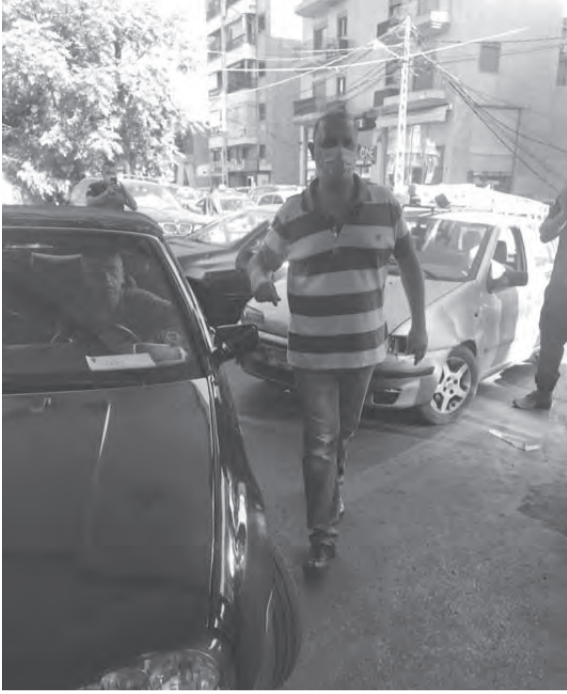
البنزين بالقطارة والاذلال مستمر