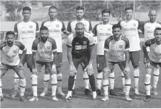
فريق شباب الساحل

تنطلق منافسات الجولة الثانية من الدوري اللبناني لكرة القدم عصر اليوم الجمعة، حيث يلتقي الإخاء الأهلي عاليه بمواجهة سبورتنج، وتستكمل غداً السبت بلقاء شباب الساحل والصفاء والحكمة ضد الأنصار.