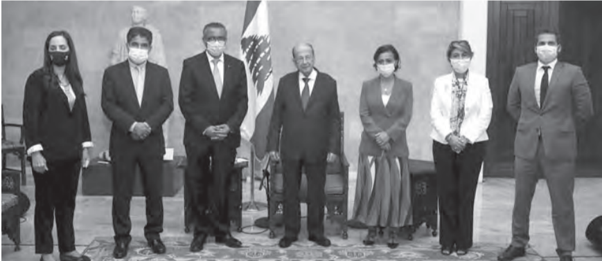
عون مجتمعاً مع مدير منظمة الصحة العالمية على رأس وفد (الآاتي ونهرا)

الصحي في لبنان في سياق التفاعيات الناجمة عن تفشي جائحة كورونا وتأثيراتها السلبية على النظام الصحي، فضلاً عن البحث في كيفية تحديد الاولويات الصحية بما يتماشى مع أهداف التنمية المستدامة.