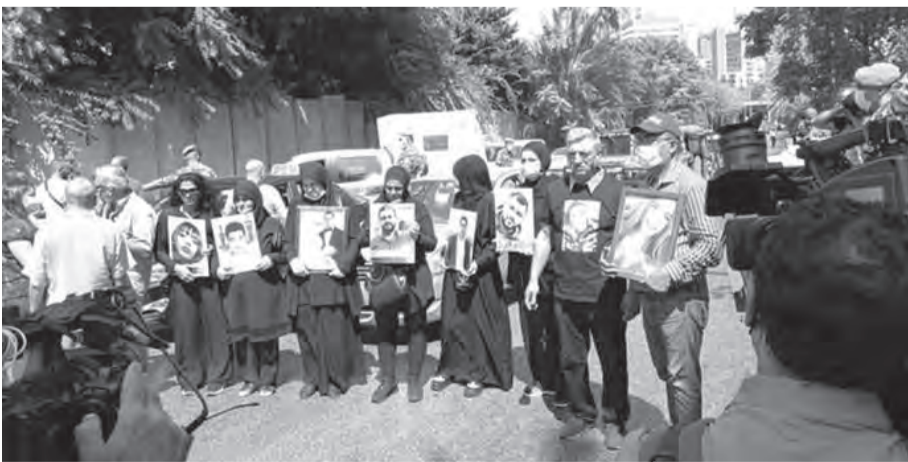
اعتصام لاهالي شهداء المرفأ امام قصر العدل في بيروت