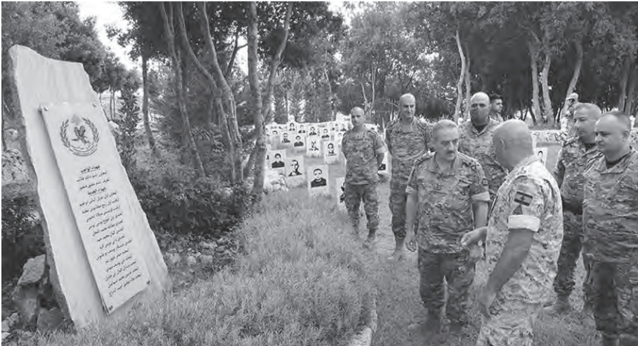
العرم يجول على فوج المحوقل

وعن مواقف النائب جبران باسيل خصوصا تجاه الرئيس نبيه بري، نفى عون «تسجيل اي انتكاسة سياسية»، وشدد على أن «كلام باسيل فيه توصيف للواقع من دون مواربة، ونحن بأبسن الحاجة الى قول الحقيقة وعلى الآخرين تقبلها».