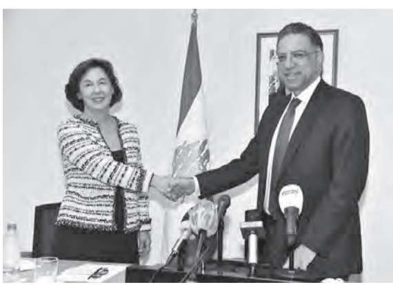
قطار يسلم رياشي

وثمرة جهود مستدامة، يبنيغى علينا العمل معا لدعمها وتغذيبتها وترجمتها عمليا، ومجابهة كل المعوقات التي قد تحول دون تحقيق النتائج المتوقعة والانجازات المنتظرة.»