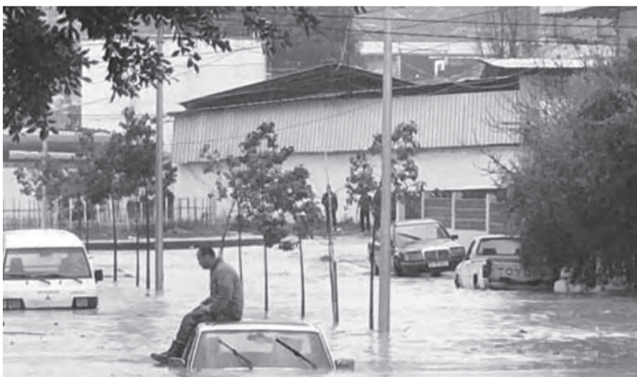
سيول في عكار

ووجهت الدعوات الى اهالي البلدات والقرى الواقعة عند مجرى النهر الكبير، الى توخي الحذر مخافة حصول فيضانات خارجة عن السيطرة.