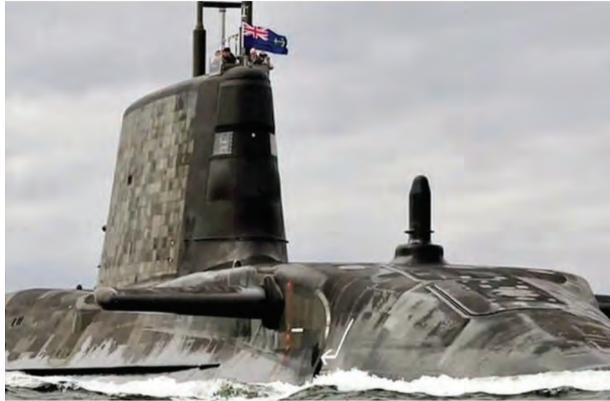
غواصات أميركية تعمل بالدفع النووي ستحصل عليها استراليا ضمن العقد

وصفت فرنسا قيام استراليا بفسخ عقد شراء غواصات أبرم عام ٢٠١٦ لتستبدلها بعقد مع الولايات المتحدة وبريطانيا لشراء غواصات تعمل بالدفع النووي من هاتين الدولتين «طعنة في الظهر». وقد جاء هذا الكلام على لسان وزير الخارجية الفرنسية جان ايف لودريان بعد الغاء استراليا الشراكة مع مجموعة «نافال غروب» الفرنسية للصناعات الدفاعية لشراء غواصات تقليدية. وتابع لودريان ان الرئيس الأميركي جو بايدن اتخذ قراراً مفاجئاً على طريقة ترامب قائلاً: «أقمنا علاقة مبنية على الثقة مع استراليا، وهذه الثقة تعرضت للخيانة».