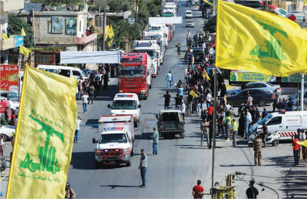
صهاريج المازوت الإيراني وصلت الى لبنان امس

والخارجية، ويدرك أيضاً محدودية المهمة المطلوبة منه، انقاذ ما يمكن انقاذه في الفترة الفاصلة عن الانتخابات النيابية بعدما تامن المناخ الدولي والاقليمي للتهدئة على الساحة اللبنانية، ولهذا تجاهل وجود وزراء ضعفاء على يمينه ويساره، وتجاهل أيضاً «الوزن الطابش» لصالح رئيس الجمهورية وصهره جبران باسيل، وكذلك «هالة» حزب الله المهيمنة على الحكومة، وارتضى بالمهمة لأنه لن يخسر شيئاً، بل يستثمر وجوده في السراي الحكومي انتخابياً، وهو طبعاً غير معني بمصالح اقرانه في نادي رؤساء الحكومة السابقين، فهو يرث ساحة سنوية ضعيفة لا قدرة لها على مواجهة الساحات الأخرى بعدما خسرت الدعم السعودي، وانتهكها رئيس تيار المستقبل سعد الحريري باخطائه ورهاناته «القاتلة»، ولهذا لا يبدو اليوم مهتماً بكل ما يثار حوله من «غبار» يدرك ان ارضاء اللبنانيين ليس صعباً بعدما تحولوا الى «شحادين»، اي تحسن في سعر العملة يعتبر انجازاً، واي تخفيض في اسعار المواد الغذائية سيكون نجاحاً، انتهاء الطوابير على المحطات سيسجل في سجله «الذهبي» حتى لو كان الثمن رفع الدعم، لم يعد احد مهتماً بحاسبة كل الطبقة السياسية التي يمثلها اليوم على رأس السلطة التنفيذية بالتسبب بسرقة «العصر»، ولهذا يعتبر نفسه منقذاً، ويقول لزاره أنه غير معني بضعف الكثير من وزراءه، «فانا» واجهة الحكومة وهي «انا» يقول ميقاتي، ولا داعي للتوقف امام تفاصيل صغيرة غير مهمة طالما ان «الشغل