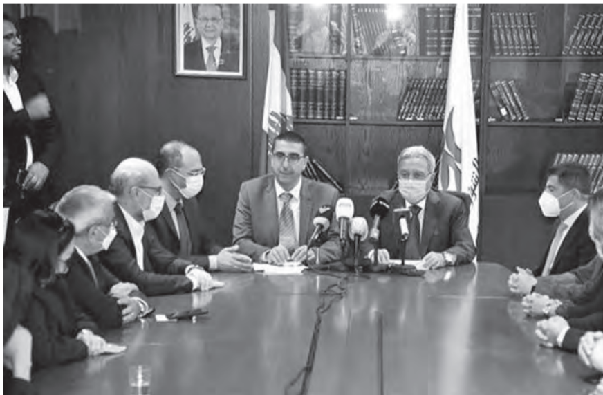
تسلم وتسليم بين مشرفية وحجار

بإنسانيتك، وان شاء الله تترجم خطة عملك الى مشاريع تكون على قدر طموحات اللبنانيين واللبنانيين. وللشعب اللبناني كلمة أخيرة: أشهد اني حاولت، بدوره، شكر حجار سلفه على «الجهود التي قام بها خلال فترة توليه الوزارة البلاد»، وقال: «لقد عمل جاهدا منذ اليوم الاول من تعيين هذه الحكومة الجديدة لتحضير عملية التسليم والتسلم مع شرح وتوضيح لكل ما تم العمل عليه لغاية اليوم»، مضيفا «لن أطيل الحديث كثيرا، سأكتفي بإعلامكم بأننا سنسعى لتأمين، خلال هذه الفترة الزمنية القصيرة، شبكة أمان اقتصادي اجتماعي صحي يسمح للمواطنين العيش بكرامة. إن الناس بانتظار تطبيق مشروع البطاقة التمويلية بشغافية، ونحن سنسبذل قصارى جهدنا لوضعه حيز التنفيذ».