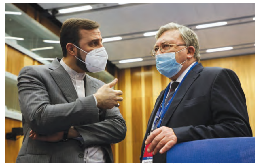
مندوباً روسيا وإيران الدائمان لدى المنظمات الدولية في فيينا