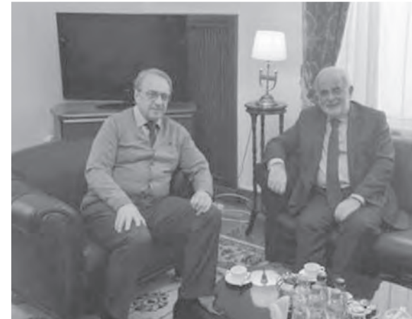
ابو زيد يزور بوغدانوف

زار مستشار رئيس الجمهورية العماد ميشال عون أمل أبو زيد امس، الممثل الخاص للرئيس الروسي إلى منطقة الشرق الأوسط وأفريقيا نائب وزير الخارجية الروسي ميخائيل بوغدانوف، وناقش الطرفان، بحسب بيان لوزارة الخارجية الروسية، «تطورات الأوضاع في الشرق الأوسط، ولا سيما في لبنان وسوريا، حيث رحب الجانب الروسي بتشكيل الحكومة الجديدة برئاسة نجيب ميقاتي، أملاً أن يكون التعافي الاقتصادي الاجتماعي سريعاً. كما جدد دعمه لسيادة الجمهورية اللبنانية واستقلالها ووحدتها وسلامة أراضيها وحقوق اللبنانيين في اتخاذ القرارات في كل القضايا الوطنية من دون أي تدخل خارجي. وبحث الطرفان في سبل تعزيز التعاون الروسي اللبناني بما يخدم المصالح المتبادلة للبلدين».