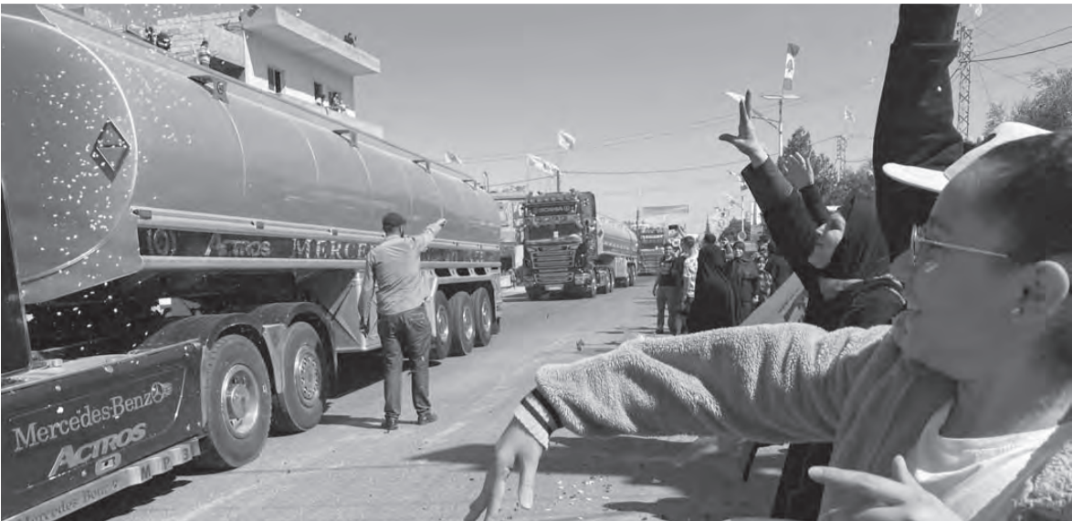
نسوة ينثرن الارز احتفاءً بوصول المازوت الإيراني

باسترجار الغاز، كما ساهمت في حلحلة الأمور وولادة الحكومة، وتراجع سعر الدولار..