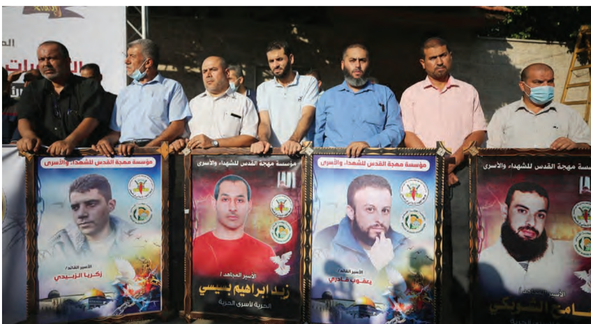
اعتصام احتجاجي على المعاملة السيئة بحق الأسرى في سجون العدو الإسرائيلي