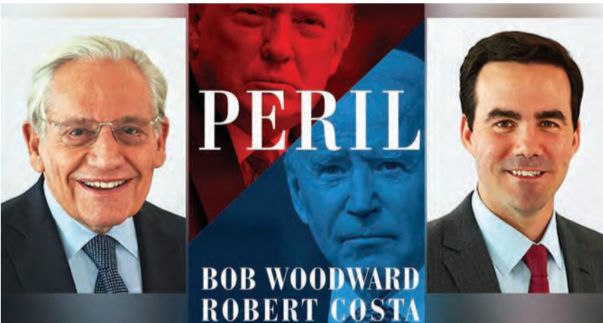
كتاب «بيريل» للصحفيين بوب وودورد وروبرت كوستا

سلط كتاب «بيريل» (خطر) للصحفيين بوب وودورد وروبرت كوستا، الضوء على الضغوط التي تعرض لها نائب الرئيس السابق مايك بنس لقلب نتائج انتخابات ٢٠٢٠ الرئاسية، واقتحام أنصار الرئيس الأسبق دونالد ترامب مبنى الكابيتول اعتراضاً على نتائج الانتخابات التي أفضت لفوز المرشح الديمقراطي، جو بايدن.