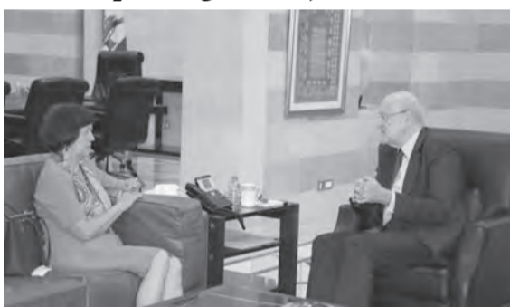
ميقاتي مستقبلاً فروتسكا

استقبل رئيس مجلس الوزراء نجيب ميقاتي المنسقة الخاصة للامم المتحدة في لبنان يوانا فروتسكا صباح امس في مكتبه في السراي الحكومية. «عرضنا خلال الاجتماع اولويات التعاون بين الأمم المتحدة ولبنان، واكدت أهمية إجراء الانتخابات النيابية، والقيام بكل الإصلاحات الاقتصادية والمالية. كما اطلعت على رؤية ميقاتي المستقبلية، وما يهمنا هو ان يكون لبنان ناجحاً ومزدهراً، ولكن نحن بحاجة لإجراء خطوات مهمة وجديّة لتلبية حاجات المواطنين اللبنانيين، ويجب ان تكون هذه الإصلاحات في قطاع الكهرباء، كذلك يجب استئناف المفاوضات مع صندوق النقد الدولي لأنها ستشكل خطوة أفضل لمستقبل لبنان»، مضيفة «اطلعتني ميقاتي على اولويات عمل الحكومة، وأكد أن الامم المتحدة مستمرة بمساعدة لبنان في المجالات كافة لا سيما في موضوع إجراء الانتخابات النيابية».