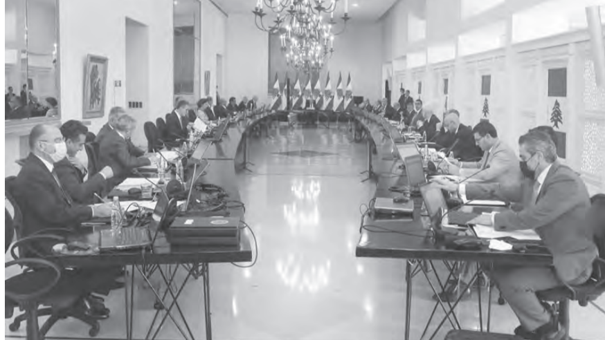
عون يتراأس الجلسة

تعديلات طفيفة عليه، وتقرر بناء على اقتراح الرئيس ميقاتي ان يكون شعار الحكومة: «معاً للإنقاذ».