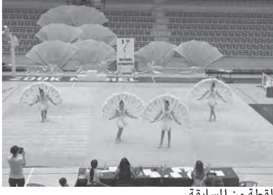
لقطة من المسابقة