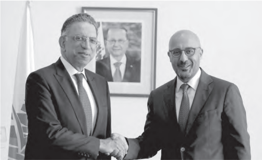
تسلم وتسليم بين قطار وياسين

تجسد بوزير البيئة، وهذا شرف لنا لأن نسلمك هذه الوزارة».