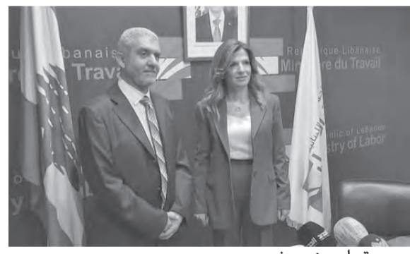
بيزم يتسلم من يمين

تمت عملية التسليم والتسلم في وزارة العمل بين وزيرة السابقة لينا يمين والوزير الحالي مصطفى بيزم. وحضر الحفلة مدير عام الصندوق الوطني للضمان الاجتماعي محمد كركي، رئيس مجلس إدارة الضمان بالوكالة