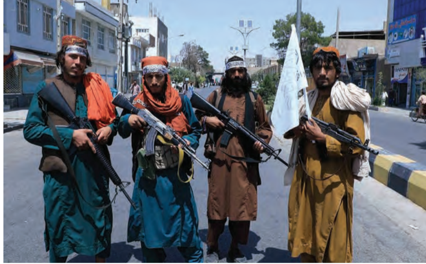
عناصر من طالبان

الوسطى». ومن جانبه، أكد وزير الخارجية الأميركي أنتوني بلينكن تجميد نحو ١٠ مليارات دولار من الأموال الأفغانية. وخلال جلسة استماع أمام لجنة العلاقات الخارجية بمجلس الشيوخ، قال بلينكن إن واشنطن لن تفرج حالياً عن أي من أموال الحكومة الأفغانية المنهارة لحكومة تقودها طالبان، مشيراً إلى أن الإفراج عن أي أموال لطالبان مرهون بوفائها بالتزاماتها وتعهداتها الدولية. وأوضح الوزير أن الرئيس جو بايدن كان أمام خيارين عندما تعلق الأمر باتخاذ قرار بشأن أفغانستان: إما سحب القوات وإنهاء الحرب، أو التصعيد. وأضاف بلينكن خلال الجلسة أن قرار (التتمة ص ١٢)