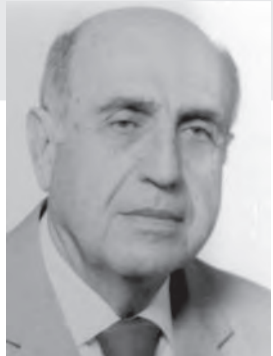
اعداد : لوران ناكوزي