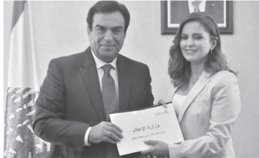
تسلم وتسليم بين عبد الصمد وقرداحي

وكانت كلمة مختصرة لقرداحي، الذي أثنى على «الإنجازات التي حققتها عبد الصمد في هذه المرحلة الصعبة، مضيفاً «جنّت الى الوزارة من رحم الاعلام، وأشعر بمعاناة الاعلام بشكل عام وزملائي الاعلاميين ومعاناة المؤسسات الاعلامية الخاصة، وأتمنى ان أتمكن خلال تولي مهام الوزارة إنجاز مشاريع جديدة». وأشار الى انه سيطلع على القوانين والمشاريع التي تحدثت عنها الوزيرة عبد الصمد وسيرسها ويتابعها ويعمل على إنجازها، «لا سيما التي تصب في مصلحة لبنان والاعلام في لبنان بشكل خاص، فالمسؤولية استمرارية». وفي الختام، سلمت عبد الصمد قرداحي ملفا عن الإنجازات والمشاريع في الوزارة.