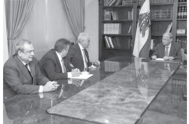
عون مع وفد المصارف

أضاف: «ان الحاجات المطلوبة غير محدودة وهي كثيرة وفي سثنى القطاعات، لذلك من أولويات الخطة التي عرضتها على المراجع الدولية المعنية بمساعدتنا تقوم أولاً على محاربة الفقر ما يترافق مع استقرار العملة الوطنية، التي من الواجب تثبيت سعر صرفها، بصورة طبيعية. ومن ثم سنبداً بالمشاريع الكبرى وفي اولويتها الطاقة التي هي حاجة لكل منزل، لا سيما لجهة انشاء محطات انتاج للكهرباء وصولاً الى بناء دولة حديثة، بالتعاون بين القطاعين العام والخاص.»