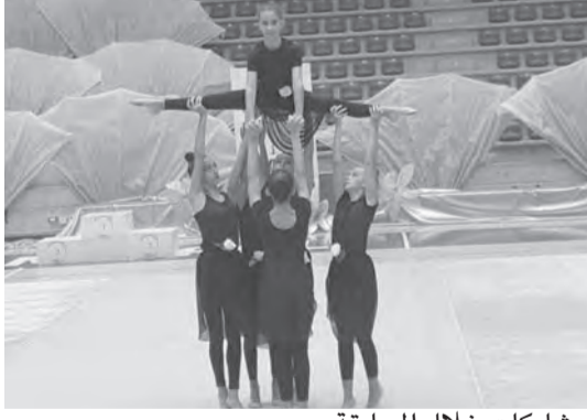
مشاركات خلال المسابقة