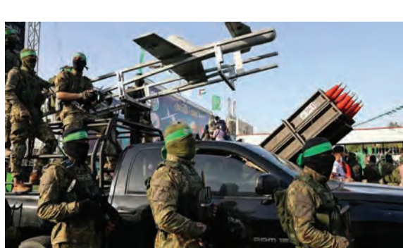
تعاظم قوة حماس

قادة الجيش الإسرائيلي في المحكمة الجنائية في لاهاي». وأوضح أنه لم يمنع وزير الدفاع بيني (التتمة ص ١٢)