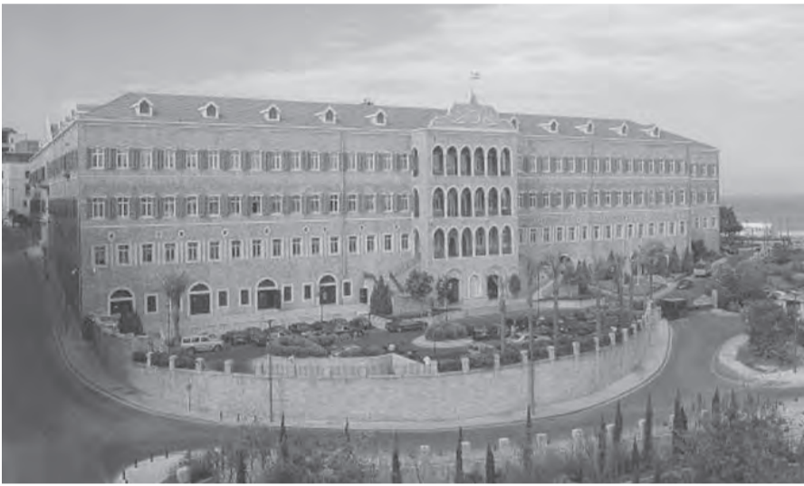
قائد الجيش عرض مع سفيرة إيطاليا

وفي كل الأحوال، فإن الكتل النيابية سوف تمنح الحكومة الثقة، بهدف منحها الفرصة لإطلاق ورشة العمل الى معالجة الأزمات المترابطة التي يعاني منها اللبنانيون، وأبرزها انهيار العملة الوطنية وزعزعة معادلة الإستقرار الإجتماعي، على أن يكون الإجراء الأول تأمين الإستقرار النقدي وتثبيت سعر الصرف، والإنطلاق من هذا الأمر إلى تحقيق الخطوات الإصلاحية المطلوبة وذلك قبل الوصول إلى الإستحقاقات الإنتخابية الداهية وخلال أشهر معدودة. ومن هنا، فإن الأوساط نفسها تشير الى أن جوهر البيان الوزاري، يتملُّ في تحقيق التناغم بين بنوده وتطورات الواقع الفعلي على الساحة الداخلية، وذلك في كل المجالات الإجتماعية والإقتصادية والصحية والتربوية، مشددةً على أن غالبية الوزراء متفقون على النقاط الأساسية وما من عقبات بارزة أمام اللجنة الوزارية المختصة لكي تنتهي من إقراره. وفي هذا الإطار، تكشف الأوساط النيابية نفسها عن أن الحكومة الحالية هي تحت المجهر الدولي وهي تشكل الفرصة التي من الواجب اقتناصها، واستغلالها لتحقيق التقدم في مسيرة إعادة بناء الدولة، ولذلك فإن مسألة إقرار البيان والثقة النيابية، لا يجب أن تشكل عائقاً أمام تأمين الإنطلاقة السريعة التي أعلن عنها رئيس الحكومة في الجلسة الحكومية الأولى وفي جلسات إعداد البيان الوزاري. وبالتالي فإن برنامج الحكومة والذي ستعرضه وبشكل مقتضب في بيانهها، لا يتعارض مع تطوعات كل الأطراف السياسية على اختلاف توجهاتها، كما لا يتباين مع كل العناوين والشعارات التي رفعها اللبنانيون في الشارع والذين يطالبون بالدرجة الأولى بالإصلاح على كل المستويات وفي كل المجالات، علماً أن الإصلاح هو الطريق السريع لتدارك حالة الإنهيار الشامل نتيجة الشلل الذي أصاب سائر القطاعات خلال الأشهر الماضية.