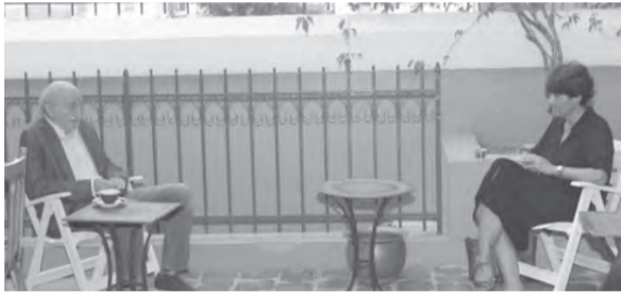
السفيرة الفرنسية عند جنبلاط

صدر عن مفوضية الاعلام في الحزب التقدمي الاشتراكي، ما يأتي: «استقبل رئيس الحزب التقدمي الاشتراكي وليد جنبلاط، في كليمنصو، السفيرة الفرنسية في لبنان أن غريبو، في حضور مفوض شؤون الخارجية في الحزب زاهر رعد، وعرض معها التطورات السياسية الراهنة.» وثلقت السفيرة الفرنسية يرافقتها المستشار السياسي في السفارة جان هيلبرون، رئيس حزب «القوات اللبنانية» سمير ججعج، في المقر العام للحزب في معراب، في حضور رئيس جهاز العلاقات الخارجية في «القوات» الوزير السابق ريشار قيومجيان. وقد تابحت المجتمعون في التطورات السياسية في لبنان عقب تأليف الحكومة.