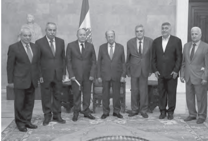
(دا لاتي ونهرا) ومع وفد العمالي