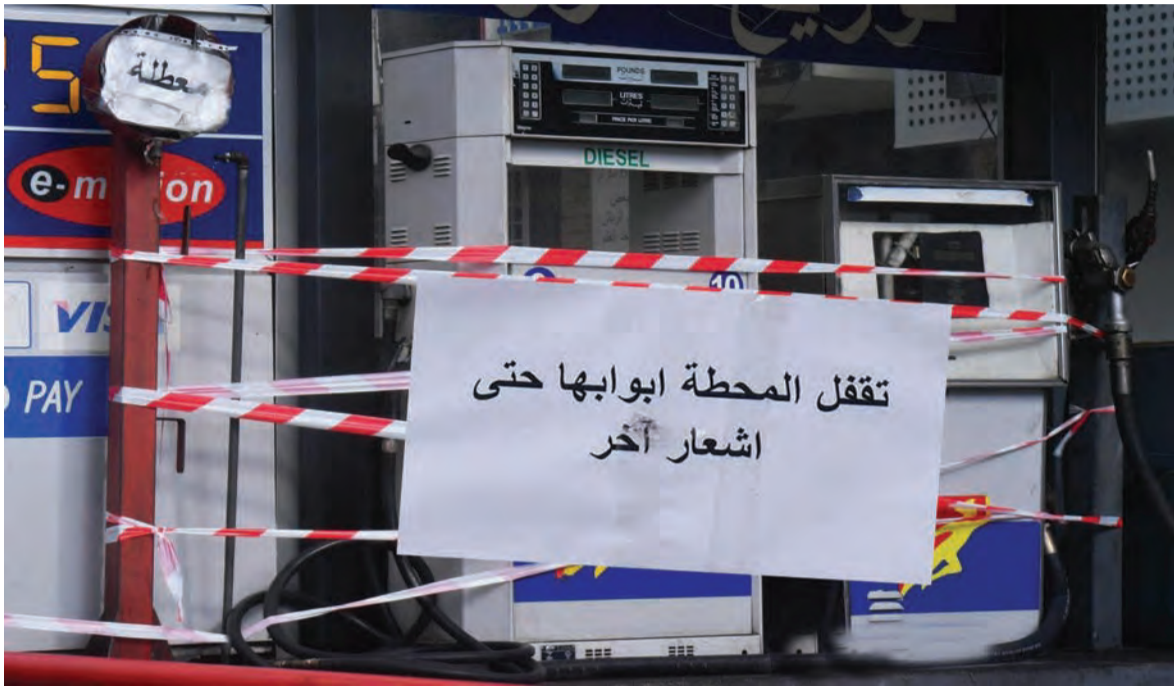
هل ستعاود محطات الوقود فتح ابوابها؟

قراراته واتهامه بتسريب الأسماء الى الإعلام وهذا الاشتباك سيوشل البلد بانتظار مخرج ما، لم يتم التوافق عليه في اجتماع لجنة صياغة البيان الوزاري حيث بقي بند رفع الحصانات المتعلق بانفجار المرفأ موضع خلاف بين أعضاء اللجنة ولم يتم التوصل إلى صيغة توافقية وترك الحسم لاجتماع اليوم في القصر الجمهوري. كذلك لم يحسم ملف أزمة المصارف ومقاربة الحلول مع الحرص على استقرار سعر الدولار، كما ان ملف الكهرباء شهد تجاذبات حول جدوى بناء معامل جديدة ولم تتضمن مسودة البيان اي إشارة لبناء المعامل. كما ركز البيان على التحقيق الجنائي الشامل في كل مؤسسات وصناديق الدولة والتعاون مع المجلس النيابي لقرار الكابيتال كونترول علما ان مسودة البيان من ٧ صفحات و تضمنت الحفاظ على أموال المودعين واعادة التفاوض مع البنك الدولي وصندوق النقد الدولي. و اشار البيان بالمبادرة الفرنسية وتعزيز العلاقات مع الدول العربية، وركز على الهموم المعيشية وسلة إصلاحات، وقد انجز البيان بعد ٣ جلسات على ان يقر في اجتماع اليوم اذا ازيلت التباينات تمهيدا لتوزيعه على النواب وعقد جلسة الثقة أوائل الاسبوع المقبل. ونفت مصادر حكومية وجود أي تباينات داخل اللجنة، وان البند المتعلق بالمقاومة أنجز دون اعتراضات مع اعتماد الصياغة نفسها الواردة في حكومتي الحريري