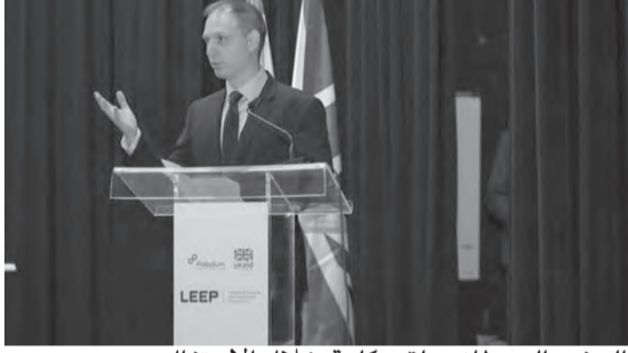
السفير البريطاني يلقي كلمة خلال الاحتفال

وتيرة الأزمات وتفاقمها وانعاسها بشكل مأساوي على الشعب اللبناني. وفي هذا السياق، يقدم تقرير السياسات الإصلاحية الصادر عن برنامج «LEEP» والنقاشات التي شهدها الحفل الختامي، رؤية استراتيجية للخطوات الواجب إتباعها من قبل الحكومة الجديدة من أجل دعم القطاع الخاص بشكل عاجل، وبالتالي إعادة تفعيل مقومات التعافي الاقتصادي في لبنان»، مضيفاً «مع العلم أن الإصلاحات الطروحة معروفة بمعظمها لكن المطلوب هذه المرة أن يتحمل السياسيون والقادة مسؤولياتهم، وأن يتم اشراك المجتمع اللبناني ككل، على أن يتابع مسار التقدم بشكل واضح شفاف، وأن يتمحور العمل حول مصلحة لبنان بأكمله».