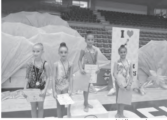
نتيجة احدى الفئات