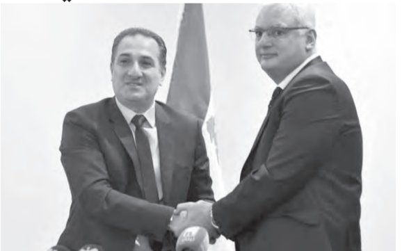
القرم يتسلم من حواط

اللبنانية، سجلت الإيرادات من شركتي الخليوي حوالي ٦٩٪ في العام ٢٠٢٠ تقريباً، لتصبح هذه الإيرادات ٧٤,١٪ في الأشهر الستة الاولى من العام الحالي، وتكون النسبة الأعلى في تاريخ وزارة الاتصالات، كما وبلغت عائدات الشبكة الثابتة نحو ٧٠٪ في العام ٢٠٢٠ ونحو ٧٢٪ في الأشهر الستة الاولى من العام الحالي وهي أيضاً النسبة الأعلى في تاريخ الوزارة.»