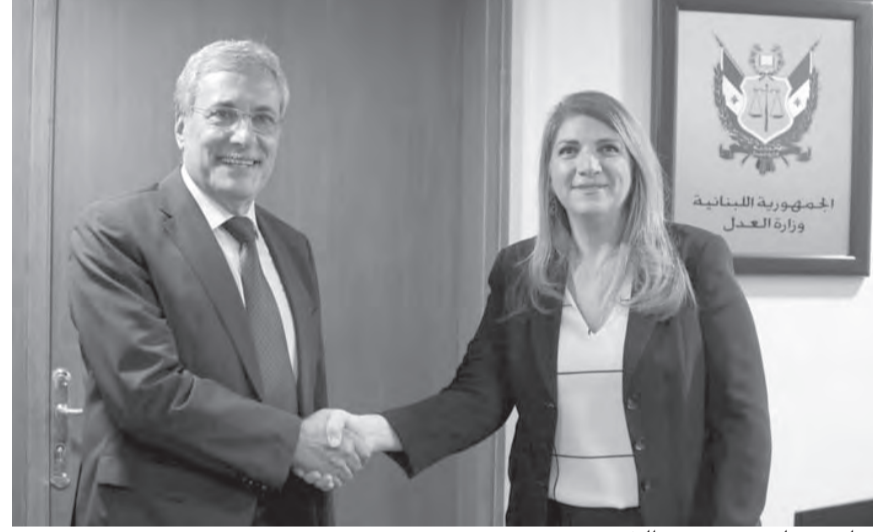
تسلم وتسليم بين نجم والخوري

بدوره، أكد وزير العدل القاضي هنري الخوري، أنه «لا شك ان القضاء العدلي هناك استحقاقات داهمة منها اكمال عقد مجلس القضاء الاعلى الذي كنت انت قد باشرت فيه ولسوء الحظ لم ينته، اتمنى ان تتمكن من القيام بهذه المهمة، اضافة الى تثبيت التشكيلات والمناقلات بما فيها محاكم التمييز وانتداب القضاة، وكلها مهمات اتمنى ان تتحقق كلها خلال فترة قريبة كي تستطيع العدلية نشاطها كما يجب وهذا ما يتمناه الجميع».