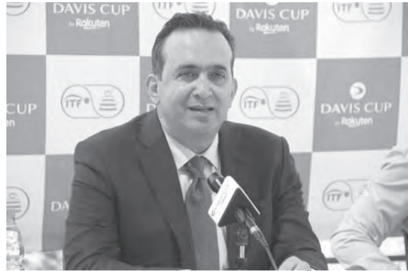
رئيس الاتحاد أوليفر فيصل يلقي كلمته