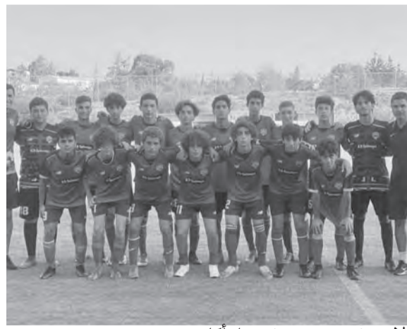
لاعبو فريق بيروت فوتبول اكايمي

قفزة نوعية لافتة لـ «بيروت فوتبول اكايمي» (BFA) بعد اختيار ٦ لاعبين من فريق الناشئين لديها (مواليد ٢٠٠٦) للانضمام الى نادي أيك لارنكا القبرصي في الموسم المقبل، وذلك اثر المعسكر الذي اقامته الأكاديمية اللبنانية في الجزيرة المتوسطية. وكان فريق «بيروت فوتبول اكايمي» الذي حقق انجازاً استثنائياً هذه السنة بتتويجه بلقب محافظة جبل لبنان لاندية الدرجة الرابعة، قد خاض عدداً من المباريات على هامش معسكره القبرصي حيث تعادل مع أيك لارنكا ٠-٠، وفاز على أوبولون ٠-٠، وعلى أسيل بنتيجة كبيرة ٠-١، مما لفت الأنظار الى ٦ من نجومه ليتم اختيارهم من قبل الفنيين في نادي أيك الذي كان قد وقّع اتفاقية تعاون مع الأكاديمية التي اعتادت على تخريج المواهب في الكرة اللبنانية.