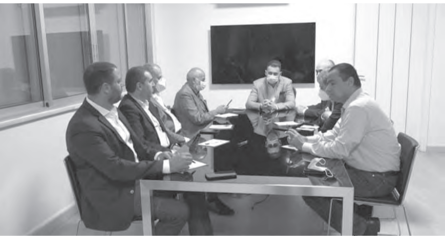
تيمور جنبلاط يترأس الاجتماع

رحب كتلة «اللقاء الديموقراطي» في اجتماعها الدوري الذي عقد في كليمنصو برئاسة النائب تيمور جنبلاط، بتشكيل الحكومة الجديدة، بعد أن تأخرت لأكثر من ١٣ شهراً فاقتمت على اللبنانيين الكثير من الأزمات، التي لا بد للحكومة أن تنبري بكل جهد وجدية لمعالجتها فوراً من بوابة الإنكباب على العمل الحثيث وتطبيق الإصلاحات المنتظرة التي وحدها توقف النزف في القطاعات الحياتية وتفتح الباب أمام استعادة ثقة الناس، لا فقط الثقة النيابية. وشددت الكتلة في بيانهها «على الضرورة القصوى لإصدار البطاقة التمويلية بأسرع وقت لا الاكتفاء بالإعلان الشكلي لها، وأن تطبق عليها كامل معايير الشفافية والتوزيع العادل للمبايع عن أي استغلال سياسي مع التأكيد على وقف الدعم الزائف الذي