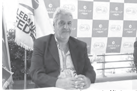
امين عام الاتحاد ريمون كتورة