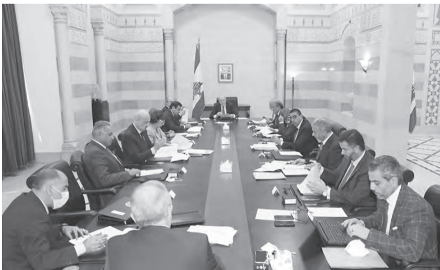
ميقاتي ترأس امس اجتمع لجنة صوغ البيان الوزاري

ينتظرون ترجمة الأقوال بالأفعال سريعاً على أرض الواقع بعد نيل الحكومة الثقة.