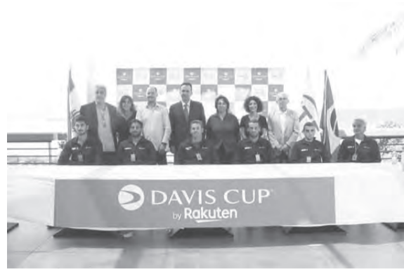
رئيس واعضاء الاتحاد مع الفريق اللبناني