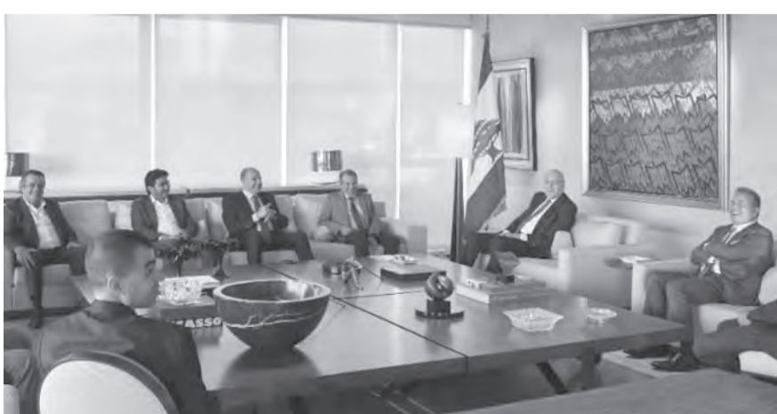
وقد تكلت «لبنان القوي» يزور ميقاتي

ومتطلباته الحياتية وكل ما له علاقة بتوفير مكانة الدولة وهيبته ودورها الراعي لشؤون أبنائها بدون تفرقة بين منطقة وأخرى ليسود العدل بين اللبنانيين جميعاً.»