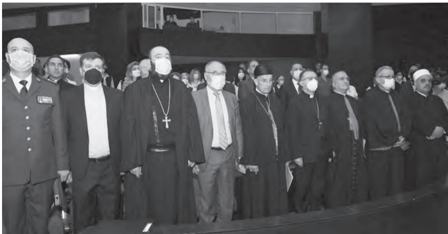
المشاركون في افتتاح المؤتمر

نحو الأطراف والتقرب من المؤمنن. ثم قال الراعي: «وسط إشكالية هذه الأزمات، يأتي موضوع المؤتمر «نحو إمكانيات جديدة»، ليشكل تحدياً يؤمن بيزوغ فجر جديد. من بين هذه الإمكانيات ثلاث: الأسرة التربوية، ومفهوم المدرسة الكاثوليكية، والتنسيق بين مدارسنا.