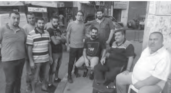
نقيب سائقين مجتمعاً بوفد المعاينة

ولهام بعد إعادته الى كنف الدولة وحكما حفظ حقوق عماله وموظفيه ورفض اي اجراء تعسفي بحقهم من قبل الشركات المشغلة وتحميلها مسؤولية الضرر اللاحق بهم. وأكد السيد الحاجة إلى «قرار ثابت وواضح وضوح الشمس لملف المعاينة»، واثقا من أن ذلك سيحصل حكما مع حكومة نعمل عليها لوضع حد لأي تطور سلبي في اي مرفق».