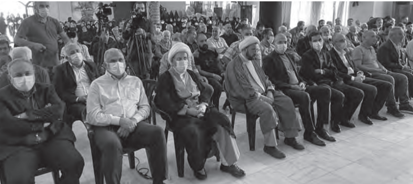
يزبك في الاحتفال التابيني ببعليك

وقال: «المسؤولون والزعماء الذين لم يدم قلوبهم بتعجير قلب العاصمة، وسقوط الضحايا، وتدمير المنازل والأحياء، ولم يحرك ضمائرهم وضع اللبنانيين المزري، الذين يموتون جوعاً ومرضاً ودلاً، كانوا غير مباينين بضياح الوقت والفرص. سنة مرت والبلد يتخبط بلا حكومة تتحمل المسؤولية وتعمل من أجل الإنقاذ، فيما كانوا منشغلين بتقاسم الحقائب والحصص، يتلهون بالمطالب والفيوتيات والمنكفات، أما الآن، وقد توصلوا