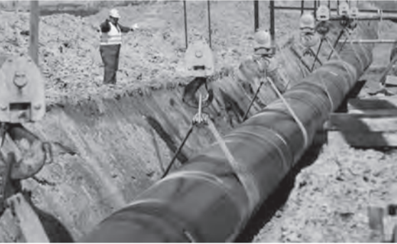
تمرير الغاز المصري عبر سوريا

عبر سوريا، بدعم من البنك الدولي. وذلك بعدما ايدت واشنطن استعدادها لاستثناء المشروع من عقوبات قانون قيصر. وكان وفداً وزارياً لبنانياً رفيع المستوى زار دمشق السبت ٤ سبتمبر، للمرة الاولى منذ عشر سنوات. ولولا «نسيان» وضع العلم اللبناني لأمكن القول ان بروتوكول الزيارة سار بشكل جيد.