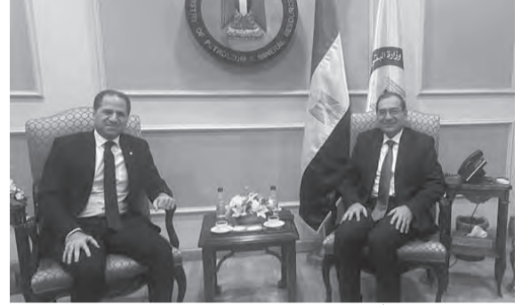
الجميل يزور الملا

زار رئيس حزب الكتائب اللبنانية سامي الجميل القاهرة، حيث التقى عددا من المسؤولين لمناقشة ملفات تهم البلدين. وقد التقى الجميل أمس وزير البترول والثروة المعدنية المهندس طارق الملا، واستمع منه الى «آخر تطورات ملف استرجار الغاز المصري الى لبنان عبر الأردن وسوريا بكل أبعاده التقنية والسياسية». كما لفت الى «بعض العراقيل التي يمكن أن تظهر لاحقا وسبل معالجتها».