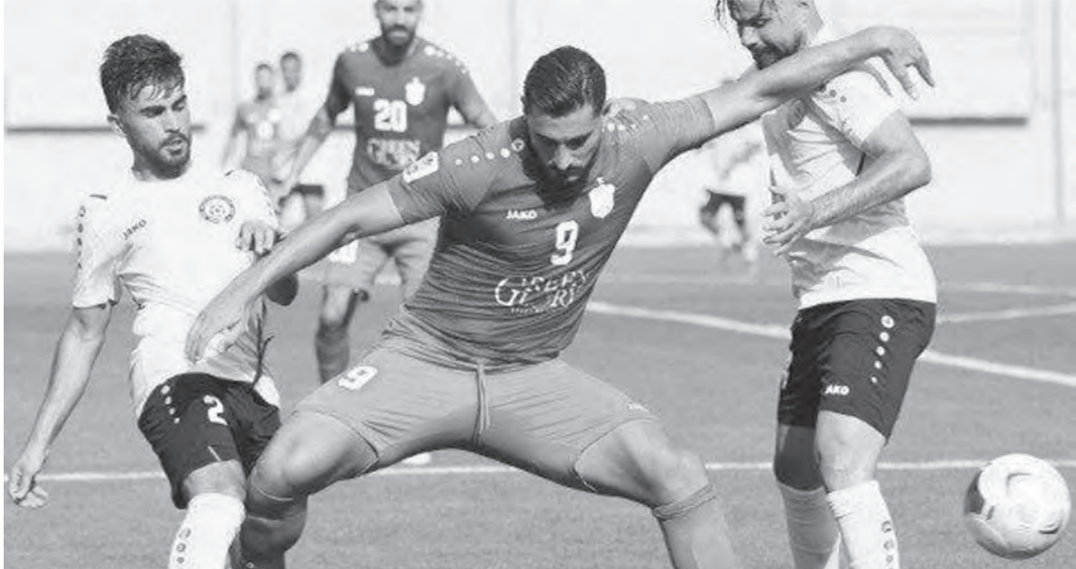
من مباراة البرج والأناصر

حقق البرج فوزاً مثيراً على حساب الأناصر بنتيجة ١-٠ في المباراة التي جرت أمس الأحد على ملعب أمين عبد النور في بحدسون ضمن منافسات الجولة الأولى من الدوري اللبناني لكرة القدم.