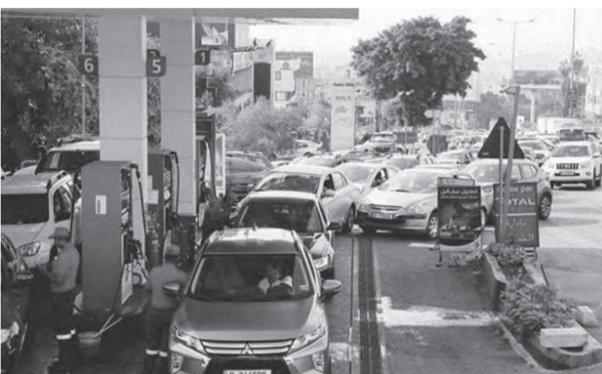
بداية كارثية للمحروقات

على أساس رفع الدعم»، متسانلاً عن «الالية التي سيعتمدها مصرف لبنان عند رفع الدعم، هل سيؤمّن هو الدولارات للشركات المستوردة أو سيذهب الى تحرير الاستيراد وتقوم الشركات هي بتأمين الدولارات من السوق السوداء». مشيراً الى «ضرورة عقد اجتماع بين وزارة الطاقة والشركات المستوردة واصحاب المحطات للبحث في جعلة المحطات وفي آلية تطبيق رفع الدعم في حال اعتمد تحرير الاستيراد».