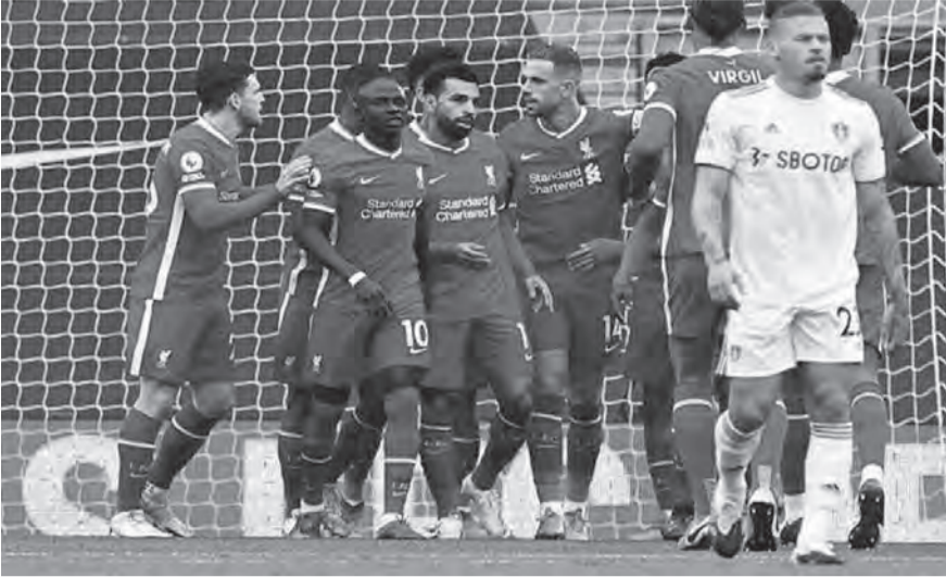
فرحة لاعبي ليفربول

وافتح كالباري التسجيل من ركلة جزاء نفذها جواو بيديو (١٦)، وعادل جنوى الكفة (٥٩) عن طريق ماتيا ديسترو. وأحرز الجزائري محمد فارس الهدفين الثاني والثالث لجنوى في الدقيقتين (٩٩ و٧٨). وفاز تورينو على متذبل ترتيب الدوري الإيطالي ساليرينيتانا برباعية نظيفة، في اللقاء الذي احتضنه ملعب (أولمبيكو دي تورينو).