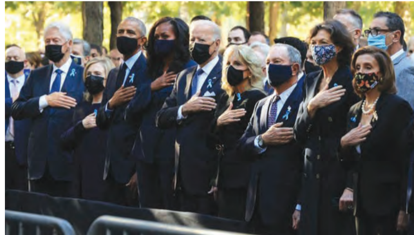
بايدن والرؤساء السابقين امام النصب التذكاري لذكرى هجمات ١١ ايلول

دعا الرئيس الأميركي جو بايدن مواطنيه إلى الوحدة «أعظم قوة لدينا»، وذلك في رسالة مسجلة نُشرت الجمعة عشية الذكرى العشرين لهجمات ١١ ايلول. وقال الرئيس في رسالته المسجلة في البيت الأبيض وتزيد مدتها عن ٦ دقائق بقليل «هذا بالنسبة إلى هو درس المركزي لـ ١١ ايلول وهو أنه عندما نكون الأكثر عرضة للخطر (...) فإن الوحدة هي أعظم قوة لدينا».