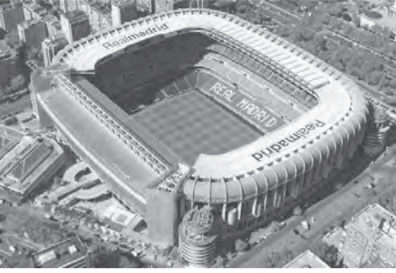
ملعب سانتياغو برنابيو

تنتظر جماهير ريال مدريد الإسباني مشاهدة ملعب فريقها التاريخي سانتياغو برنابيو، عندما تتم إعادة افتتاحه في ثوبه الجديد. وأغلق ملعب سانتياغو بيرنابيو لمدة ٥٦٠ يوما بسبب جائحة كورونا وأعمال التحديث ومن المقرر أن يستضيف أول مباراة على أرضه بعد إعادة افتتاحه اليوم الأحد، بين ريال مدريد وسيلتا فيغو، في الجولة الرابعة من الدوري الإسباني. وقررت إدارة ريال مدريد الحالية الوفاء بوعدها تجاه لورينزو سائز، الرئيس الأسبق للنادي الملكي، الذي توفي في آذار ٢٠٢٠ متأثرا بفيروس كورونا، وذلك قبل انطلاق المباراة الأولى على ملعب سانتياغو برنابيو الجديد، عبر تنظيم تكريم خاص له. وكان سائز ترأس ريال مدريد بين عامي ١٩٩٥ و٢٠٠٠، وهي فترة توج فيها الملكي بـ٨ ألقاب، بينها لقبان لدوري أبطال أوروبا،