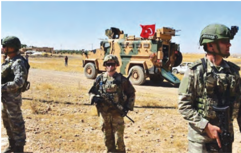
استنفار تركي في ادلب

أقدمت دورية تابعة لـ«قسد» على إطلاق النار على أحد وجهاء عشيرة العبد الجادر التابعة لقبيلة البكاره في قرية أم مدفع جنوب محافظة الحسكة، ما أدى إلى إصابته وشقيقه ونقلهما لأحد مشافي الحسكة وهما في حالة خطيرة.