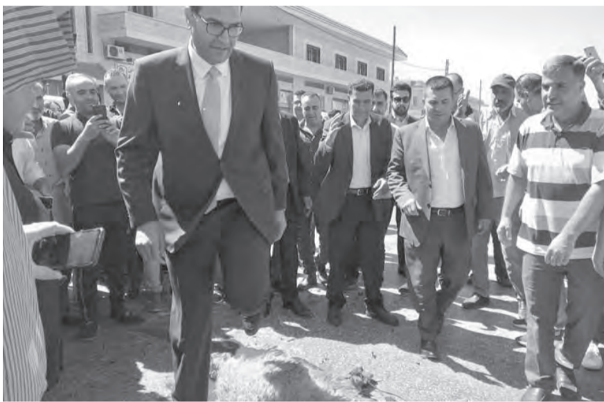
خلال الاحتفال بالحاج حسن

استقبلت منطقة بعلبك وزير الزراعة عباس الحاج حسن، باحتفالات شعبية أعدت له عند مداخل بلدي الحلائية وحوش النبي، واستقبل عند مفرق بلدته شعت بنحصر الخراف وبالأهازيج ورش الورود والأرز، ولافقات ترحيبية. وغصت دارته في بلدة شعت بوفود المهنيين، وألقى الشيخ كامل العرب كلمة باسم أهالي البلدة رحب فيها به، منوهاً بمناقبته، مؤكداً أنه «الرجل العصامي المناسب في المكان المناسب».