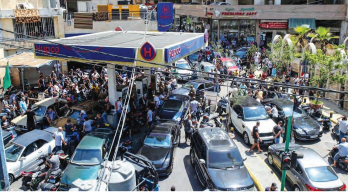
«طوابير الذل» ومعاناة المواطنين مستمرة