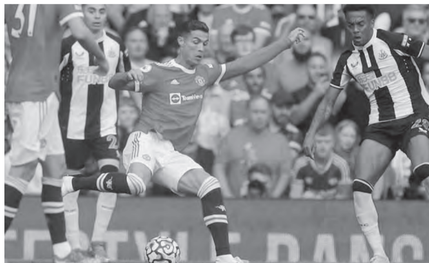
رونالدو بين لاعبين من نيوكاسل

استعرض مانشستر يونايتد قوته في المشاركة الأولى لنجمه كريستيانو رونالدو، وتغلب على ضيفه نيوكاسل بنتيجة (٤-١)، في المباراة التي احتضنها ملعب أولد ترافورد أمس السبت، ضمن لقاءات الجولة الرابعة من الدوري الإنجليزي الممتاز. وسجل رباعية اليونانيد روناودو هدفين (٤٥-٦٢) وبرونو فيرنانديز (٨٠) وجيسي لينجارد (٩٠)، بينما سجل هدف نيوكاسل الوحيد خافيير مانكييو (٥٦). وبهذه النتيجة رفع اليونانيد رصيده إلى ١٠ نقاط ليرتقي إلى صدارة جدول الترتيب، بينما تجمد رصيد نيوكاسل عند نقطة وحيدة في المركز الـ٩. وسقط فريق توتنهام في فخ الخسارة صفر-٣ أمام كريستال بالاس. وسجل أهداف كريستال بالاس ويلفريد زاها في الدقيقة ٧٦ من ركلة جزاء وادرسون ادوارد (٢) في الدقيقتين ٨٤ والثالثة من الوقت بدل الضائع. واضطر فريق توتنهام للعب بعشرة لاعبين منذ الدقيقة ٥٨، بعد طرد غافيتي تانغانغا. وتوقف رصيد توتنهام عند ٩ نقاط في صدارة الترتيب مؤقتا، فيما رفع كريستال بالاس رصيده إلى ٥ نقاط في المركز الحادي عشر. وفي باقي النتائج، فاز مانشستر سيتي على ليدستر سيتي (١-٠)، وأرسنال على نوريتش سيتي (١-٠)، ولوفرهامبتون على واتفورد (٢-٠)، وبرايثون على برينتفورد (٠-١)، وتعادل ساوثمبتون مع وست هام (٠-٠).