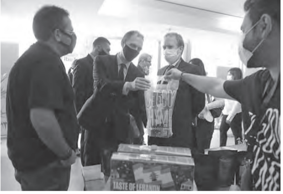
اختتام فعاليات تطوير الأعمال

اختتم «برنامج تطوير الأعمال والتوظيف في لبنان LEEP» الممول من وزارة التنمية الدولية البريطانية (UK Aid) والذي نفذته شركة الاستشارات الدولية «بالاديو» بفعالياته، خلال يوم احتفالي شامل أقيم في المعهد العالي للأعمال ESA - كليمنصو، ونقل مباشرة عبر منصة تفاعلية خاصة، وذلك بعد ٤ أعوام من الجهود المتواصلة.