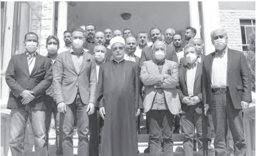
تيمور جنبلاط ووفد كتلته عند أبي المنى

مضيفاً «من خلال وجودكم هنا رسالتي لكل قيادات الطائفة، بأن هذا الموقع هو لجمع الشمل، وكلنا سوياً لنلزم بنهج الطائفة التاريخي والوطني والعربي والاسلامي والتوحيدي لنكون يدا واحدة، ومهما كانت البقايات في السياسة رجائاً ان تكون يدا واحدة لمواجهة المصاعب وببركة المشايخ الاجلاء».