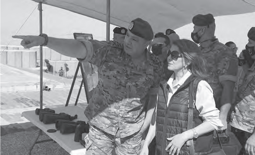
قائد الجيش تفقد والرومي المراكز الحدودية في رأس بعلبك

ودشن «نصب فجر التحرير» أيضا. كما وضع حجر الأساس لمركز تابع لديرية المخابرات في بلدة القاع بحضور فاعليات المنطقة. والقى عون كلمة نوه فيها ب«التضحيات التي يقدمها العسكريون، لا سيما في ضوء تشعب المهام التي يقومون بها بالتزامن مع ضائقة اقتصادية ومعيشية خانقة»، داعياً إياهم إلى «النبات في هذه المحنة التي يمر بها إيماننا بلبنان وللوقوف بجانب المواطنين الذين يتقون بهم. كما نوه بأداء العسكريين والتزامهم المهامت المطلوبة منهم بحرفية وانضباط، رغم الظروف الصعبة والضائقة التي يعيشونها».