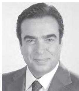
- جورج القرداحي