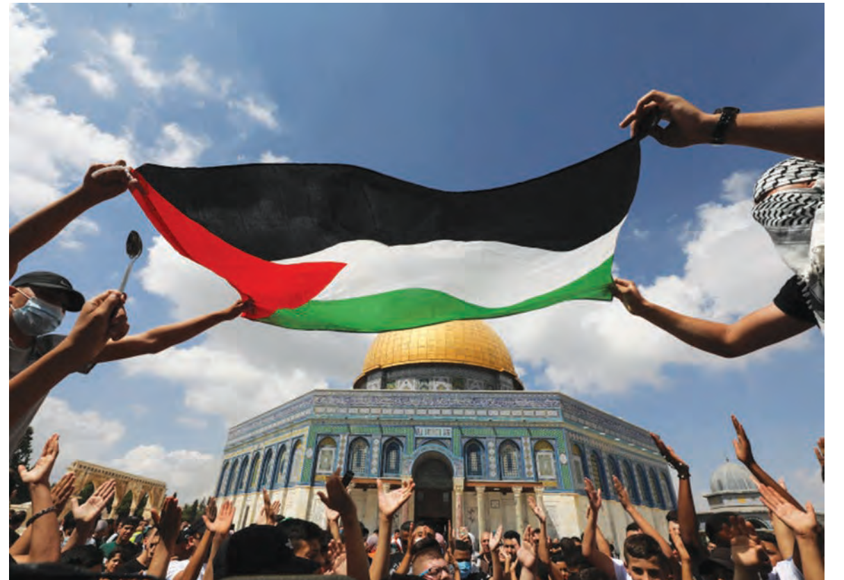
وقفة في ساحات الأقصى رفعت فيها الأعلام الفلسطينية

على صعيد آخر، شدد وزير الخارجية الإسرائيلي يائير لايبيد على أن تل أبيب لن تتسامح مع وجود إيران عسكرياً