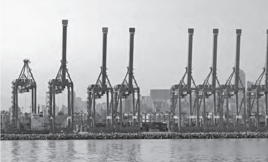
تفعيل عمل محطة الحاويات

وأوضح زخور أن «تراكم الأزمات وأبرزها انفجار المرفأ كان لها تداعيات مأسوية على عملنا، ولا