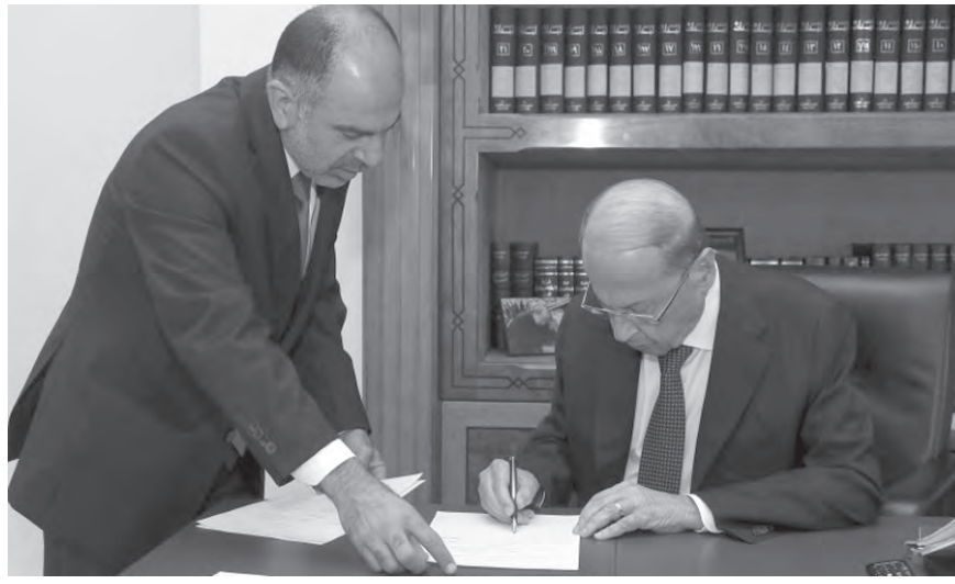
عون يوقع مراسيم التشكيل (الداخلي ونهرا)

من الانهيار الحاصل، ومن «جهنم» التي كان يتوقّع أن يشهدها مع قرار رفع الدعم الكلي عن المحروقات والمواد الحيوية والحباتية، ولكي تعمل أيضاً على تأمين كل ما يحتاج إليه الشعب اللبناني من خلال تطبيق الإصلاحات المطلوبة وتنفيذ الخطة الاقتصادية الإنقاذية لإعادة الطبعية. وهذا الأمر يدخل في باب تنافس أميركا مع إيران على مساعدة لبنان، وما يهّم الشعب اللبناني هو إعادة بلده إلى مسا كان عليه لكي تتوقف موجة الهجرة التي تضاعفت بنسبة كبيرة خلال الأشهر الأخيرة بسبب الأزمة الاقتصادية الخانقة وفقدان المواد والسلع الغذائية والأدوية من الأسواق بفعل التخزين والاحتكار من قبل بعض التجار الجشعين. ورأت الأوساط نفسها أنّ التوافق قد حصل بين فريقين النزاع على قاعدة «لا غالب ولا مغلوب»، على ما يجب أن تكون عليه الأمور في لبنان على جميع الصعد. ولهذا تحدث ميقاتي عن أنّ «لا ثلث معطل» في الحكومة، وأنّ كل من يريد التعطيل فليذهب إلى بيته، سيما أنّ الوضع المتدهور في البلاد لم يعد يحتمل لا «التأجيل» ولا «التعطيل».