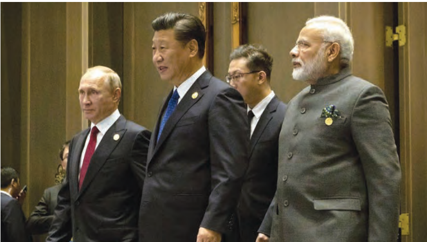
خلال اجتماع دول الـ «بريكس»

وأكدت المجموعة، في ختام قمة برئاسة الهند، على أهمية تسوية الملف النووي الإيراني بطرق دبلوماسية، ووفقاً للقانون الدولي، فيما شدّد الرئيس الصيني على أنّ المجموعة أصبحت الشامل، ومنع محاولات المنظمات الإرهابية لاستخدام الأراضي الأفغانية.