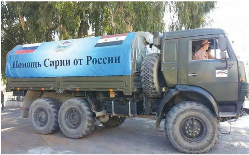
مساعدات روسية سورية مشتركة في ريف حمص الغربي