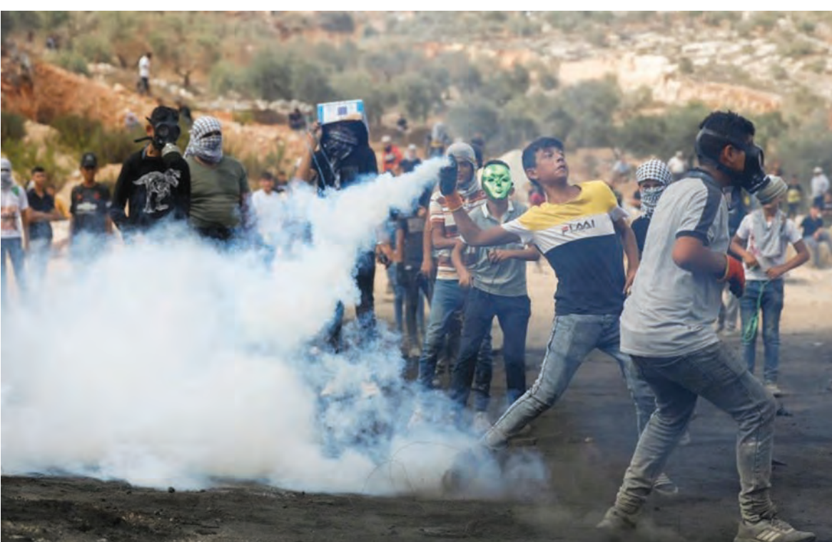
قوات الاحتلال استخدمت قنابل الغاز لتفريق المحتجين في بلدة بيتا بالضفة