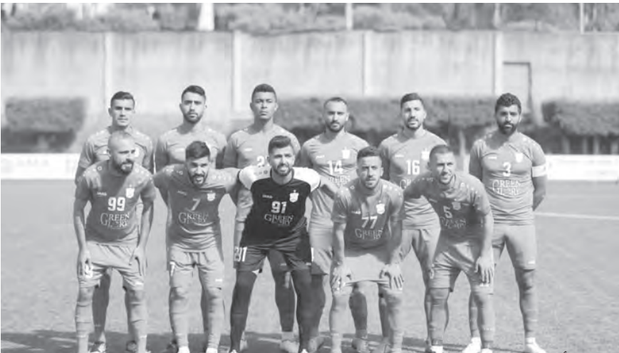
فريق الأنصار حامل اللقب

تنتقل اليوم السبت مباريات النسخة رقم ٦٢ من الدوري اللبناني بمشاركة ١٢ فريقاً. ويتطلع فريق الأنصار بطل الثنائية الموسم الماضي للدفاع عن لقبه وتعزيز رقمه القياسي البالغ ١٥ لقباً في الدوري المحلي. في حين يسعى وصيفه النجمة نحو التعويض والتتويج بلقب رسمي تاسع في المسابقة، بعد طول انتظار. وتقام البطولة الحالية من مرحلة ذهاب واحدة، مثلما كان الحال عليه في الموسم الماضي، وبعدها تقسم الفرق لمجموعتين: