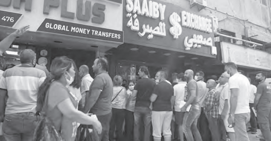
طوابير المواطنين امام محل للصيرفة

اول دخولها شمعة على طولها: إذ مع صعود الرئيس نجيب ميقاتي الى القصر الجمهوري بدأ سعر الدولار يتراجع حيث شوهد الكثير من المواطنين يقفون في صفوف امام محلات الصيرفة للتخلص من دولاراتهم مخافة ان يستمر التراجع بصورة دراماتيكية ولعل مصدر الخوف يعود الى ان الاتفاق تم بعد أكثر من سنة على استقالة حكومة حسان دياب. وإذا كان من المبرك الحديث عن مصير الدولار وهـل يتراجع الى ما دون العشرة الالاف ليرة فان ذلك مرتبط بالحكومة والمسار الذي ستتسلكه والمفاوضات مع صندوق النقد الدولي وتطبيق الإصلاحات التي باتت معروفة للقاصي والداني سجل سعر صرف الدولار انخفاضاً مستمرا منذ الصباح في السوق السوداء توازياً مع الاجواء الإيجابية التي تواجت مع تشكيل الحكومة، وهو سجل حتى الآن بين ١٦ و١٧ الف ليرة ووصل في بعض الاحيان وخصوصا مع تشكيلها الى ١٤٥٠٠ ليرة للدولار الواحد