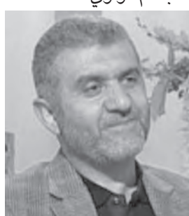
- مصطفى بيرم