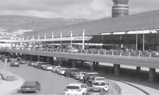
مطار بيروت الدولي

فقد بلغ عدد الوافدين الى لبنان منذ مطلع العام وحتى نهاية شهر آب الفائت مليوناً و٢٩٨ ألفاً و٢٧٤ رابكاً بزيادة ٧٩ في المئة كما ارتفع عدد المغادرين نحو ٦٢ في المئة وبلغ مليوناً و٢٣٦ ألفاً و٨٦٤ رابكاً. وازداد عدد ركاب الترانزيت بنسبة ٢٢٢,٢٧ بالمئة وبلغ ١٠٧٢٩ رابكاً مقابل ٢٢٢١ رابكاً في الأشهر الثمانية الأولى من العام ٢٠٢٠.