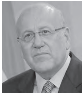
- محمد نجيب عزمي ميقاتي