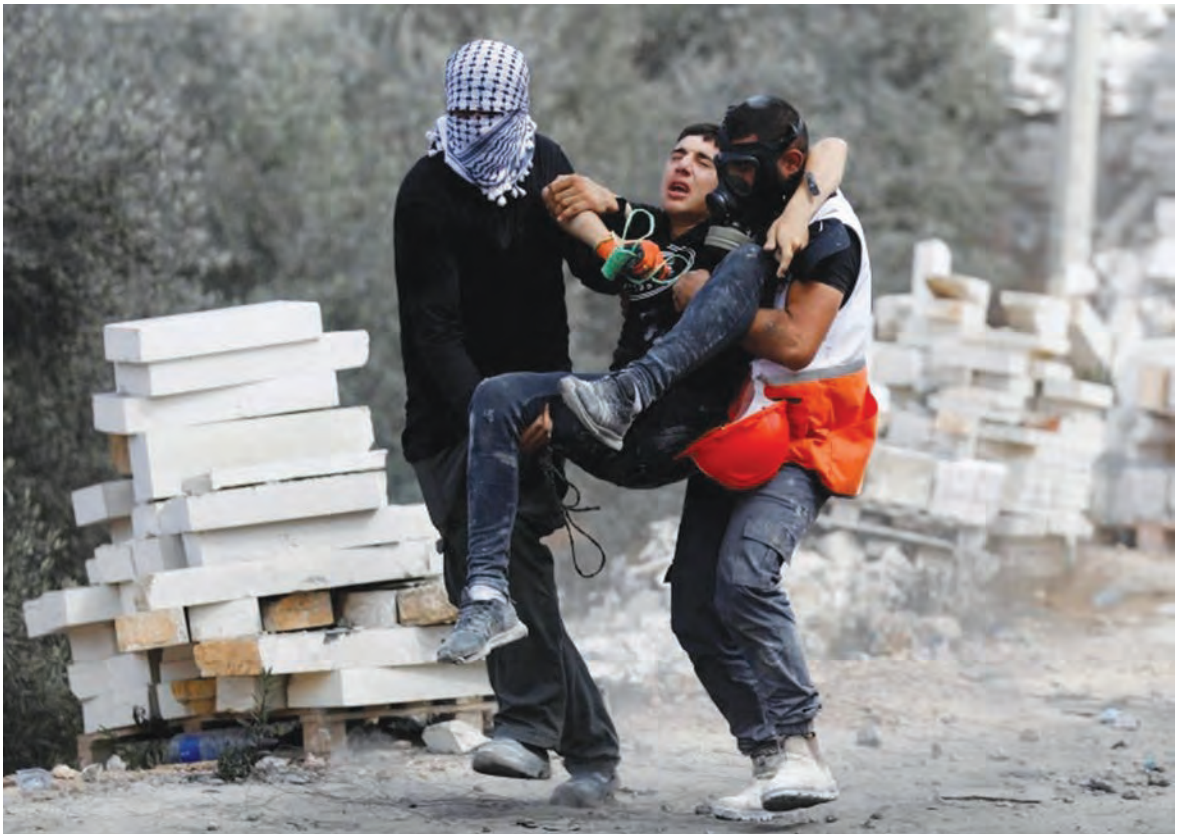
نقل شاب أصيب خلال المواجهات في بلدة بيتا

في سوريا، مبدياً في الوقت نفسه حرصها على ضمان أمن العسكريين الروس في هذا البلد.