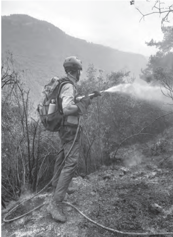
حريق ظهر نصار

يسيطر طقس صيفي حار ورطب على الحوض الشرقي للمتوسط حيث تتخطى درجات الحرارة معدلاتها الموسمية وتبلغ ذروتها يوم الاثنين، مع نسبة رطوبة مرتفعة تؤدي الى زيادة الشعور بالحر حتى يوم الأربعاء حيث يتحول الى معتدل نسبيا.