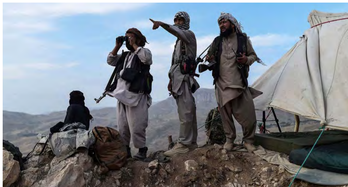
عناصر من طالبان تسيطر على مناطق استراتيجية في أفغانستان

وفي هذا المجال، أعلنت المتحدثة باسم وزارة الخارجية الروسية مارينا زاروفا أن اتصالات موسكو مع حركة «طالبان» تعني تحويل قرار مجلس الأمن الدولي بشأن الحوار الأفغاني الأفغاني إلى واقع.