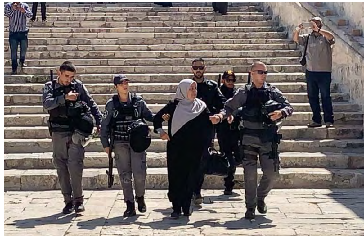
شرطة الاحتلال تعتقل امرأة حاولت منع المستوطنين من دخول الأقصى

اقتحم مئات المستوطنين، صباح امس، باحات المسجد الأقصى، بمناسبة ما يسمى ذكرى «خراب الهيكل» بحماية من قوات الاحتلال، التي اعتدت على المصلين داخل المصلى القبلي، ويأتي ذلك بعد ساعات من مسيرة للمستوطنين حول أسوار القدس القديمة والاحتشاد قبالة باب الأسباط. وقد اكد الاعلام الإسرائيلي ان رئيس حكومة الاحتلال نفتالي بينت اصدر تعليماته للسماح لليهود بمواصلة اقتحام الأقصى بكل منظم.