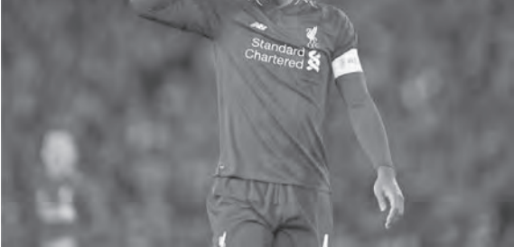
فيرجيل فان دايك

نفى فيرجيل فان دايك، مدافع ليفربول، تورطه مع بعض لاعبي الطواحين، في شتن حملة تمرذ ضد عودة المدرب لويس فان غال إلى المنتخب الهولندي.