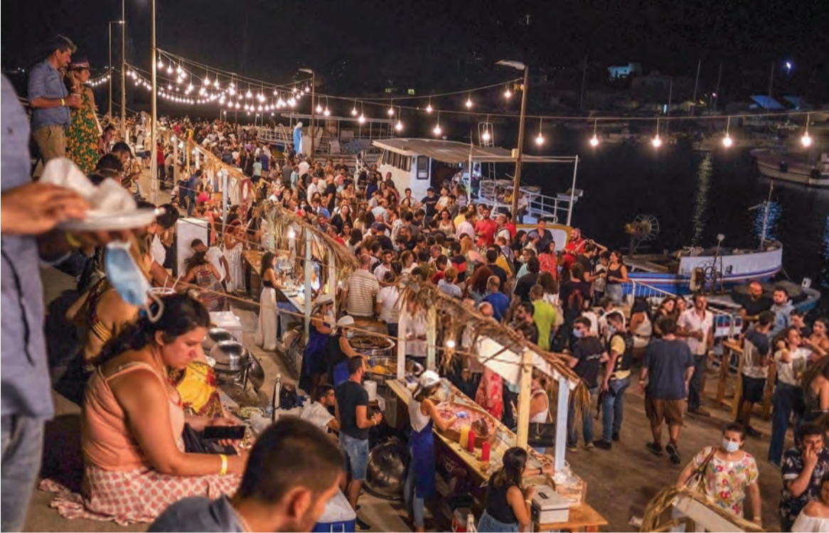
مشهد من مهرجانات البترون امس.. وكان لبنان لم يدخل الموجة الرابعة من «كورونا»

لديه من ناحية، ومن ناحية أخرى بسبب التهريب والإحتكار الذي يتفطن التجار في ممارسته، من صغيرهم إلى كبيرهم، كل على هواه، وبحسب مقدرته ومستواه. وبالتالي يتحمل المواطن اللبناني نتيجة هذا الشذوذ في ظل إهمال السلطات (تتمتع المانشيت ص ١٢)