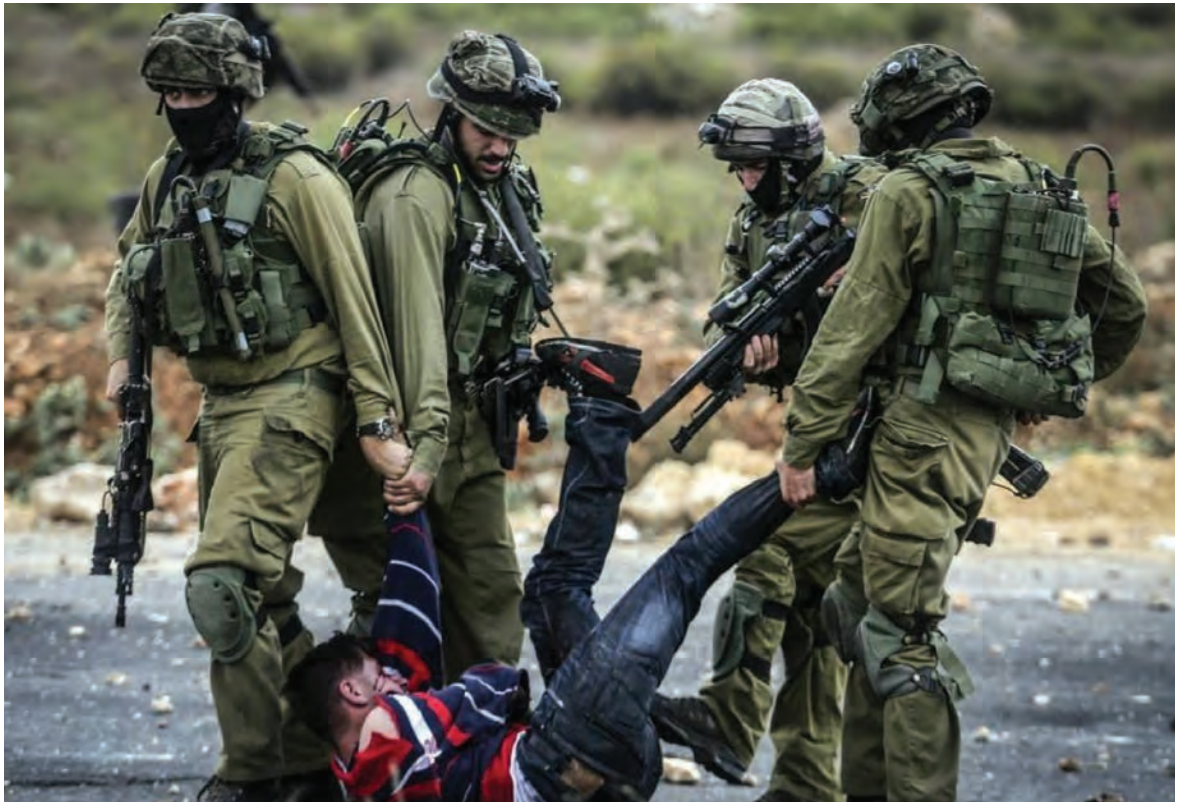
وحشية العدو الاسرائيلي

هذه السياسات تقوض النسيج الاجتماعي، وتمنع أي تقدم نحو مستقبل ديموقراطي عادل وسلمي». ودعت الرسالة الإدارة الأميركية الحالية لـ «لممارسة ضغوط دبلوماسية منسقة للمساعدة في إنهاء التمييز والقمع المنظمين، ولضمان محاسبة السلطات الإسرائيلية التي تنتهك حقوق الفلسطينيين».