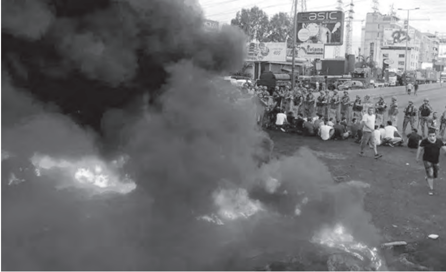
عيسى بو عيسى