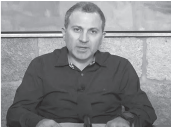
باسيل خلال مؤتمره الصحافي

حرام أن يحرم المنتشرون من زيارة لبنان وختم باسيل «حرام أن يحرم المنتشرون من زيارة لبنان، فبفضلهم ما زال لبنان صامدا، ولولاهم لكانت ازمته اصعب. كانوا يحولون ٧ مليار دولار وما زالوا يحولون هذا المبلغ رغم عدم تقهّم بالنظام المصرفي. وال ٧ مليار دولار اليوم قيمتها أكثر من مرتين أو ثلاثة أو أربعة مرات من قبل. أيها المنتشرون، انتم روحنا وأملنا، وانتم جزء من الشعب اللبناني المناضل والصامد. لكم تسهل كل التضحيات ولا نقبل بأن يحرمكم أحد من صوتكم وحكمكم. شعبنا المنتشر لا يتكافأ، ويجب أن نأخذ لبنان إليه بصندوق الانتخاب، بمنجاته، وبطاقاته لأنه هو نشر لبنان في العالم وحمل رسالته وهو ضمانة مع شعبنا القيم للحفاظ على لبنان الوطن الذي نريده. كنا نحكي عن لبنان ال ١٠٥٢ كلم، مع الانتشار صارت حدودنا العالم، كما كان شعرا في وزارة الخارجية. يا أهلنا، نحن ننتظركم في الصيف وفي كل الأوقات ونفتح كل قلوبنا، وبإن شاء الله لبنان سيرجع ويكون على قدر آمالك».