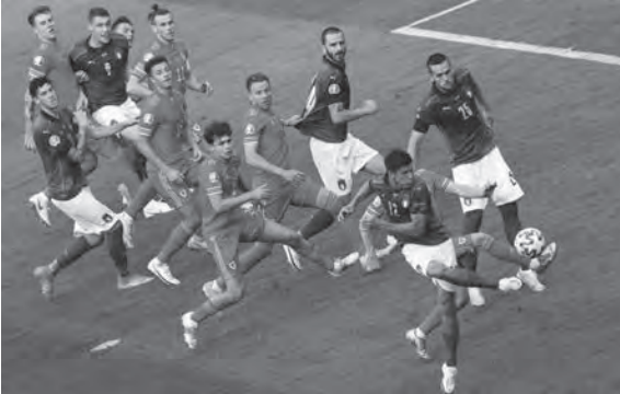
من لقاء إيطاليا وويلز

حقق منتخب إيطاليا فوزاً صعباً على نظيره ويلز، بهدف دون مقابل، في المباراة التي جمعتهما أمس الأحد، على ملعب الأولمبيكو، في إطار لقاءات الجولة الثالثة من دور المجموعات ببطولة يورو ٢٠٢٠.