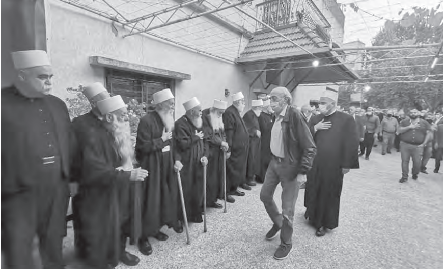
جنبلاط يحيي المشايخ

أفق لأنهم يرفضون التسوية. ولا أعلم كيف هناك مواطن غير مسؤول هكذا ليرفض التسوية. مر بنا بظروف أصعب، فبعد أن قتلوا كمال جنبلاط ماذا فعلت حينها؟ ذهبت إلى الشام، وصافحت حافظ الأسد من أجل عروبة لبنان، ومن أجل جماعتي والحركة الوطنية اللبنانية، والخطر على لبنان. شو هالقصة يعني؟ وبقيت ٢٩ عاما حليفا لسوريا. ويا ليت سوري لا زالت كما كانت، لذلك التسوية ليست خطأ، مضيفاً «اليوم أكتب تغريدة عن التسوية. أرى الشتام من جماعة الثورة وليس بالجمان، ولكنها ليست بمشكلة. قل كلمتك وامسح. قالها في الماضي كامل مروة الصحافي الكبير، ولا يوجد هناك أمر مستحيل، فالملطوب تشكيل حكومة توقف الانهيار لكي تستطيع مواجهة البنك الدولي والمؤسسات الدولية من أجل أن نأخذ قرضا مشروطة وليست بالجمان، ولكن ليس أمامنا سوى هذا الحل. منذ الانفجار وزيارة الرئيس ايمانويل ماكرون ونحن نقف مكاننا. نرفض وزيراً بالزائد أو بالناقص. هذا مضحك. كل هذا لأنه لا توجد دولة، وما حدا فاضي للبنان، لأن مشاكل العالم أكبر بكثير من لبنان. ماكرون فقط قام بمجهود شرط أن نساعد أنفسنا.»