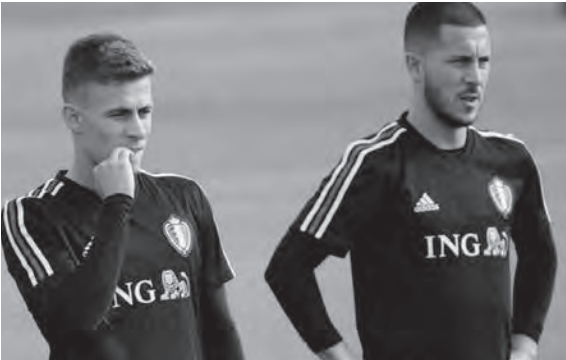
الأخوان إيدين وثورغان هازارد

أعلن المنتخب البلجيكي، أمس الأحد، أن لاعب الوسط ثورغان هازارد سيغيب عن المباراة الثالثة والأخيرة للفريق في دور المجموعات في بطولة أوروبا ٢٠٢٠ أمام فنلندا في سان بطرسبرج الروسية، اليوم الإثنين. وهز هازارد لاعب بوروسيا دورتموند الألماني الشباك في فوز بلجيكا على النمساك (٢-١)،