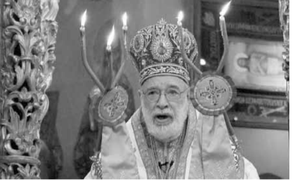
عودة يلقي عظته

ترأس البطريرك الماروني الكاردينال مار بشارة بطرس الراعي، قداس الأحد في كنيسة السيدة في الصرح البطريكي في بركي، رفع خلاله الصلاة لراحة نفس البطريرك الكاردينال مار نصرالله بطرس صفير، في الذكرى الثانية لرحيله، وألقى عظة قال فيها: «تحقق الزراعة الأمن الغذائي من خلال تأمين حاجة لبنان من الغذاء والمواد الأولية للمصانع الغذائية والحد من استيراد الحاجات الغذائية الذي يتجاوز 70٪، ومن خلال زيادة الصادرات الزراعية من أجل إدخال العملة الصعبة إلى لبنان. إننا في المناسبة نطالب الدولة بدعم القطاع الزراعي لكونه قطاعا أساسيا في الاقتصاد الوطني، وإعادة النظر بالاتفاقات بهدف فتح الاسواق امام الانتاج الزراعي اللبناني، وتحسين سبل عيش المزارعين والمنتجين، وزيادة الطاقة الانتاجية وتعزيز قدرتها التنافسية بالشكل العلمي. ونناشد اللبنانيين المنتشرين ومؤسساتهم الاعتناء بتسويق المنتجات الزراعية اللبنانية والموتة والطبخ اللبناني، ودعم القطاع الزراعي، من أجل إنهاضه وتأمين شبة الأمن الغذائي وتطوير نظامه ليكون أكثر صمودا وشمولية وتنافسيا واستدامة». وتابع «كم نتمنى لو ان المسؤولين عدنا يدركون، عظمة مسؤولياتهم التي تشكل فرصة فريدة لتمجيد الله بتأمين الخير العام، وباتاحة الفرص لكل مواطن كي يحقق ذاته، وبالتعبير في الأفعال عن محبتهم للمواطنين. ولكننا نشهد بكل