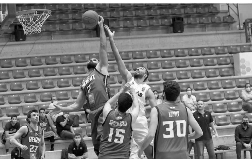
صراع طائر في لقاء أطلس وبيروت

واصل فريق أطلس الفوز، وأسقط بيروت أحد أبرز المرشحين لإحراز اللقب بفارق ٢٠ نقطة (٧٦-٥٦)، الربيع الأول (٢٣-١٩)، والثاني (٣٨-٢٩)، والثالث (٦٢-٣٨)، في المباراة التي جرت أمس الأحد على ملعب مجمع نهاد نوفل في ذوق مكامل، ضمن المرحلة السادسة من بطولة لبنان «أكس اكس آل انرجي» في كرة السلة.