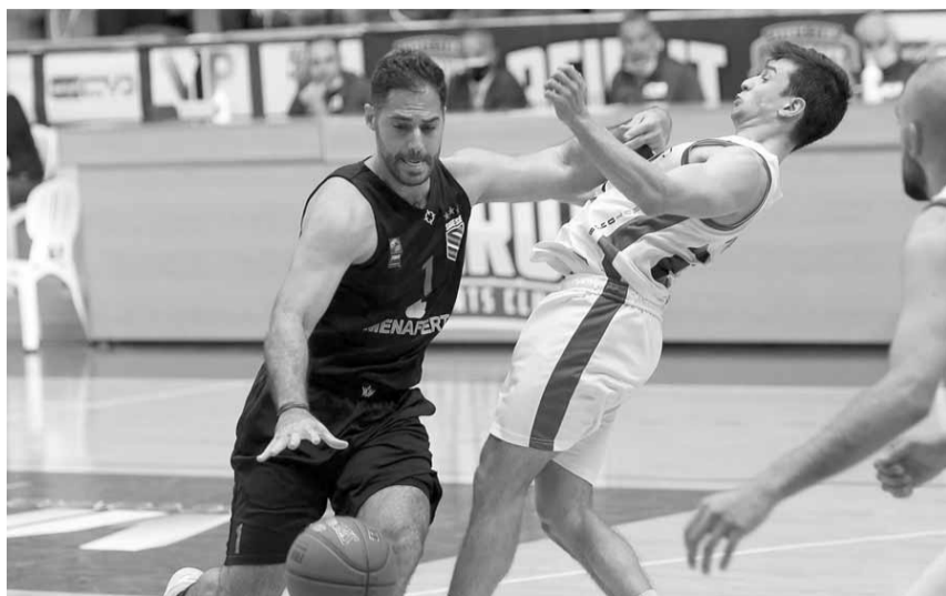
من مباراة نادي بيروت والحكمة الجمعة الفائت

تتواصل بطولة لبنان «أكس اكس آل انرجي» بكرة السلة للرجال ودخلت البطولة مرحلتها السادسة الأحد في ظل اتخاذ اتحاد اللعبة كافة الإجراءات الوقائية من وباء «كورونا» عبر فحوصات الفحص السريع (رابيد تست) لجميع اللاعبين والملاعب. فالبطولة الحالية تقام، كما هو معروف، من دون لاعبين اجانب إذ ستقتصر على اللاعبين اللبنانيين. وفي قزراعة دقيقة للمراحل الخمس