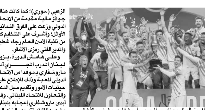
الفريق البطل مع المدرب الجري ماروشفاري وشطح والأشقر

نظم الاتحاد اللبناني لرياضة «تيكبول» يوم السبت، البطولة الدولية على ملاعبه في الكورة تحت اسم «Tripoli challenger cup» وهي باكورة نشاطاته هذا العام بعد انضمامه حديثاً إلى عائلة اللجنة الأولمبية اللبنانية. شارك في البطولة ٢٣ فريقاً بينهم فريق غوبوك الروماني إضافة إلى لاعبين سوريين وفلسطينيين مقيمين في لبنان ولاعب أسترالي من أصل لبناني، وقد تم سحب القرعة «أولاًين» تحت إشراف أعضاء من الاتحاد الدولي للعبة في الحجر «FITEQ».