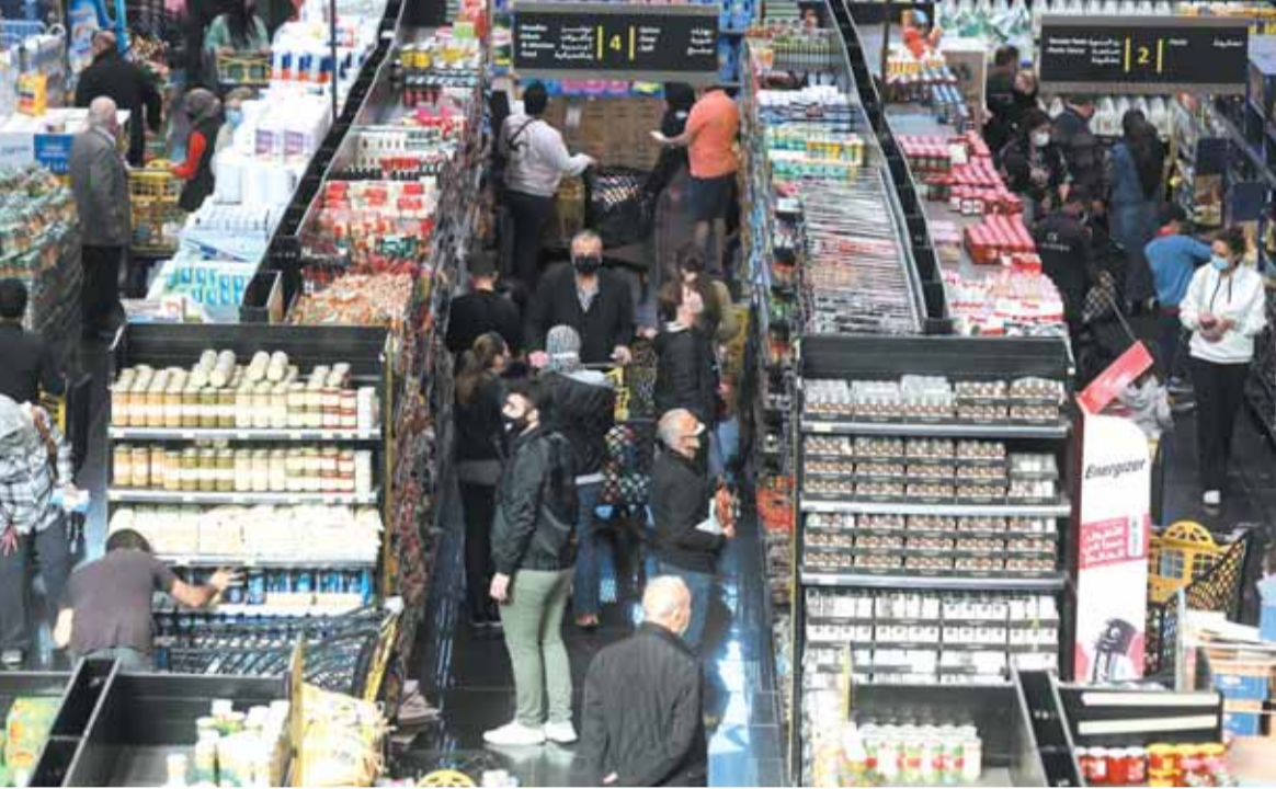
توافقت للمواطنين على المواد الغذائية