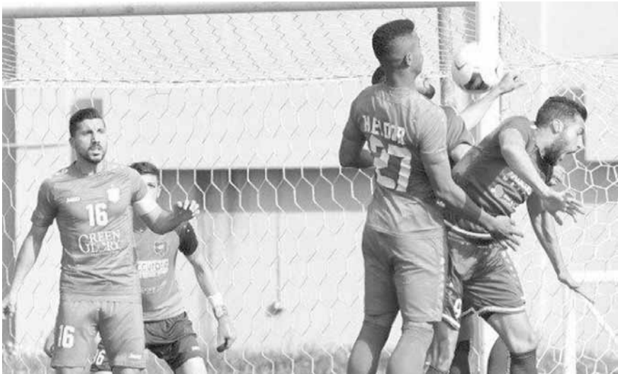
من مباراة الأنصار وشباب الساحل