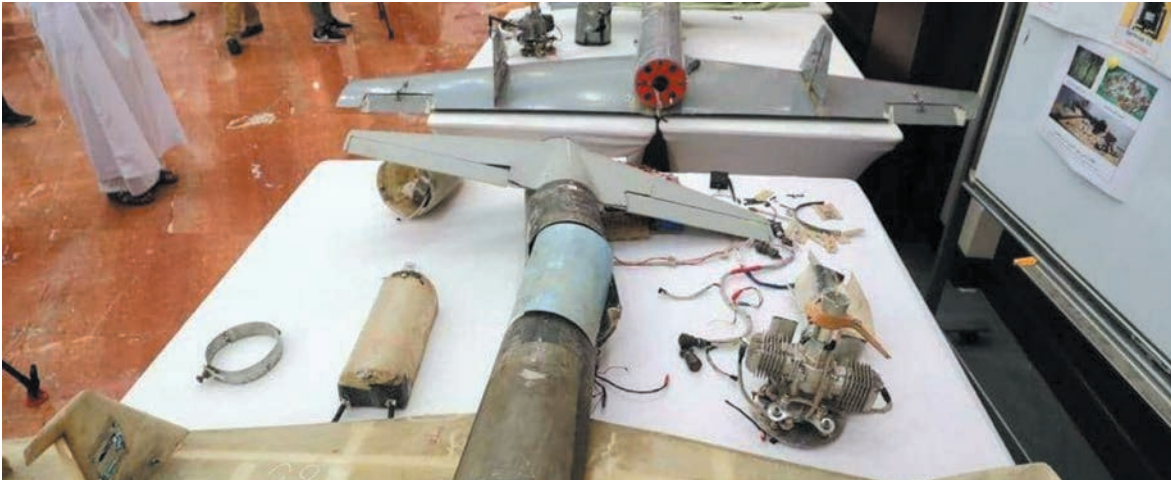
مُسيّرات استهدفت أعمق السعودي

وشدّد سريع على أن العمليات مستمرة ومتصاعدة طالما استمرّ العدوان والحصار على بلدنا. ويأتي ذلك بعد يوم من إعلان القوات المسلحة اليمنية التي استهدفت مواقع في جازان وخميس مشيط، في وقت ذكرت وسائل إعلام سعودية أن التحالف اعترض ودمر صاروخا باليستيا و٤ طائرات مسيرة مفخخة. وقال «التحالف» - الذي تقوده السعودية - اول من أمس إن محاولات الحوثيين التي وصفها بالدعائية ممنهجة ومتعمدة لاستهداف المدنيين، مضيفا أنه «يتخذ الإجراءات العملياتية اللازمة لحماية المدنيين، بما يتوافق مع القانون الدولي الإنساني».