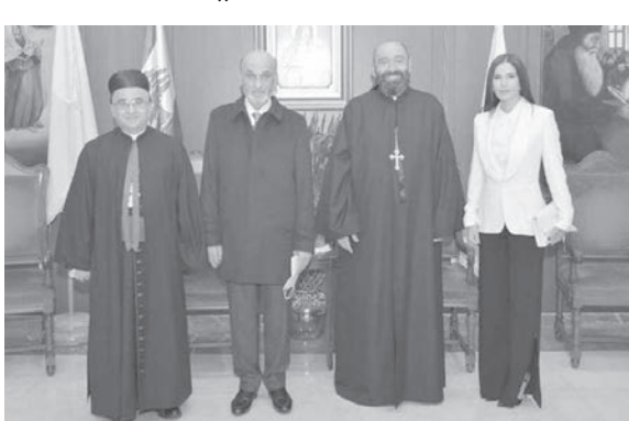
جعجع يزور الاباتي نجيم

وجودنا. إننا مسرورون جدا بهذه المناسبة ونتطلع الى مواصلة المسيرة معا، لقد مرت علينا ظروف صعبة على مدى التاريخ، ولا بد أن نصل الى النقطة التي نستبشر بها خيرا كتمن للنضال في خدمة المجتمع.»