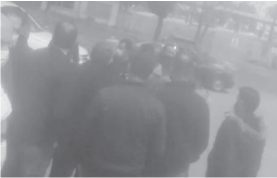
الاحتجاج عند مثلث الزهراني

مما أدى إلى اقفال المسلخ أمس، وحرمان منطقة صيدا للحم المدعومة.