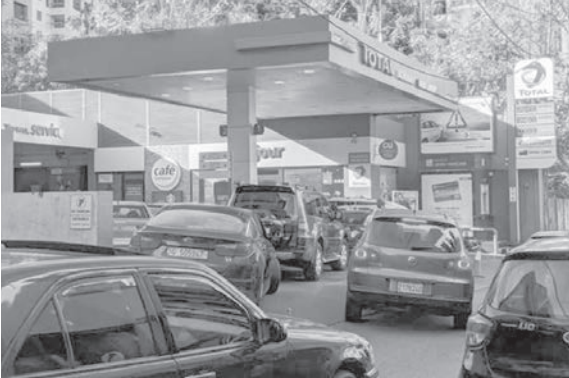
الازدحام على المحطات

من هنا يفترض أن نسأل السلطة السياسية حاكمة البلد: إلى أين نحن ذاهبون؟ ما هو السيناريو المعتمد؟ ما هي خطتها لإنقاذ البلاد على رغم أن الحل هو في إدخال الدولار إلى البلاد الأمر الذي يشترط تشكيل حكومة والقيام بالإصلاحات المطلوبة سريعا، وإلا لن يكون هناك أي حل على الإطلاق» بحسب البراكس.