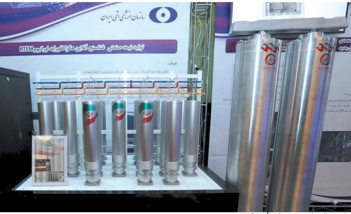
تخصيب اليورانيوم في نطنز مستمر

أعلن رئيس منظمة الطاقة الذرية الإيرانية علي أكبر صالحی أن نظام الكهرباء الاحتياطية في منشأة نطنز النووية تمت اعادة تشغيله فيما يتواصل العمل على اصلاح بقية الاضرار الناتجة عن الاعتداء التخريبي الذي استهدف المنشأة يوم الاحد. ولدى افتتاحه أمس المركز الوطني لتقنية الكوانتم اوضح صالحی ان ما حدث في منشأة نطنز هو عمل تخريبي قطعاً، مشيراً الى ان المنظومات الأمنية توصلت الى خيوط الجريمة وستابع التحقيقات وتعلن النتائج. وأكد صالحی أن تخصيب اليورانيوم في منشأة نطنز لم يتوقف وهو ماضٍ الى الامام بقوة.