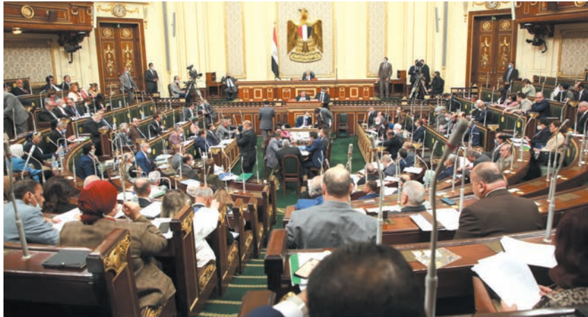
خلال اجتماع رئيس الوزراء الاردني مع النواب

على طريق الديار الشعب متأكد ان وزن كل مسؤول منذ بداية الازمة وحتى الآن يزداد كل يوم بنسبة معينة، والدليل على ذلك، انتفاخ وجوه المسؤولين، وكأنهم في ريعان شبابهم. والشعب متأكد انه فقد نصف وزنه الجسدي منذ بدء الازمة بسبب اهمّ والياس والقلق، وعدم القدرة على شراء حاجاته المعيشية من طعام وأدوية... فيما بهرجه موائد المسؤولين المسلاة بالاكل الفاخر وضحتهم وتكاتهم، تشعرك باشمزاز، وكان لا ازمة في لبنان. الفوضى آتية اذا استمر الوضع على هذا المنوال... السرقات، القتل والعنف... كل ذلك آت، مع اننا نسمع يوماً عن سرقات وقتل وعنف، الا أن الوتيرة ستزداد اذا استمرت الحالة تتدهور يوماً بعد يوم. الخط الاحمر هو عندما يصل نصف الشعب اللبناني الى حالة لم يعد باستطاعته تأمين لقمة عيشه... ربما بعد رمضان المبارك، هذا الخط الاحمر سيبدأ بارسال شراراته الحارقة... وعندما لن يعود ينفع الندم. «الديار»