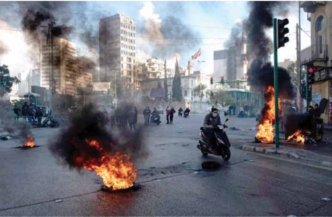
مواطنون يقطعون الطرقات احتجاجاً على انقطاع الكهرباء في بيروت أمس

بالنظرية المالية التي تنص على أن الدولة هي اللاعب الأكثر ملاءة، قامت بإقراضها بشكل مفرط وغير مدروس! فيحسب أرقام كانون الأول ٢٠١٧، أقرضت المصارف الدولة اللبنانية ١٤,١٨ مليار دولار أميركي على شكل سندات يوروبوندز. في المقابل أقرضت هذه المصارف القطاع الخاص (بالدولار الأميركي) ما يقارب الـ ٤١ مليار دولار أميركي من أصل ١١٥,٩ مليار دولار أميركي وداغ القطاع الخاص بالعملة الصعبة وإذا ما حسبنا أيضاً الاحتياطي الإلزامي والبالغ ١٧,٣٩ مليار دولار أميركي، فهذا يعني أن هناك ٤٣,٥ مليار دولار أميركي تم توزيعها خارج الماكينة الاقتصادية.