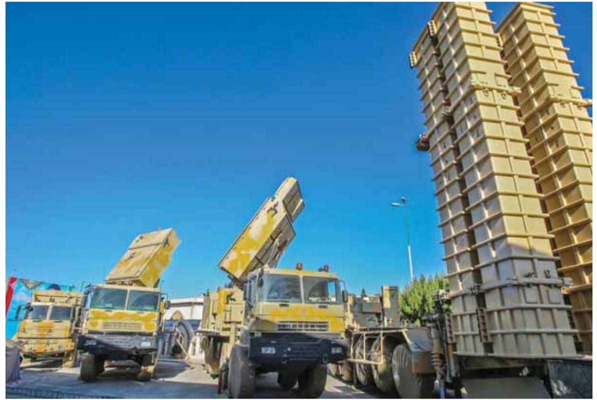
سلاح ارض جو إيراني