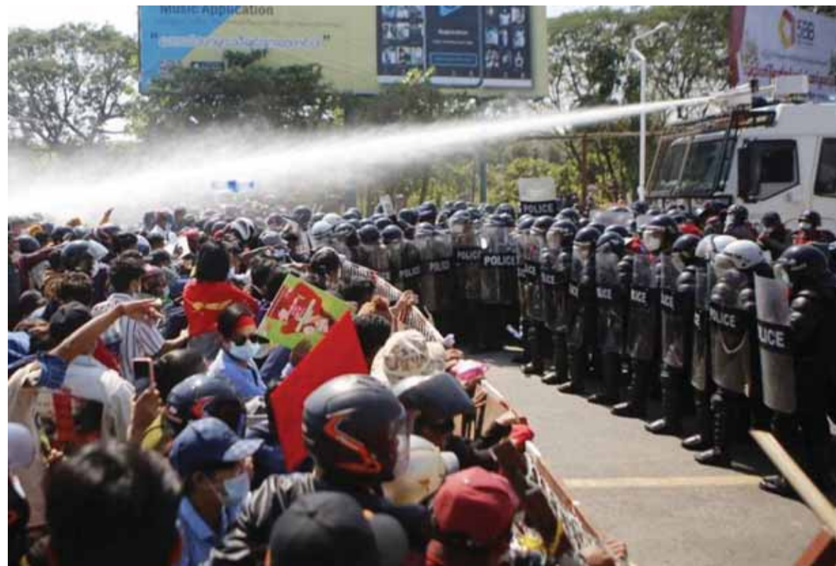
مواجهات بين القوى الامنية والمتظاهرين