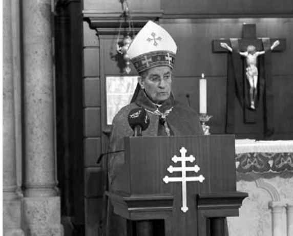
الراعي يلقي عظته

بنفسه أسباب هذا الإنهيار وطرق معالجته، بالإستناد إلى ثلاثة: وثيقة الوفاق الوطني والدستور وميثاق العيش معاً، استعداداً لهذا المؤتمر. وقد شارك مئات الكلوف في هذا اللقاء الداعم بواسطة محطات التلفزيون والإذاعات والفيديوسكرو ووسائل الإتصال الإجتماعي، في لبنان والبلدان العربية وبلدان الإنترنشنال. فإننا نحييهم جميعاً».