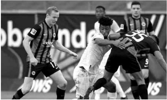
من مباراة أينتراخت فرانكفورت وبايرن ميونيخ

ورفع سانت إيتيان رصيده إلى ٣٠ نقطة في المركز ١٤ بفارق الأهداف فقط خلف ستاد ريمس صاحب المركز ١٣.