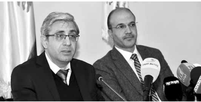
حسن والمجذوب خلال الاجتماع

أعلن وزير الصحة العامة في حكومة تصريف الأعمال الدكتور حمد حسن، أن «حملة التلقيح أثبتت بعد اسبوع على انطلاقتها انها تنفذ في شكل جيد وممنهج، رغم بعض الخروقات التي تعالج سرعيا في بعض المراكز»، مضيفا «ان نسبة النجاح على منصة التسجيل الوطني ترتقي بسرعة وتعديل وفق الحاجة كتقريب مواعيد الأشخاص الذي تلي مواعيدهم مباشرة اولئك الذين قد يتغيبون عن الحضور للتلقيح، ما سيضمن عدم خسارة أي جرعة لقاح».