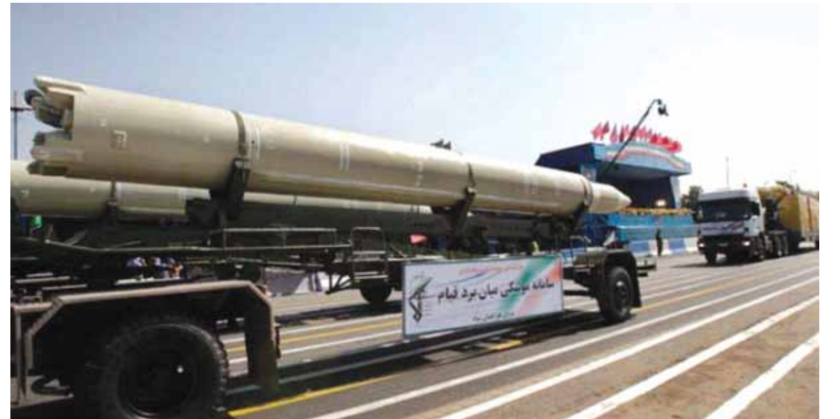
اسلحة باليستية إيرانية