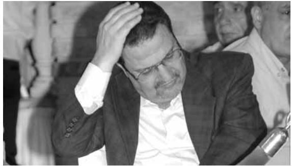
الراحل علي حميدي صقر

نعى رئيس الاتحاد اللبناني لكرة القدم المهندس هاشم حيدر، الإعلامي الرياضي الكبير علي حميدي صقر الذي وافته المنية يوم الأربعاء المنصرم ببيان تعزية جاء فيه: