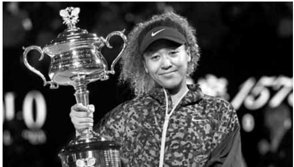
أوساكا مع كأس بطولة أستراليا

ميدفيدف اللاعب الذي لا يمتني مواجهته. ولم يخف ديوكوفيتش ذلك حين قال إن ميدفيدف «الرجل الذي ينبغي التغلب عليه». وتحول اللاعب الروسي إلى ملكية منذ تشرين الثاني، وتوج باللقب باريس للأساتذة والبطولة الختامية للموسم وكأس اتحاد اللاعبين المحترفين للفوز خلال سلسلة من ٢٠ فوزاً تتضمّن ١٢ انتصاراً متتالياً على لاعبين من قائمة العشرة الأوائل بالتصنيف العالمي. وكان ديوكوفيتش من ضحايا ميدفيدف في البطولة الختامية، لكن عندما يدخل اللاعب