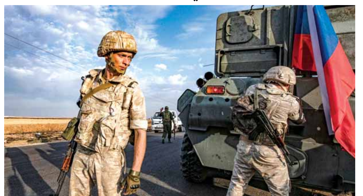
قوات روسية خلال المعارك

ومنذ إعلان القضاء على خلافته قبل نحو عامين وخسارته كافة مناطق سيطرته، اتفقا تنظيم الدولة إلى البداية الممتدة بين محافظتي حمص في الوسط ودير الزور شرقاً عند الحدود مع العراق، حيث يتحصن مقاتلوه في مناطق جبلية. ووفق المرصد منذ آذار ٢٠١٩ مقتل أكثر من ١٣٠٠ عنصر من قوات الحكومة السورية والمسلحين المواليين لها، فضلاً عن أكثر من ٧٥٠ عنصراً من الحركات المسلحة جراء الهجمات والمعارك في البداية.