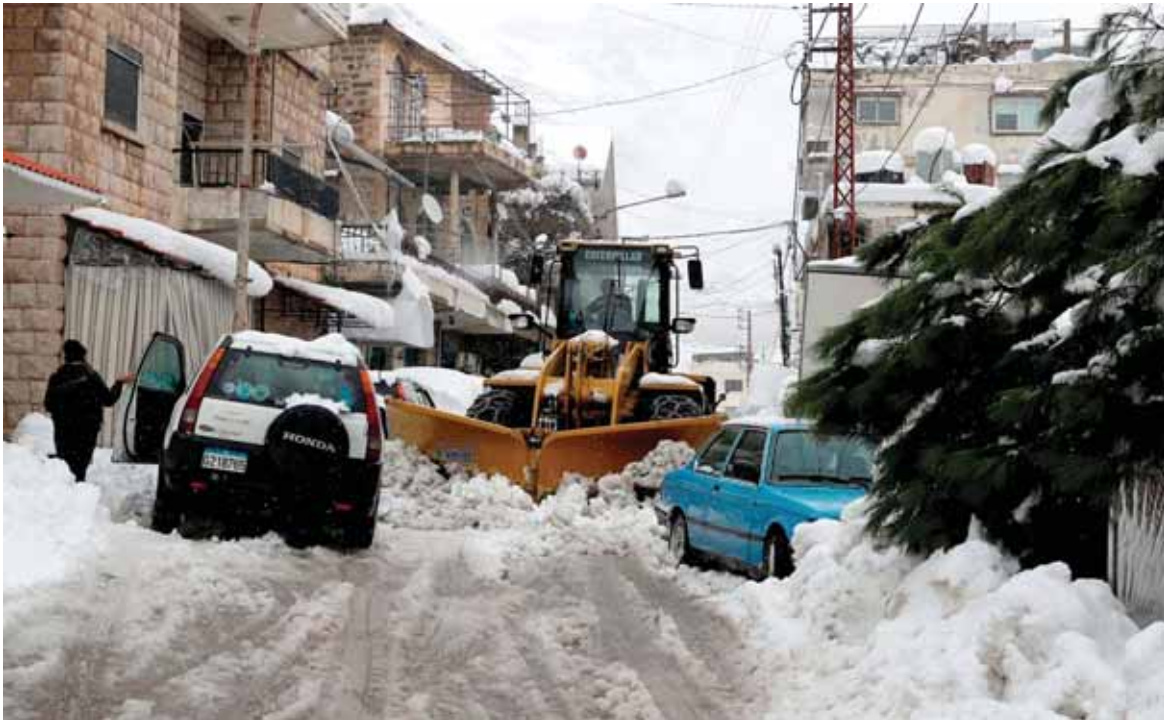
بدء فتح الطرقات بعد انحسار العاصفة الثلجية