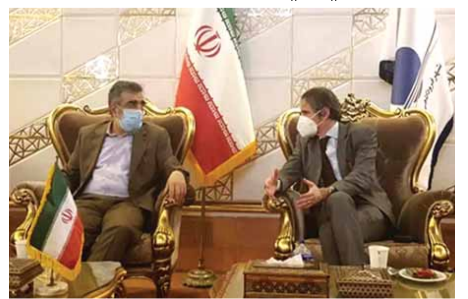
غروسي في طهران