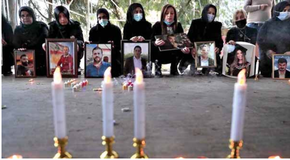
اهالي شهداء المرفأ

كان جلياً بعد عودة الرئيس المكلف سعد الحريري من جولته التي شملت الإمارات وباريس أن الأخير تسلم بزيارته الخارجية وحصل على دعمها لوجهة نظره والتشكيل الحكومية التي كان قد قدمها للرئيس عون سابقاً، ما جعله بعيد التأكيد على التشكيل الحكومية نفسها. من جهة أخرى، رغم كل ما يحكى عن أن بعيداً لا تسعى إلى الثلث المعطل، غير أن كل طروحات بعيداً تؤكد على أنها تسعى جاهدة للحصول عليه، تارة عبر المطالبة بعدم احتساب الوزير الأرمني من حصة رئيس الجمهورية حيث يريد عون أن يكون له ست وزراء إضافة إلى الوزير الأرمني ليصبح العدد ٧ وزراء في حكومة الـ ١٨، وتارة عبر المطالبة بتوسيع الحكومة إلى ٢٠ أو ٢٢ مقعداً لإدخال وزير من حصة النائب طلال ارسلان إلى الحكومة، وهذا ما أكد عليه لقاء خلده حيث بدت واضحة أصابع النائب جبران باسيل فيه، وبالتالي الحصول أيضاً على الثلث المعطل. أذاً، التشكيلية «تراوح مكانها نتيجة تذاكي فريق بعيداً للحصول على الثلث المعطل واستقواء فريق بيت الوسط بالخارج لفرض تشكيلته. وعلى هذا الصدام فشلت حتى الآن كل المحاولات الداخلية لتقريب وجهات النظر بين الفريقين، بدأ من مبادرة