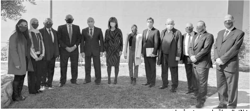
خلال الجولة على مصنع «أروان»

زار وزير الصناعة في حكومة تصريف الأعمال الدكتور عماد حب الله، والسفير الروسي في لبنان ألكسندر روداكوف، والمستشار رئيس الجمهورية النائب السابق أمل أبو زيد، اليوم، مصنع شركة «أروان» للصناعات الدوائية في بلدة جدرا على ساحل الشوف، في منطقة اقليم الخروب، وكان في استقبالهم رئيس مجلس