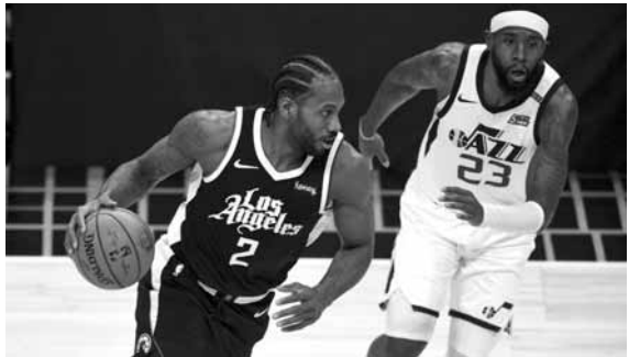
لينارد يتخطى أحد لاعبي يوتا جاز

وحقق المونتينيغري نيكولا فوتشيفيتش «تربيل دابل» مع ٣٠ نقطة، ١٦ متباعة و١٠ تمريرات حاسمة، ليقود أورلاندو ماجيك إلى الفوز على غولدن ستايت ووريوز ٢٤-١٢٠، فيما لم تكن النقاط الـ٢٩ من الموزع نجم ستيفن كوري كافية لتجنيد ووريوز الخسارة.