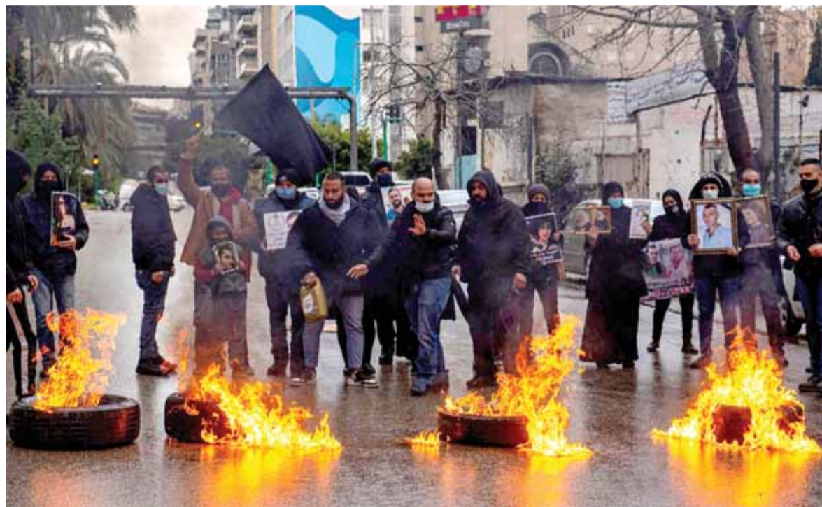
اهالي شهداء المرفأ يقطعون الطرقات احتجاجا على تنحية القاضي صوان

الحر» جبران باسيل ويشرك في كل المناسبات التي يدعو إليها».