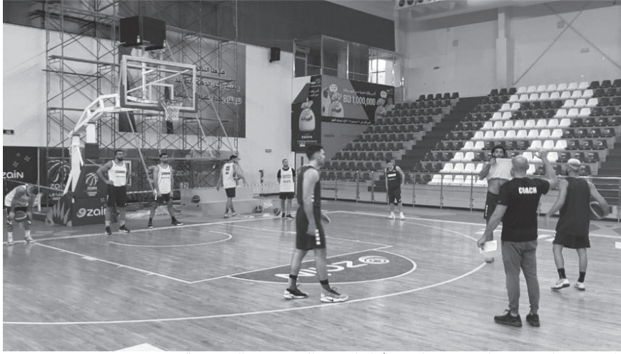
المدرّب مجاعص يعطي توجيهاته خلال احدى الحصص التدريبية

وأضاف أن ريال مدريد يعلم أن مبابي ينتظر التحرك لضمه، من أجل إعلان رفض تجديده عقده مع سان جيرمان الذي ينتهي في صيف ٢٠٢٢.