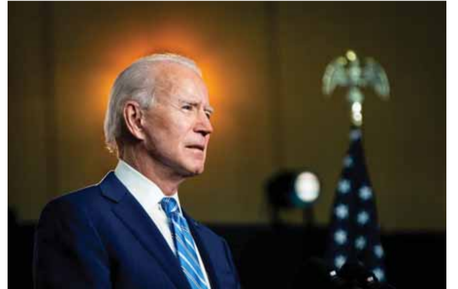
هل يصلح بايدن ما افسده ترامب

وقال المتحدث الرسمي باسم هيئة السياسة الخارجية في (التتمة ص ١٢)