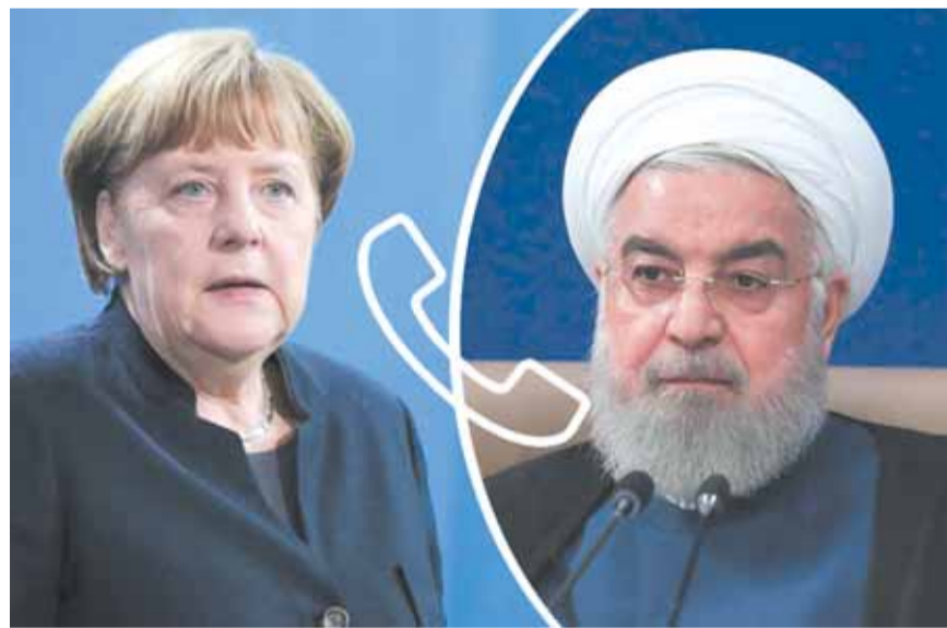
اتصال هاتفي بين روحاني وميركل

أجرى الرئيس الإيراني حسن روحاني محادثات هاتفية مع المستشارة الألمانية أنجيلا ميركل هي الأولى بينه وبين أحد قادة الترويج الأوروبية منذ استلام الرئيس الأميركي جو بايدن السلطة.