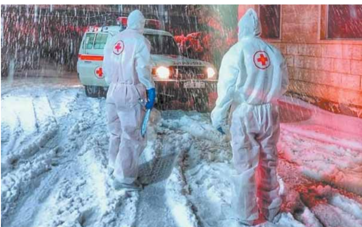
«ما وراء الواجب»، خلال العاصفة الثلجية