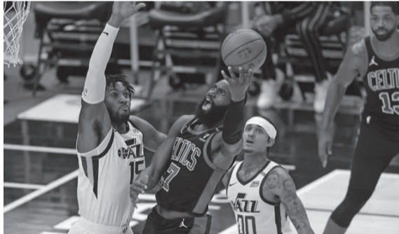
من مباراة يوتا جاز وبوسطن سلتيكس

وجاء بفارق كبير على حساب ضيفه بوسطن سلتيكس ١٢٢-١٠٨ بفضل الأداء الجماعي، إذ تجاوز خمسة من لاعبيه حاجز العشر نقاط. وكان دونوفان ميتشل الأفضل بتسجيله ٣٦ نقطة مع ٩ تمريرات حاسمة، فيما أضاف جو إنجليس ٢٤ مع ٦ تمريرت حاسمة والفرنسي رودي غوبير ١٨ مع ١٢ مائة.