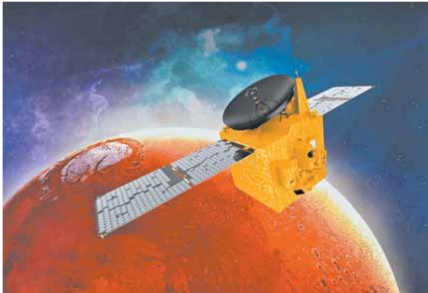
«مسبار الأمل» الإماراتي يصل المريخ

المسبار وخلال الدقائق العمياء هذه يعالج «مسبار الأمل»، كافة التحديات بطريقة ذاتية، إذ يكون الاتصال بمركز التحكم في المحطة الأرضية بالخوانيج في دبي متأخراً.