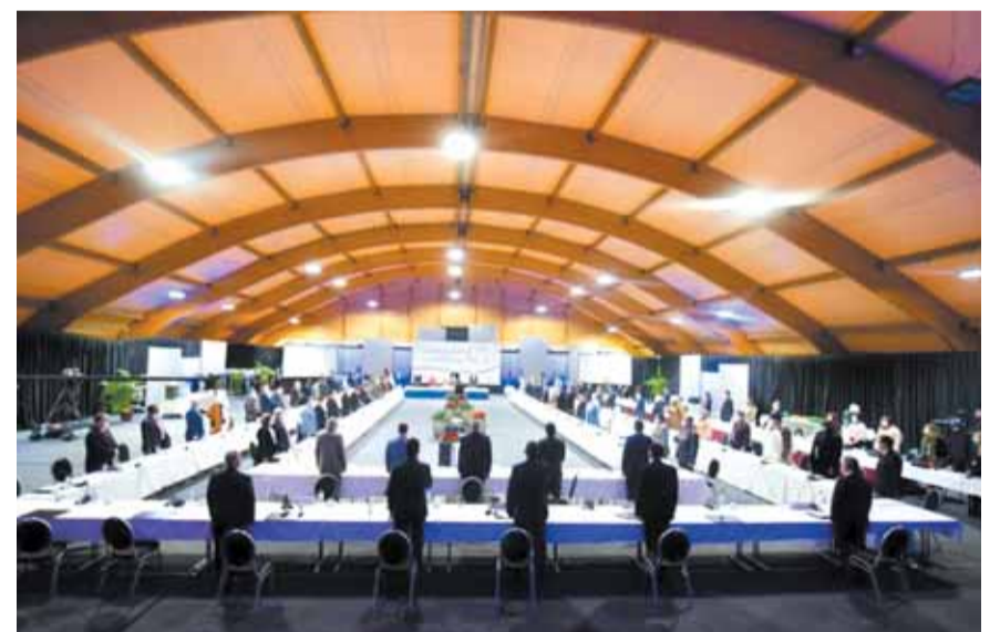
سلطة تنفيذية مؤقتة في ليبيا