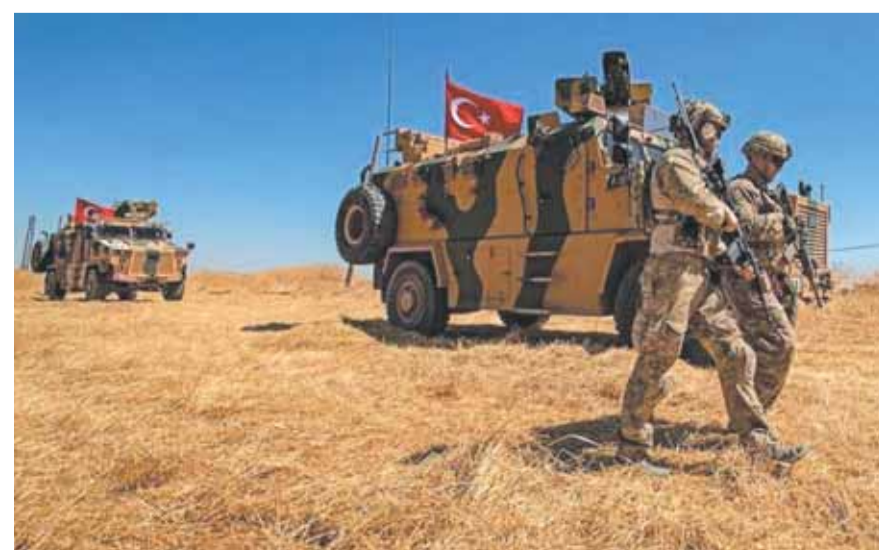
عملية عسكرية شمال العراق

أعلنت تركيا أمس الأربعاء عن إطلاق عملية عسكرية جديدة ضد قواعد «حزب العمال الكردستاني» في شمال العراق.