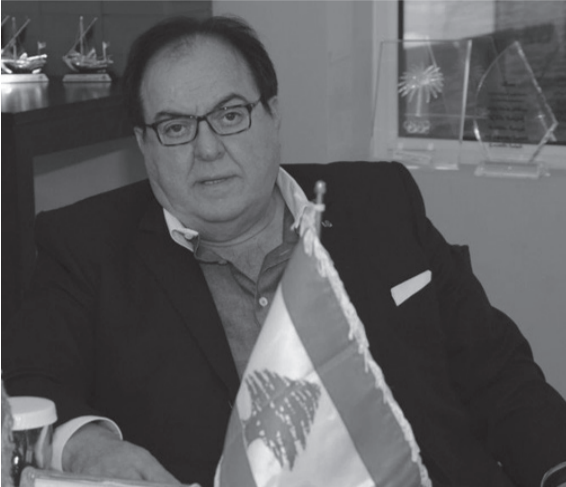
الأميرال الراحل ادمون شاغوري

على صعيد آخر، قال تقرير صحفي إسباني، أمس الأربعاء، إن سيرجيو راموس، قائد ريال مدريد، أبلغ الإدارة بقراره النهائي حول مستقبله. وينتهي عقد راموس مع ريال مدريد بنهاية هذا الموسم، حيث قدم له فلورنتينو بيريز، رئيس النادي، عرضاً للتجديد لمدة موسمين مع تخفيض راتبه بنسبة ١٠٪، نظراً للأزمة الاقتصادية التي يمر بها النادي، وهو ما رفضه اللاعب. وبحسب صحيفة «موندو ديپورتيفو» الإسبانية، فإن راموس لن يعدل عن رأيه، وسيتمسك بموقفه الحالي برفض عرض الريال، بل إن الأمر قد وصل إلى أنه أبلغ نادية بأن مستقبله في نادٍ أوروبي يمكنه