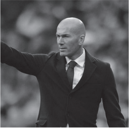
تلبية مطالبه المالية.