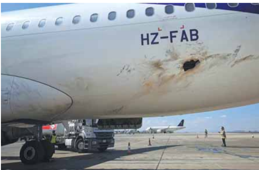
الاضرار بإحدى الطائرات جراء الهجوم

وأضاف أن الهجوم نُفذ بـ ٤ طائرات مسيرة من نوع «صامد-٣»، و«قاصف ٢ كيه». واتهم المتحدث السعودية بتجاهل «كل التحذيرات السابقة والمتكررة» من استخدامها المطارات المدنية لأغراض عسكرية، وقال إن هذا الهجوم يأتي رداً على استمرار القصف الجوي واستمرار الحصار.