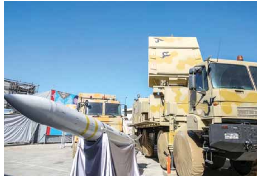
الصواريخ الإيرانية خارج التفاوض

أكد عباس عراقجي، مساعد وزير الخارجية الإيراني، أنه لن يكون هناك اتفاق نووي بلاس أو اتفاق نووي جديد أو أي مفاوضات على اتفاق نووي، منوها بأن مطالب إيران واقعية وهي رفع العقوبات.