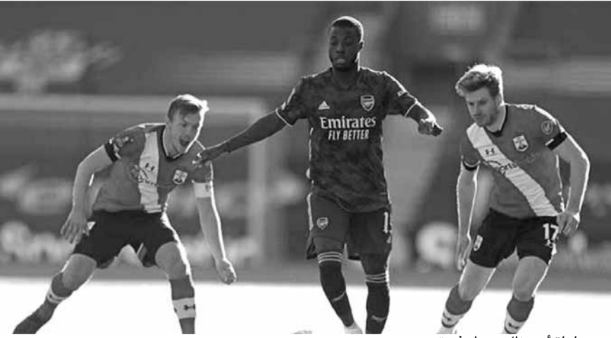
من مباراة أرسنال وساوثمبتون

خلال الميركاتو الصيفي المقبل، إذا لم يظهر ولاءه للنادي الكتالوني. ووفقا لصحيفة «سبورت» الإسبانية، فإن ديمبلي أظهر قيمته الفنية مع برشلونة في الفترة الأخيرة، لكن الأزمة حاليا تتعلق بالوضع التعاقدى للنادي الكتالوني. وأشارت إلى الإدارة الرياضية في برشلونة حاولت تجديد عقد ديمبلي في وقت سابق، لكن اللاعب ووكيله لم يرغبوا في الاستماع إلى