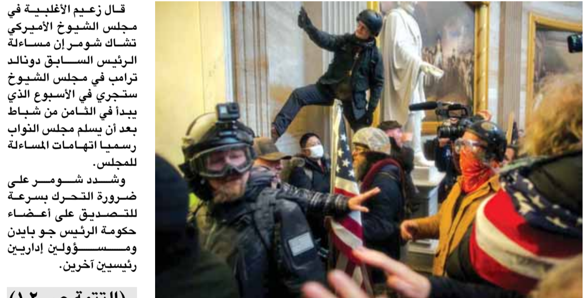
الاقحام الذي تسبب بمحاكمة ترامب

قال زعيم الأغلبية في مجلس الشيوخ الأميركي تشاك شومر إن مساءلة الرئيس السابق دونالد ترامب في مجلس الشيوخ ستجري في الأسبوع الذي يبدأ في الثامن من شباط بعد أن يسلم مجلس النواب رسمياً اتهامات المساءلة للمجلس. وشدد شومر على ضرورة التحرك بسرعة للتصديق على أعضاء حكومة الرئيس جو بايدن ومسؤولين إداريين رئيسيين آخرين.