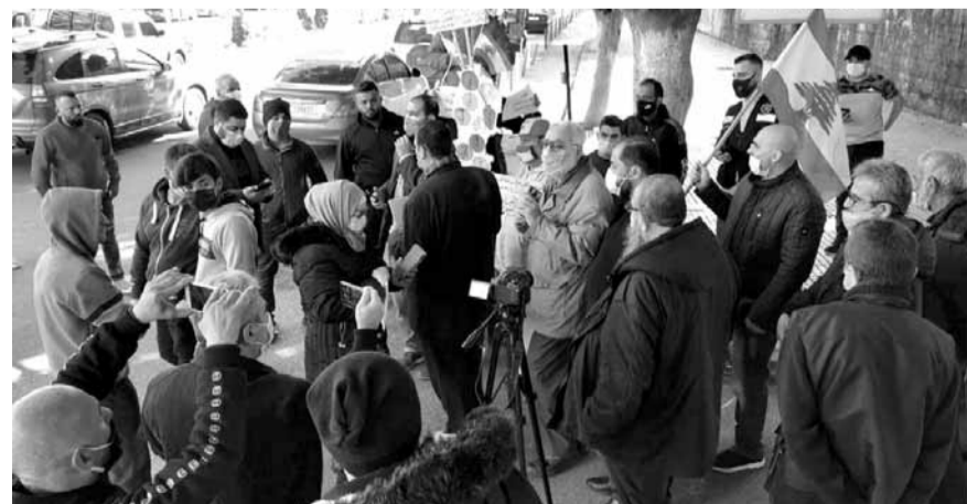
وقفة احتجاجية في صيدا

وقطع شبان ونسوة من اهالي البداوي ووادي النحلة والمكويين، مسلكي الأوتوستراد الدولي الذي يربط طرابلس بالمنية وصولاً إلى الحدود السورية في البداوي، بالشاطحات واقتروشوا الطريق، احتجاجاً على تردّي الأوضاع المعيشية ورفضاً لقرار تمديد فترة التعبئة، مطالبين بعودتهم للعمل لتأمين قوت يومهم، وتم تحويل السير إلى الطريق البحرية الجديدة.