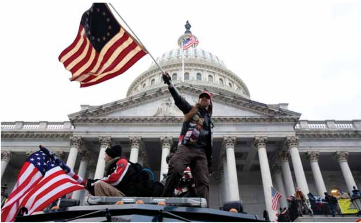
انصار ترامب لحظة اقتحام الكونغرس

وصوّت البرلمان العراقي مطلع العام الماضي على إنهاء البقاء العسكري الأجنبي في البلاد، إثر مقتل قائد فيلق القدس الإيراني قاسم سليماني ونائب رئيس هيئة الحشد الشعبي أبو مهدي المهندس، في قصف جوي أميركي قرب مطار بغداد الدولي.