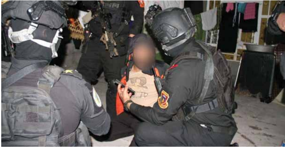
اعتقال عناصر من داعش خلال عملية «نار الشهداء»

الإستراتيجية (حكومي) في العاصمة بغداد، قال حسين سنطلب من الإدارة الأميركية الجديدة استمرار اجتماعات الحوار الإستراتيجي وتحديد فريق التفاوض، وسنبعث