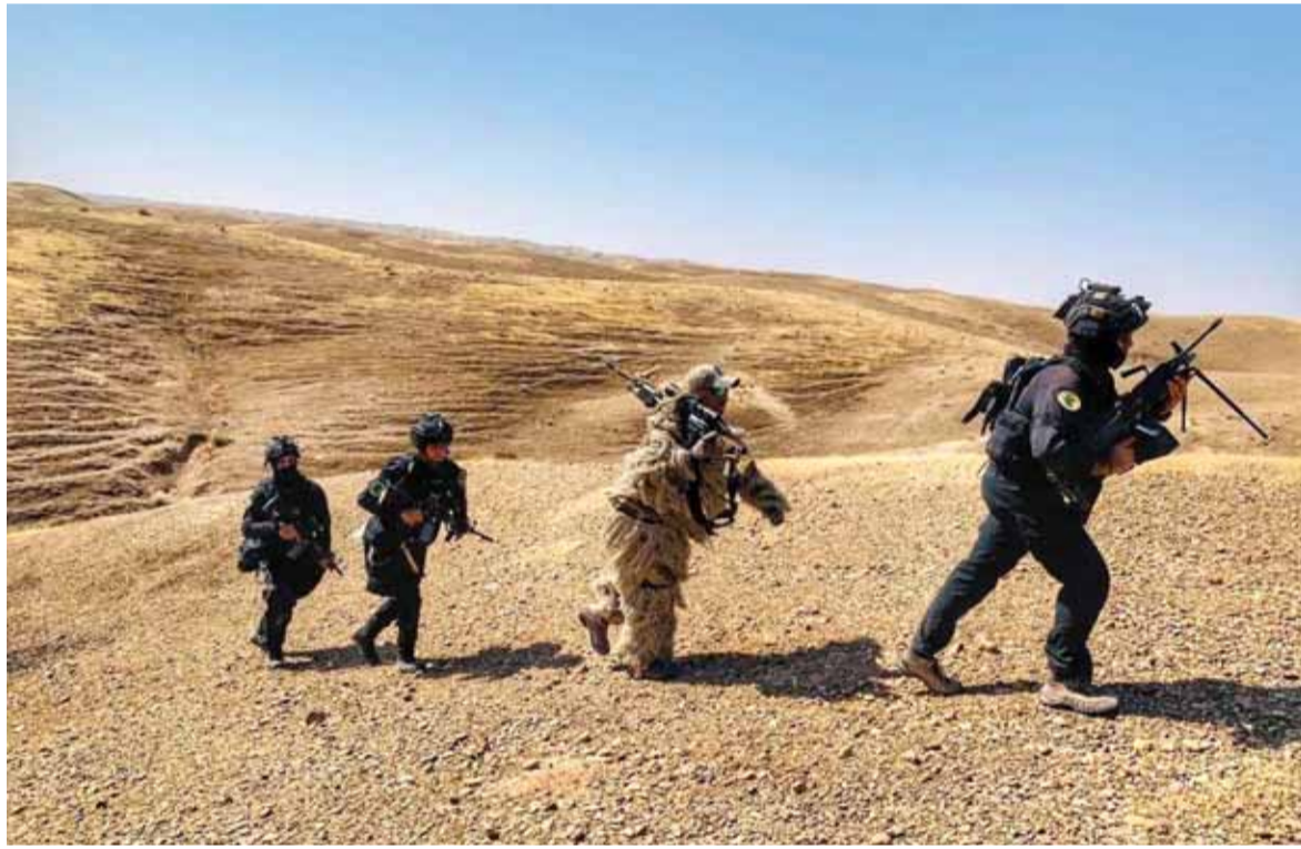
عملية «ثار الشهداء» في الرضوانية

على صعيد آخر، كشف الرئيس الأميركي السابق، دونالد ترامب، في أول تصريح له منذ مغادرة البيت الأبيض،