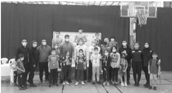
قائصوه مع الفائزين والفائزات

تنظم الاتحاد اللبناني للريشة الطائرة بطولة لبنان لعام ٢٠٢٠ على ملاعب نادي هويس الحازمية بمشاركة ١٢٦ لاعباً ولاعبة من ٨ أندية هي، مون لاسال، هويس بيروت، هويس انطلياس، سكودارا، الجمهور، قصير، شمران والتحرير. وسط اجراءات صارمة وفق معايير السلامة العامة المتخذة لضمان الوقاية من انتشار وباء «كوفيد-١٩»، أبرزها التغطية لارتداء الكمامة، التطهير الدوري للمعدات والملابس ومقاعد اللاعبين والمدربين، التساعد الاجتماعي بين اللاعبين، المدربين، الحكام والاهل ومنع الاحتكاك المباشر.