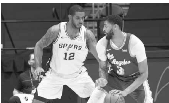
ديفيس بمرقبة الدريج خلال مباراة ليكرز وسان أنطونيو

وجاء فوز ننتس على الرغم من خوضه المباراة في غياب كيبفن دورانت وكابري إيرفينغ حيث غاب الأول بسبب بروتوكول جائحة-١٩ والثاني «لأسباب شخصية». وساهم أيضاً كاريس لوفير للفائز مع ٢٢ نقطة و١٠٠ متابعات وقال الأخير «نحن فريق مختلف تماما