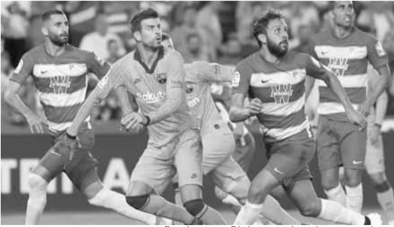
من إحدى مواجهات غرناطة وبرشلونة

السبت بملقاة مضيعة أتلتيكو مدريد المتصدر. ويصدر أتلتيكو بقيادة مدربه الأرجنتيني دييغو سيموني جدول ترتيب الدوري الإسباني بفارق نقطتين عن أقرب ملاحقيه ريال مدريد وله مباراتين مؤجلتين. وأبدى مارسيلينو غارسيا تورال المدرب الجديد ليليباو رضاه عن أداء فريقه الجديد رغم الهزيمة أمام برشلونة في ظهوره الأول. وقال مارسيلينو «لدي شقين إيجابيين، أول ٢٠ دقيقة والرضا عن عمل الفريق ومحاولته العودة بعد التأخر في النتيجة، هذا يخبرني بأن الأولاد لديهم الرغبة وأن الفريق سيتحسن». ويتطلع ريال مدريد بقيادة مدربه الفرنسي زين الدين زيدان لمواصلة الضغط على أتلتيكو في الصدارة من خلال المباراة التي تجمعهم بمضيفه أوساسونا اليوم السبت، رغم أن المباراة على ملعب «ال سادار» تواجه تهديدات تتعلق بتقلبات الطقس. وتعرضت باميلونا لتساقط تلوج كثيفة بفعل عاصفة دورا ليصبح الملعب التدريبي لأوساسونا مغطى بالثلوج، لكن حتى الآن من المتوقع أن تقام المباراة في موعدها. ويفتقد ريال مدريد جهود جناحه رودريغو غويس لكن الأداء الطيب للوكاس فاسكينز وماركو أسينسيو يجعل الفرنسي كريم بنزيما مطمئنا في خط الهجوم الملكي في وجودهما على الجناحين.