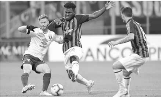
ميلان وتورينو اليوم في مواجهة قوية

كل ما نحننا في بنائه طوال الفترة الماضية». وفي الوقت الذي يأمل فيه بيولي، استعادة خدمات إبراهيموفيتش، والذي غاب عن المباريات الثماني الماضية بسبب إصابة عضلية، ينتظر أنطونيو كوتشي المدير الفني إنتر، اكتمال شفاء مهاجمه البلجيكي روميلو لوكاكو بعد ظهور قصير أمام سامبدوريا. وقال كوتشي «إنها ليست المرة الأولى التي تلعب فيها دون روميلو كاساسي، أنه يتمتع بمواصفات عالية لكنه لم يكن جاهزا لنسبة ١٠٠٪، وهو ما كان واضحا لدى مشاركته، أنه أمر محبب للأمل لأننا كنا نستحق الكثير». ويفتح أتالانتا صاحب المركز السابع، المرحلة السابعة عشر والتي تنطلق اليوم السبت، بمواجهة بينفيكتو الذي حقق الفوز في آخر ٤ مباريات خاضها خارج أرضه ليحتل المركز العاشر. ويتساوى أتالانتا في رصيد النقاط مع نابولي، ولديه مباراة مؤجلة أمام أودينيزي. وبولونيا، فيما يشهد يوم غد الأحد، مواجهة يستضيف فيها أودينيزي نظيره نابولي. ويحل لاتسيو، ضيفا على بارما، وكروتوني ضيفا على فيرونا، ويستضيف فيورنتينا، نظيره كالياري، ويحل سامبدوريا ضيفا على سبزيا بعد غد الإثنين.