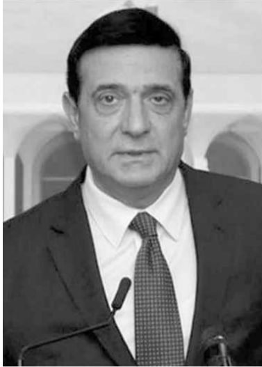
الوزير ميشال نجار