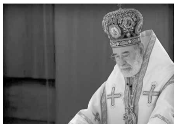
عودة يترأس القداس

والانهيار يعصف بمؤسساته وناسه، وما زال هناك بشر يفقتلون الأزمات، ويتقاذفون المسؤوليات، ويؤجلون الاستحقاقات، وآخرها تآليف حكومة تتولى مهمة القيام بما يلزم، بمهنية وشفافية، من أجل إنقاذ البلد، نحن في مسار انحداري خطير لم يعرفه لبنان من قبل. الدولة محتلة وتنتظر فترات المساعدات من الخارج، وسلوك الطبقة