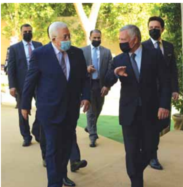
من جانبه أعرب الرئيس عبد الله الثاني مستقبلاً عباس

أكد الملك الأردني عبد الله الثاني استمرار بلاده في تادية دورها التاريخي والديني بحماية المقدسات الإسلامية والمسيحية في القدس من منطلق الوصاية الهاشمية على تلك المقدسات. وشدد الملك خلال لقائه الرئيس الفلسطيني محمود عباس في مدينة العقبة الأردنية أمس الأحد على ضرورة الحفاظ على الوضع القانوني والتاريخي القائم، مؤكداً رفض بلاده لجمع الإجراءات الأحادية التي تستهدف تغيير هوية المدينة ومقدساتها.