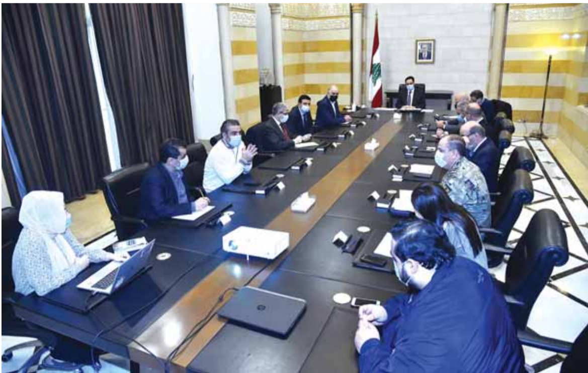
رئيس حكومة تصريف الاعمال حسان دياب يترأس اجتماع لجنة كورونا