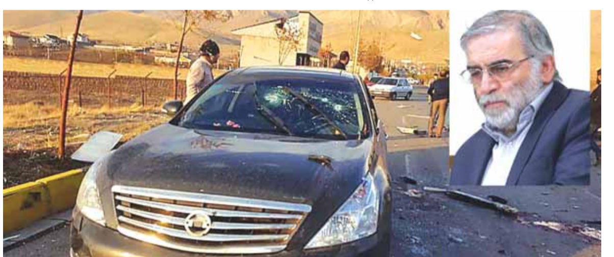
السيارة التي اغتيل بداخلها العالم الإيراني محسن فخري زاده

أكدت وزارة الدفاع الإيرانية اغتيال محسن فخري زاده، أحد أبرز العلماء النوويين، بهجوم مسلح وصفته الوزارة بالإرهابي. وقالت وزارة الدفاع إن العالم محسن فخري زاده كان رئيس مركز الأبحاث العلمية في الوزارة، واعتبر وزير الدفاع أميرحامي أن اغتيال العالم البارز محسن فخري زاده يظهر عمق كراهية الأعداء لإيران. وشدد مستشار المرشد