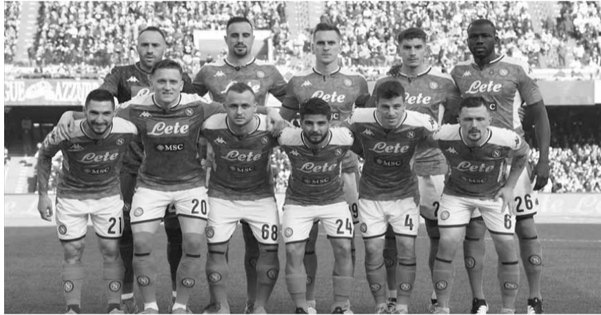
فريق نابولي سيسعى للفوز من أجل مارادونا

في ثماني مباريات لذا تعد المواجهة بمتعة على أرض الملعب.