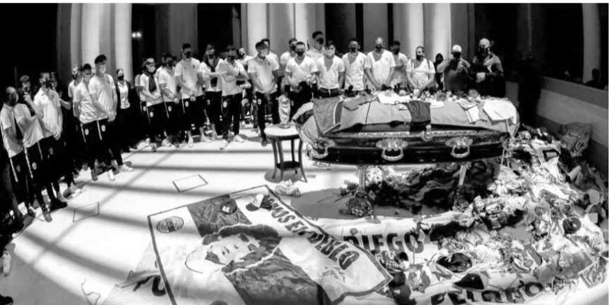
إلقاء النظرة الأخيرة على نعيش مارادونا

توفي عند الساعة «١٢ ظهرًا» (١٥,٠٠ غ)، مضيقًا أن نتائج التشريح الأولية تشير إلى أن سبب الوفاة هو «وذمة رئوية حادة ثانوية وفشل قصور القلب المزمن».