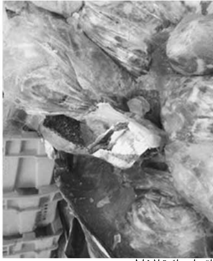
اتساع دائرة المخاطر

لا تنفك الحضّات تضرب المجتمع اللبناني، وإن كانت هذه السنة تحتل المرتبة الأولى، إلا أن قضايا الفساد في مختلف مؤسسات الدولة ومرافقها وحتى القطاعات، ليست بالأمر الحديث، بل مستشرية منذ عقود. فضيحة غذائية خلقت بلبلة ودعرا عند المواطنين، إثر مداهمة وزارة الاقتصاد، وأواخر تمّوز، مخازن دجاج ولحوم منتهية الصلاحية مع اتساع دائرة المخاطر المرتبطة بها. إذ كانت كشفت المعلومات عن عدد هائل من المطاعم والمؤسسات تتعامل مع «شركة فريحة»،