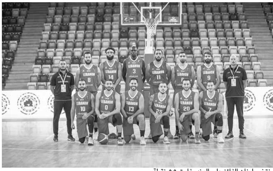
منتخب لبنان الفائز على الهند بفارق ٥٥ نقطة