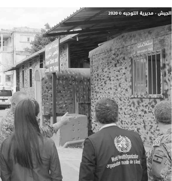
وقد من منظمة الصحة تزور الطبابة العسكرية

زار وفد من منظمة الصحة العالمية - مكتب لبنان أقسام الكورونا في الطبابة العسكرية في الجيش، واطلع على سير العمل فيها وكيفية توفير الخدمات الطبية للمرضى بما يتوافق مع المعايير الطبية العالمية، لا سيما بعد تجهيز هذه الأقسام بمعدات إلكترونية وحواسيب من قبل المكتب المذكور.