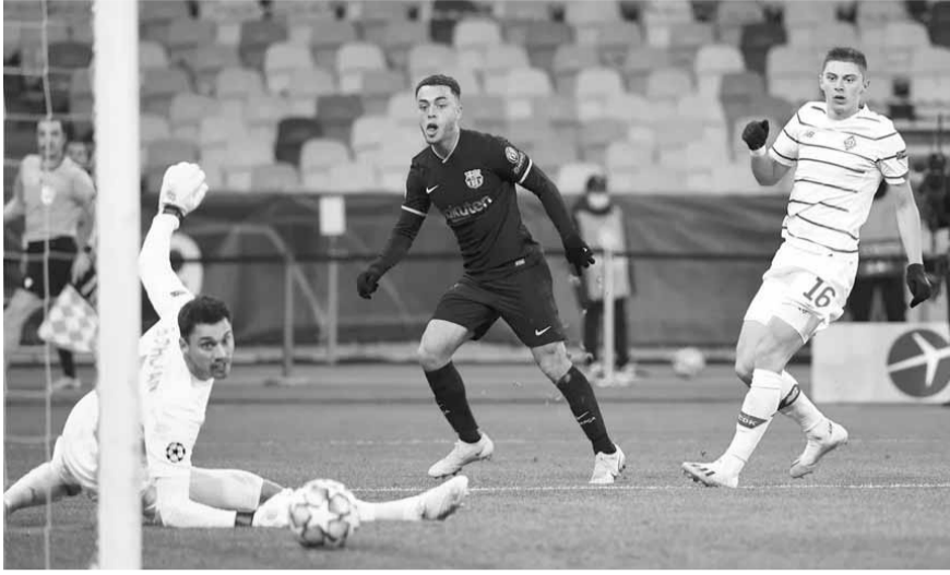
هدف برشلونة الأول في مرمى دينامو كييف

أعرب الهولندي رونالد كومان، المدير الفني لبرشلونة، عن سعادته بالفوز (٤-٠)، خلال مواجهة دينامو كييف الأوكراني، في الجولة الرابعة من دور المجموعات لدوري أبطال أوروبا. وقال كومان، في تصريحات نقلتها صحيفة «ماركا» الإسبانية: «لقد حققنا هدفنا بالتأهل إلى ثمن النهائي، وكانت الصورة إيجابية للغاية، حيث ظهر الفريق بالكثير من الطاقة». وأضاف: «كان هناك نقص في الفعالية الشوط الأول، لكن سيطرنا في الشوط الثاني وخدمنا أداء جيدا، وسعيد بالنتيجة، وأحببت الأداء الجماعي». وتابع: «أعتقد أننا قدمنا جانبا تكتيكيا أفضل من اللقاء الماضي ضدهم، وفي خط الوسط كنا جيدين ولعبنا بتركيز، وسيطرنا على المباراة حتى اللحظة الأخيرة». وأوضح: «الهدف من الدائرة كان منح الراحة للاعبين، وإعطاء الفرصة للآخرين، فهم يستحقونها». وعن غريزمان، علق: «إنه أحد اللاعبين الذين