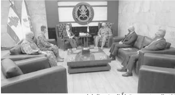
قائد الجيش مستقبلاً السفير الياباني

أرسلان حياً الشرطة القضائية: إنجازات أمنية شبيه يومية