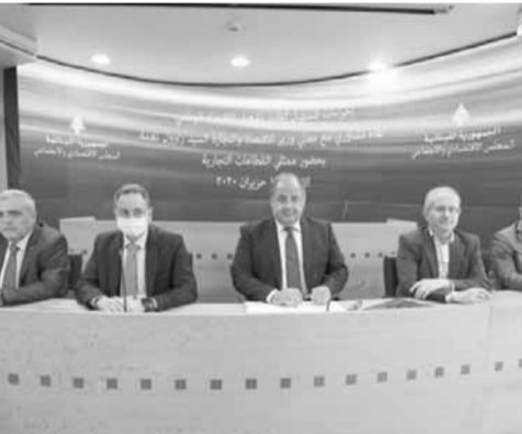
المجلس يدخل الاحد في تصريف الاعمال

والاجتماعي نشاطه وتنفيذ برنامج عمله، بما فيه انكبابه في هذه المرحلة على درس ملف رفع الدعم مع البنك الدولي، ومتابعة قضية تعويضات شركات التامين على المتضررين من انفجار مرفأ بيروت... وملفات أخرى استثنائية ملحة. في موازاة ذلك، هناك قانون تحديث المجلس المسجل في مجلس النواب منذ ما يقارب الثلاثة أشهر والذي يفترض إحالته إلى لجنة الإدارة والعدل لدرسه، وذلك بهدف تموضع المجلس في مؤسسة استشارية تشاركية لها دورها الفاعل، لاسيما أن يكون صلة الوصل بين القطاعات الإنتاجية والقوى العاملة من جهة، والحكومة... تجدر الإشارة، إلى أن مجلس الوزراء يعين هيئة عامة جديدة للمجلس الاقتصادي والاجتماعي بناء على مرسوم الهيئات الاكثر تمثيلاً، علماً أن عدد أعضاء الهيئة العامة أصبح ٧٨ بعدما كان ٧١، في حال أقر مشروع القانون الذي أعده المجلس، والقاضي بإضافة ممثلين عن قطاعي التكنولوجيا والعقار والاجتمع المدني وخبراء بيئيين ليصبح مجلساً اقتصادياً اجتماعياً بيئياً.