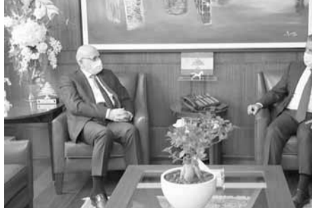
ابراهيم مستقبلاً خوري

استقبل المدير العام للأمن العام اللواء عباس ابراهيم في مكتبه ظهر امس، الأمين العام للمجلس الأعلى اللبناني - السوري نصري خوري، وبحث معه في الأوضاع العامة وملف النازحين السوريين في لبنان.