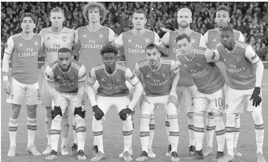
فريق أرسنال الانكليزي

تمتلك أندية أرسنال وليستر سيتي الانكليزيان وهوفنهايم الألماني إضافة إلى فياريال الإسباني فرصة ضمان التأهل المبكر إلى دور الـ ٣٢ من مسابقة الدوري الأوروبي، وذلك في حال حققت الفوز في الجولة الرابعة من دور المجموعات اليوم الخميس. من جهتها، تسعى أندية ميلان الإيطالي وتوتنهام الإنكليزي وريال سوسيداد الإسباني إلى نقل تفوقها المحلي إلى مسابقة الدوري الأوروبي لتحسين موقعها والاقتراب من التأهل إلى دور الـ ٣٢.