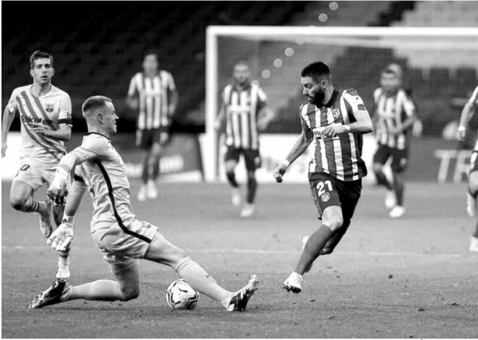
كاراسكو من أتلتيكو مدريد بمواجهة حارس برشلونه شتيفن

وأرسل ميسي كرة عرضية داخل منطقة الجزاء، إلى زميله الفرنسي غريزمان الذي سدده بالرأس بين يدي الحارس أوبلاك في الدقيقة (٨١). وحاول سيرغي روبرتو تجربة التسديد من خارج المنطقة، وأرسل كرة قوية اصطدمت بدفاع أتلتيكو وتحولت إلى ركنية في الدقيقة (٨٩)، قبل أن يخرج بسبب إصابة عضلية، لتنتهي المباراة بسقوط البرسا (١-٠).