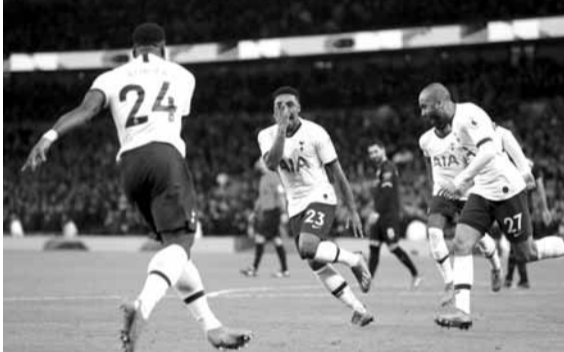
فرحة لاعبي توتنهام بالهدف الثاني

في المقابل، شهدت اللحظات الأخيرة هجمة سريعة للضيوف وصلت إلى سارغينت الذي مرر الكرة إلى إيفيستين ليقابلها الأخير بلسسة مباشرة إلى داخل الشباك، لينتهي الشوط الأول بتقدم برين (١-٠).