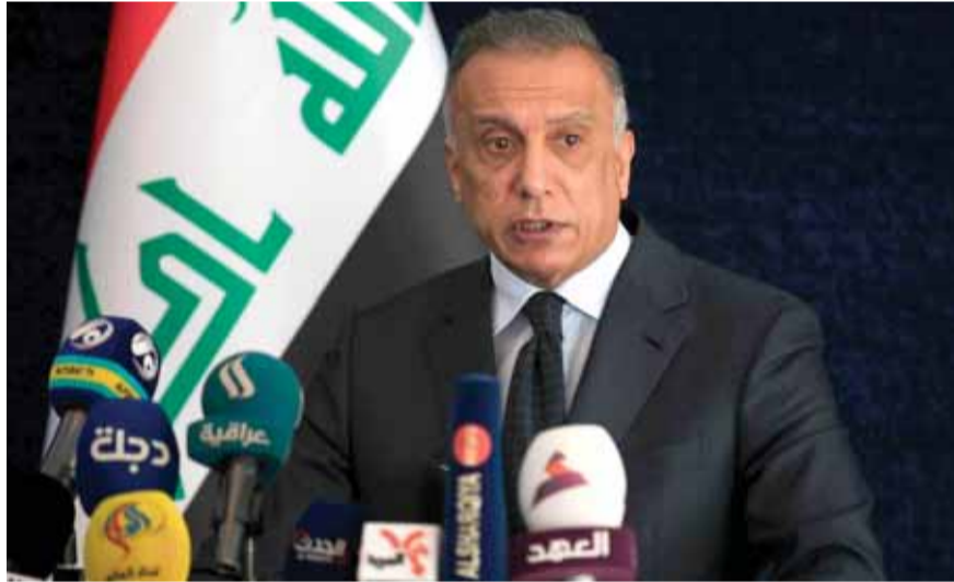
رئيس الوزراء العراقي مصطفى الكاظمي

قرر رئيس الوزراء العراقي مصطفى الكاظمي التريث في تطبيق الاتفاقية التي أبرمت مؤخراً بين الوقفين السني والشيعة لتقاسم الأوقاف الدينية في البلاد، وجاء ذلك ثمره لقاءات بين وفد المجمع الفقهي العراقي وكل من النواب محمد الحلبوسي. وكان علماء ومسؤولو مؤسسات شرعية وفعاليات دينية قد بحثوا بداية مع الحلبوسي الاتفاقية، واثّر