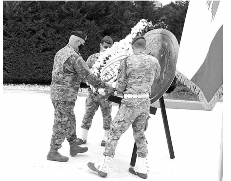
قائد الجيش يضع إكليلاً على نصب الشهداء

وضع قائد الجيش العماد جوزاف عون إكليلاً من الزهر على نصب شهداء الجيش في وزارة الدفاع الوطني، بمناسبة الذكرى الـ ٧٧ للاستقلال، تكريماً