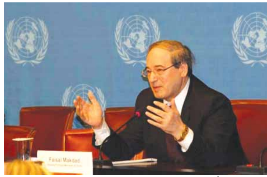
فيصل المقداد وزيرا للخارجية والمغتربين

أصدر الرئيس السوري، بشار الأسد، أمس الأحد، ٣ مراسيم تشريعية تقضي بتسمية فيصل المقداد وزيراً للخارجية والمغتربين، وبشار الجعفرى نائبا له، ونقل السفير بسام الصباغ إلى الوفد الدائم في نيويورك واعتماده مندوباً دائماً.