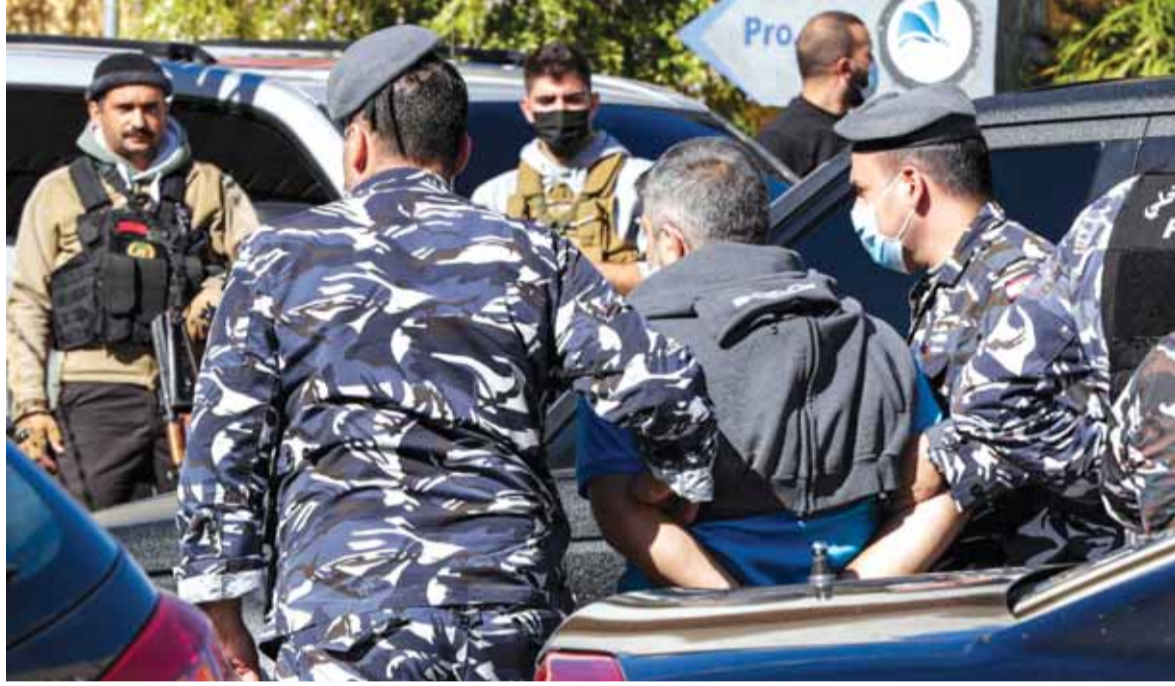
اللقاء القبض على أحد الفارين من سجن بعيدا

الحلفاء بأن الولايات المتحدة الأميركية جاهزة «لردع العدوان وطماننة شركاء وحلفاء الولايات المتحدة» وقادرة على تحريك قواتها «في غضون وقت قصير والاندماج في عمليات القيادة المركزية للمساعدة في الحفاظ على الاستقرار والأمن الإقليمي» كما أعلنت القيادة المركزية الأميركية.