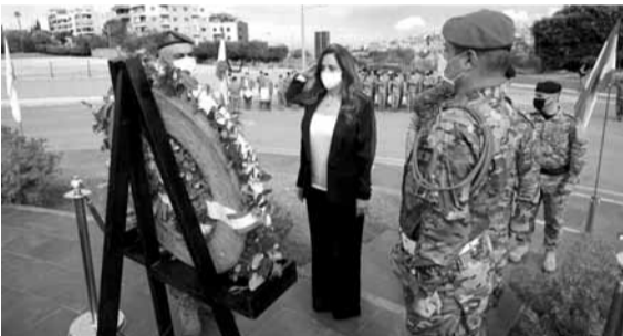
عكر وضعت اكليل على النصب

مثلت نائبة رئيس مجلس الوزراء ووزيرة الدفاع في حكومة تصريف الاعمال زينة عكر، رئيس الجمهورية العماد ميشال عون بوضع اكليل من الزهر على نصب الامير فخر الدين عند مدخل وزارة الدفاع، لمناسبة عيد الاستقلال، في حضور ممثل قائد الجيش العميد الركن انطوان فرنسيس، رئيس وضباط الغرفة العسكرية.