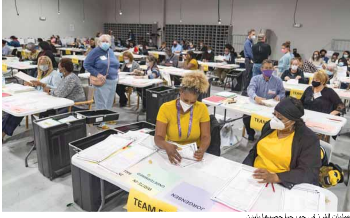
عمليات الفرز في جورجيا حصداً بايدن

أعلن الرئيس الأميركي المنتخب، جو بايدن، أنه اختار شخصية لتولي وزارة الخزانة، فيما واصل ترامب مساعيه للبقاء في السلطة رغم خسارته معارك قانونية في عدة ولايات. وكشف جو بايدن، أنه اختار شخصاً لحقيبة المالية سيقبل من كامل أطياف الحزب الديمقراطي، وأضاف أنه سيكشف عن اسمه قريباً. وقال «اتخذنا القرار وسنعلنكم به قبيل أو بعيد عيد الشكر»، الذي يحتفل به الأميركيون في ٢٦ تشرين الثاني الجاري.