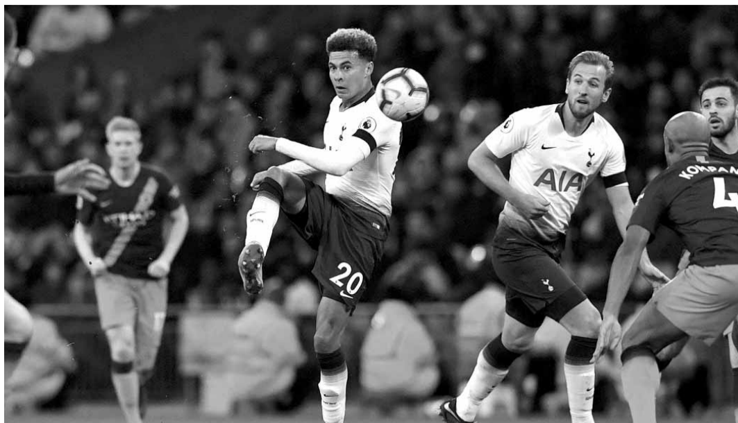
احدى مباريات توتنهام ومانشستر سيتي