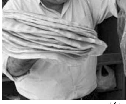
ارتفاع سعر القمح ٤٠٪

صدر وزير الاقتصاد والتجارة في حكومة تصريف الأعمال راول نعمه قرارين نافذين لغاية الخامس من كانون الثاني ١٢٠٢، حدّد بموجبهما طن دقيق القمح المُعدّ لإنتاج الخبز اللبناني (الموحد فئة ٨٥) أرض المطحنة بمبلغ // // // // (ثمانمئة واثنا عشر ألف ليرة لبنانية)، كحدّ أقصى.