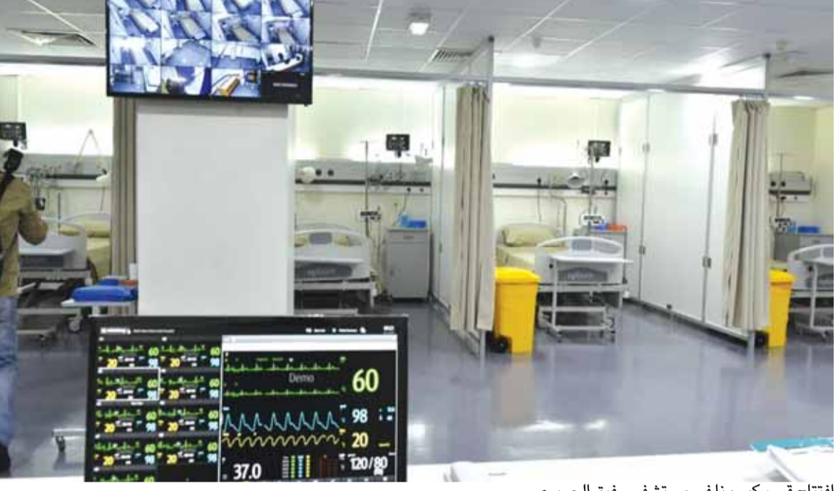
افتتاح قسم كورونا في مستشفى رفيق الحريري

مقطوعة بين الرئيس عون والحريري منذ آخر اجتماع بينهما يوم الإثنين الماضي»، لافتة إلى أن «أقدام الحريري على عرض تشكيلة لعون من ١٨ وزيراً لا تتضمن أسماء الوزراء الشيعة والدروز إنما حصراً الأسماء السننية ومعظم الأسماء المسيحية، استنقر رئيس الجمهورية الذي بات مقتنعاً بأن استمرار الحريري على ضرب مبدأ وحدة المعايير لا يمكن أن يمر مرور الكرام خاصة سعياً للتعاطي مع المسيحيين كحرف ناقص». وتشير المصادر إلى أن «أداء الحريري مرده إلى مواقف حاسمة بلغتها السفارة الأميركية في بيروت إلى بيت الوسط، يمكن اختصارها بـ «٣ لاءات»، وهي «لااعتذار أيا كانت الظروف، لا لتوزيع محسوبين على باسيل فتتحول الحكومة الجديدة نسخة منقحة عن حكومة حسان دياب، ولا لتوزيع قريبين من حزب الله»، لافتة إلى أن كل ذلك يدخل الملف الحكومي ومعه البلد ككل في ظلام حالك. وكما كان متوقعا، انعكس التشاؤم الحكومي على ملف التدقيق الجنائي مع قرار شركة «الفاريز ومارسال» بإنهاء الاتفاقية الموقعة مع وزارة المال للتدقيق المحاسبي الجنائي.