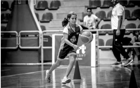
احدى اللعاب تستعرض موهبتها

استضاف كل من «Pro Camp» على ملعبه في الدكوانة و«WBA» على أرضه في طرابلس مرحلة تصفيات «بطولة تحدي المهارات الفنية وتسديد الريميات الثلاثية لأكاديميات كرة السلة» من تنظيم شركة «سبورتس مانيا» وموافقة الاتحاد اللبناني لكرة السلة بحضور اداريين، مدربين ولاعبين من الأكاديميتين.