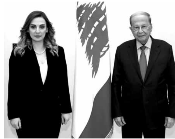
الرئيس عون مع وزيرة الشباب والرياضة

استقبل رئيس الجمهورية العماد ميشال عون قبل ظهر أمس في قصر بعبدا، وزيرة الشباب والرياضة في حكومة تصريف الأعمال السيدة فاريتيه اوهانيان التي اعلنته بان لبنان سيستضيف في العام ٢٠٢٢ المؤتمر الكشفي العربي الثلاثين ومنتدى الشباب الكشفي العربي الخامس، مشيرة الى انها ستسافر غداً الى القاهرة للمشاركة في المؤتمر الذي يعقد لهذه الغاية في العاصمة المصرية ولتستلم من نظيرها المصري الدكتور اشرف صبحي استضافة المؤتمر والمتمدى في لبنان. وسيحضر التسليم والتسلم الأمين العام المساعد لجامعة الدول العربية هيفاء ابو غزالة. وشددت الوزيرة اوهانيان على اهمية انعقاد المؤتمر الكشفي العربي والمتمدى في