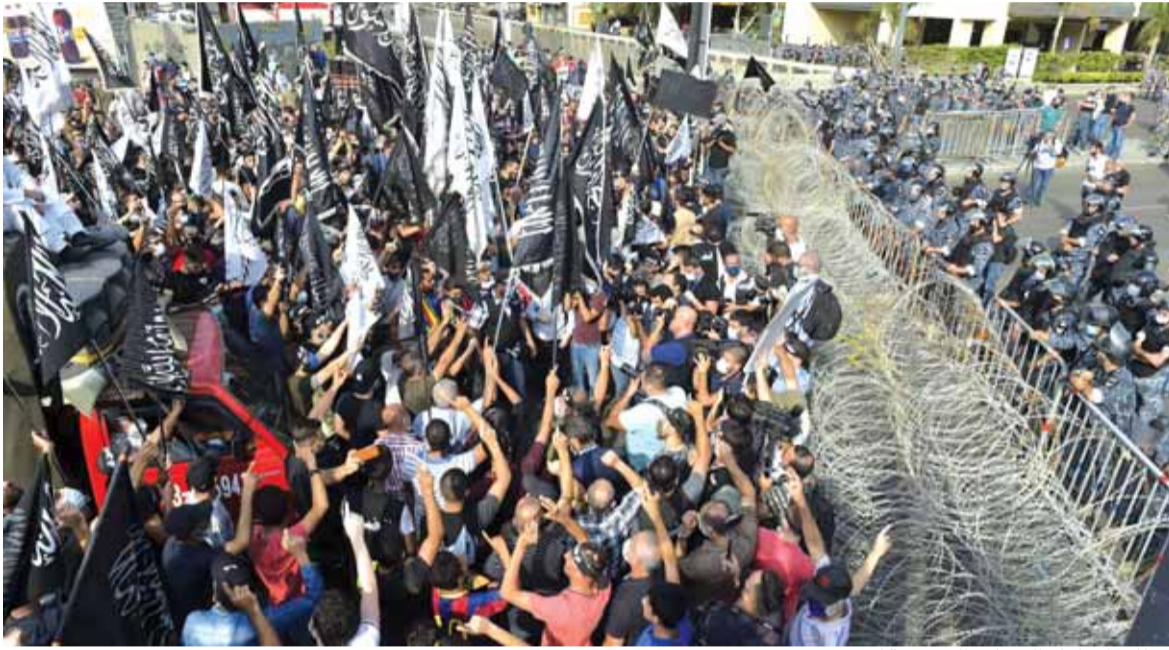
التظاهرات امام السفارة الفرنسية امس

الخدماتية يرخي بظلاله على عملية تشكيل الحكومة. والآنكى من ذلك ان كل الاطراف السياسية تقول انها تعمل بحسن نية من اجل انقاذ لبنان من ازمته في حين يظهر العكس على ارض الواقع حيث ان النيات الحسنة غير كافية لتشكيل حكومة فكما يقول المثل: طريق جهنم معبدة بالنوايا الحسنة. فهل سيكون للبنان حكومة قريباً ام سيستمر الصراع على النفوذ في وقت لبنان يغرق والشعب يجوع والهجرة في اعلى نسبتها؟ في هذا المجال، قالت اوساط مطلعة للديار ان وزارتي الداخلية والدفاع حسمتا لرئيس الجمهورية علما ان وزارة العدل يطالب بها رئيس الجمهورية ليكون مشرفاً على الاوضاع الامنية في البلاد اما وزارة الخارجية فستكون من ضمن حصص الحريري الذي اقترح على السفير مصطفى اديب توليها الا ان الاخير اعترض عن ذلك. وتحت شعار مبدأ المداورة، تقول اوساط بارزة في ٨ اذار ان حزب الله اقترح الحصول على وزارة الاتصالات او التربية او الاشغال بما ان وزارة الصحة قد تعطلت لفريق اخر. بدوره، يطالب تيار المردة بوزارة الطاقة او الداخلية بما ان