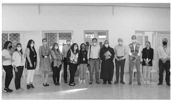
سفير ألمانيا مع وفد من كاريتاس

تفقد برامج «كاريتاس» الممول من الصندوق الإنساني سفير ألمانيا: نؤكد دعم بلادنا الدائم