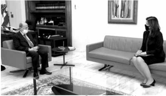
عون مستقبلاً السفيرة الفرنسية

تابع رئيس الجمهورية العماد ميشال عون مع زواره في بعثاء، مسار المفاوضات غير المباشرة لترسيم الحدود البحرية الجنوبية. وفي هذا الإطار، استقبل الرئيس عون سفيرة الولايات المتحدة الأميركية في لبنان السيدة دوروثي شيبا وعرض معها العلاقات اللبنانية-الأميركية وسبل تطويرها.