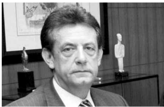
هارون في مؤتمره الصحافي

أعلن نقيب أصحاب المستشفيات الخاصة في لبنان المهندس سليمان هارون، في مؤتمر صحافي عقده، قبل ظهر في مركز النخابة، ان المستشفيات الخاصة «تتعرض لشتى الضغوطات المادية والمعنوية من جهات عدة، مما وضعها في موقع حرج لا تستطيع فيه التوفيق بين واجبها في تقديم الخدمات للمواطنين وبين قدرتها الفعلية على ذلك»، وقال: «المشاكل تتراكم فوق بعضها البعض دون التوصل الى معالجة اي منها، وتأتي كل واحدة منها لتضيف التعقيدات الواحدة لئلا الأخرى، من مشكلة عدم تسديد المستحقات للمستشفيات، الى ارتفاع سعر الدولار، الى تداعيات وباء الكورونا، واخيراً وليس آخراً الطلب من المستشفيات تسديد مشترياتها من الادوية والمستلزمات الطبية نقداً وعند التسليم».