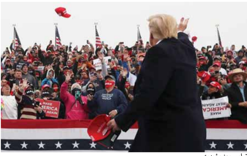
ترامب بين مؤيديه

أعلنت سلطات ولاية بنسلفانيا الرسمية عن فقدان بضعة آلاف من بطاقات الانتخاب المبكر في مقاطعة بتلر، في الشمال الغربي من الولاية، بالتزامن مع انتهاء موعد التصويت الرسمي للغانين. وأوضحت أن نحو ٤٠ ألف ناخب طلبوا تسلم بطاقاتهم الانتخابية بالبريد العادي، وتم التيقن من تسلم السلطات نحو ٢٤٪ من البطاقات. وتجرى إجراءات التحقيق في البطاقات المفقودة.