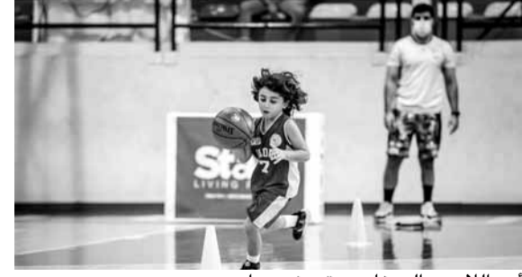
أحد اللاعبين الصغار يستعرض مواهبه