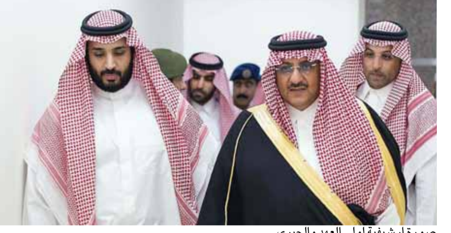
صورة ارشيفية لولي العهد والجبري

استدعت محكمة واشنطن الأميركية ولي العهد السعودي محمد بن سلمان وآخريين، بالإضافة إلى مؤسسة «مسك» الخيرية، في الدعوى القضائية التي رفعها المستشار الأمني السعودي السابق سعد الجبري ضدهم، والتي اتهمهم فيها بمحاولة اغتياله. وأظهرت وثيقة محكمة واشنطن بتاريخ ٢٩ تشرين الأول الجاري حصلت شبكة سي إن إن (CNN) على نسخة منها، أنها أرسلت مذكرة استدعاء محمد بن سلمان عبر واتساب باللغتين العربية والإنجليزية في ٢٢ أيلول الماضي. كما تضمنت وثائق المحكمة صورة للرسائل المرسله عبر واتساب تظهر وصولها والإطلاع عليها من قبل المرسل إليه، وقد «شاهدها