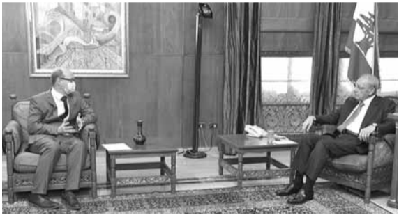
بري استقبال السفير النمساوي