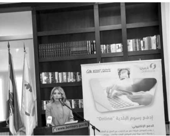
خلال الاحتفال في بيت مري

في سياق الجهد المتواصل الذي يقوم به الإعتماد اللبناني ترسيخاً لموقعه الطبيعي كمؤسسة رائدة ومبتكرة، وتماشياً مع استراتيجية المصرف الهادفة الى تطوير مجتمع غير نقدي (cashless society) وتشجيع قيام الحكومة الإلكترونية ، قام المصرف بالتعاون مع بلدية بيت مري وشركة الكرونية ومن خلال شركته التابعين NetCommerce وCCM، بإطلاق خدمة «بلديات Online» التي تتيح للمواطنين