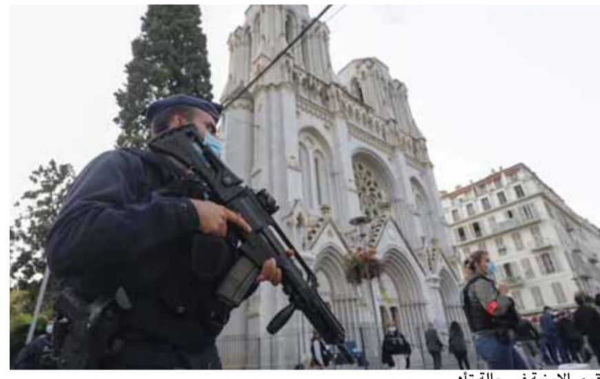
القوى الامنية في حالة تأهب

أعلنت الشرطة الفرنسية أمس، الجمعة، عن اعتقال رجل يشتبه بانه على علاقة بالهجوم الذي وقع، الخميس، في محيط كنيسة نوتردام بمدينة نيس، وخلف ٣ قتلى وعدة جرحى، فيما انتقد وزير الداخلية الفرنسي الرئيس التركي رجب طيب أردوغان. وقال وزير الداخلية، جيرالد دارمانان، ان هناك احتمالاً بوقوع مزيد من الهجمات في الأراضي الفرنسية. وأضاف نحن في حرب في مواجهة عدو خارجي وداخلي، وفي