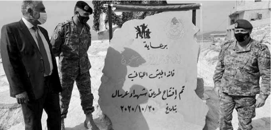
قائد الجيش دشن «طريق شهداء عرسال»

دشن قائد الجيش العماد جوزاف عون «طريق شهداء عرسال» التي يبلغ طولها ١٢ كلم، وتشكل صلة الوصل بين المراكز العسكرية، كما تسمح لأصحاب الأراضي في الجرد بالوصول إليها لاستثمارها بشكل أفضل.