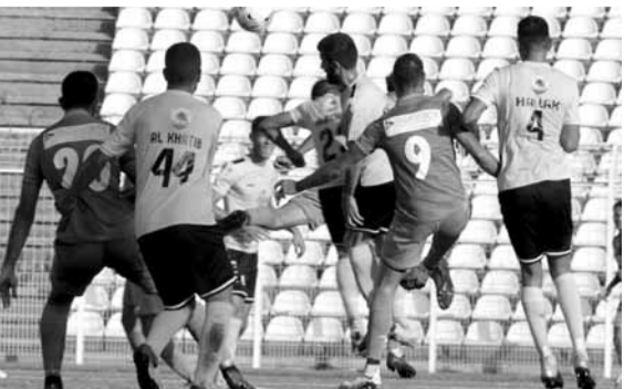
من إحدى مباريات بطولة لبنان

ويستضيف ملعب المرادشفي في زغربتا لقاء الطرفين. ويطمح أبناء الشمال الى تحقيق الفوز الأول في الدوري، والبناء على التعادل في الجولة الماضية ٢-٢ أمام البرج، حيث ظهر السلام (نقطة