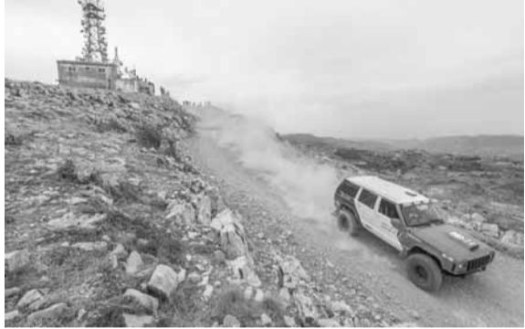
كميل تنوري خلال إحدى الطلعات