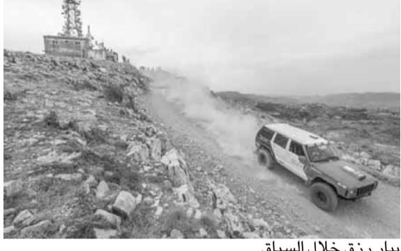
بيار رزق خلال السباق