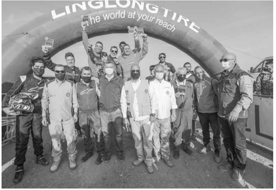
كبار الحضور مع الفائزين بمختلف الفئات