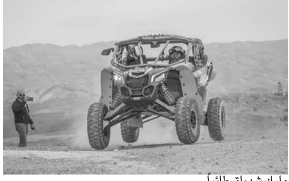
مارك شدياق طائراً