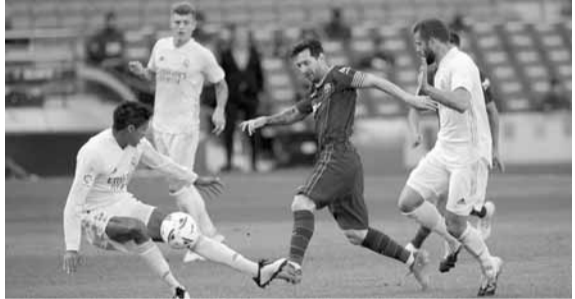
ميسي يحاول المرور عن فاران خلال المباراة مع ريال مدريد

لكن كورتوا تصدى لتسديدته بشكل رائع. واعتبرت الصحيفة أن ركلة الجزاء، التي جاء منها الهدف الثاني لريال مدريد، كانت السبب في هبوط حماس الأرجنتيني وتراجع أدائه.