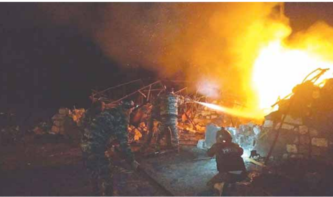
الاضرار الكبيرة جراء المعارك

اتهامات متبادلة بخرق الهدنة بين أرمينيا وأذربيجان «تهديدات» أميركية لتركيا... وروسيا ترفض الحل العسكري