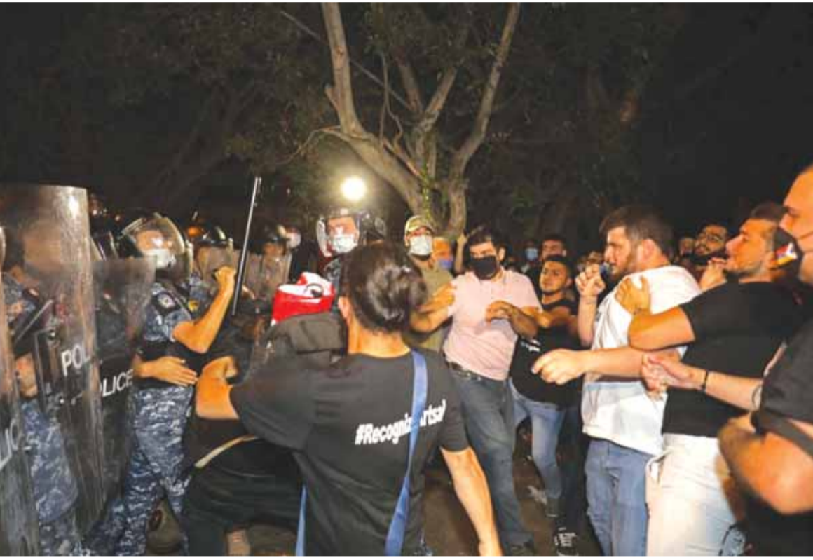
مواجهات بين القوى الامنية ومواطنين من الطائفة الارمنية تظاهروا امام السفارة التركية في بيروت

السباق، ونصائح اخرى باستغلال الوقت الضائع... ويالانتظار يبقى الأهم ان الرئيس المكلف لم يقدم اجوبته بعد حول كيفية مقاربه للاصلاح الاقتصادي المنهار، وعمما اذا كان مستسلما لشروط صندوق النقد الدولي بحرفيته، ما يضع البلاد امام استحقاقات اجتماعية مخيفة.