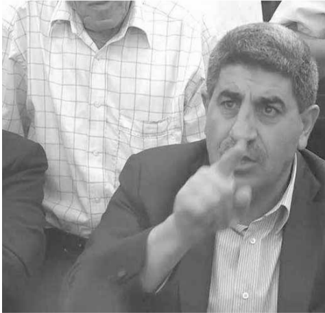
طليس في مؤتمره الصحفي

مع قيادة الجيش حيث تبين أن هناك بعض اللوائح غير مستوفية الشروط مما اضطرنا الى توزيعها على الاتحادات والنقابات لفرزها واستكمال المعلومات فيها كي يتم تسديد المستحقات لكل السائقين العموميين.