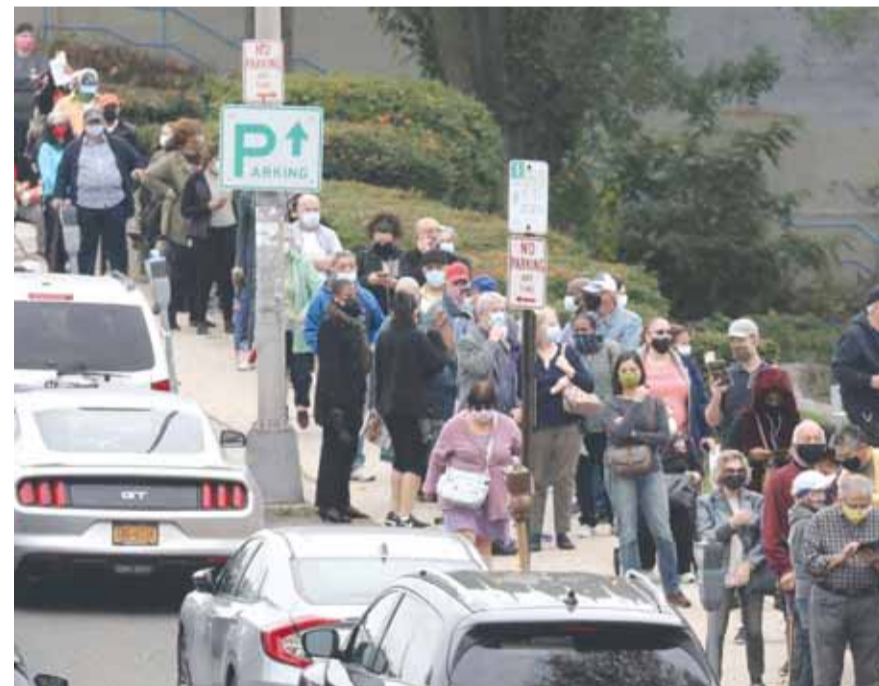
طوابير الناخبين بانتظار الادلاء باصواتهم

الانتخابات الأميركية: رغم تقدم بايدن... الحسم للولايات المتأرجحة