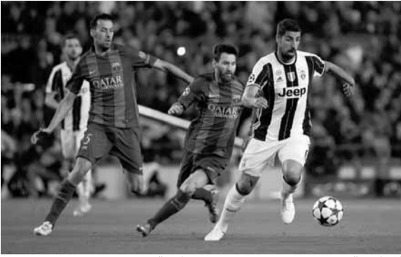
المواجهة تتجدد بين يوفنتوس وبرشلونة

اليوم : لوكوموتيف موسكو - بايرن ميونيخ ومونشنغلادباخ - ريال مدريد غداً : يوفنتوس - برشلونة ومانشستر يونايتد - لايبزيغ ودورتموند - زينت