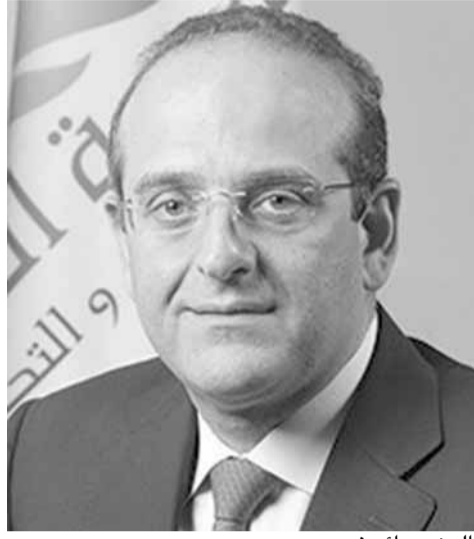
الوزير راند خوري

في كذبة كبيرة ويطرقون المثل القائل اصرف ما في الجيب ياتيك ما في الغيب وهذه الكذبة وصلت الى نهايتها ووقع الانهيار الكبير.