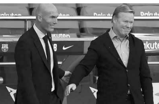
الكلاسيكو الأول بين كوهان وزيدان

من جهته، أعرب الفرنسي زين الدين زيدان المدير الفني لريال مدريد، عن سعادته بالانتصار خلال مواجهة الكلاسيكو ضد الفريق التقليدي برشلونة. وقال زيدان، خلال تصريحات نقلتها صحيفة «ماركا» الإسبانية: «الانتقادات؟ لا أعرف ما إذا كانت عادلة أم لا، ما يمكنني قوله هو أنني فخور بفريقي، وانتصرنا ضد فريق يسبب لنا دائماً المشاكل». وأضاف: «برشلونة هدد كورتوا مرتين، لكن كانت لدينا أيضاً فرص لتسجيل ٤ أهداف، وفي النهاية بُسعدنا حصد النقاط الثلاث هنا، ويجب أن نستمتع بعد كل التعليقات التي قالوها عنا». وعن الاختلاف في الأداء أمام شاخنثار والكلاسيكو، أجاب: «في بعض الأحيان لا يوجد تفسير، ما عليك أن تفكر فيه هو ما فعلناه اليوم، ونريد تكرار ما قدمناه اليوم، كما فعلنا العام الماضي أو ما قبل فترة التوقف، يجب أن نسير في هذا الطريق».