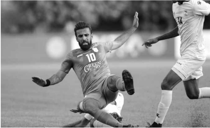
من مباراة الأناضار والعهد

حقق الراسينغ فوزاً قاتلاً على الإصلاح البرج الشمالي ١-٢ في ختام منافسات الأسبوع الرابع من بطولة لبنان لأندية الدرجة الثانية وذلك في المباراة التي أقيمت