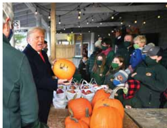
ترامب خلال جولاته الانتخابية التابعة للقوات المسلحة التركية بتدريب الجيش الانريجاني».

وشددت النيابة العامة الأرمنية، على أن «عناصر من (التتمة صفحة ١٢)