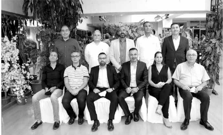
رئيس وأعضاء اللجنة الادارية الجديدة لاتحاد السباحة