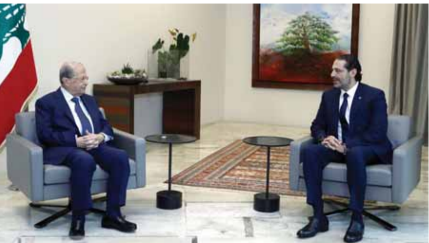
اللقاء بين الرئيس عون والحريري أمس (اللاطي ونهر)

حيث الوجود السني، كذلك انتشرت صورته في البقاع الاوسط من زحلة حتى الحدود اللبنانية السورية، كما انتشرت في طرابلس أيضاً ومناطق من عكار والمنية والضنية، وانتشرت صورته أيضاً في صيدا وفي مناطق عديدة، وهذا يعني عودة