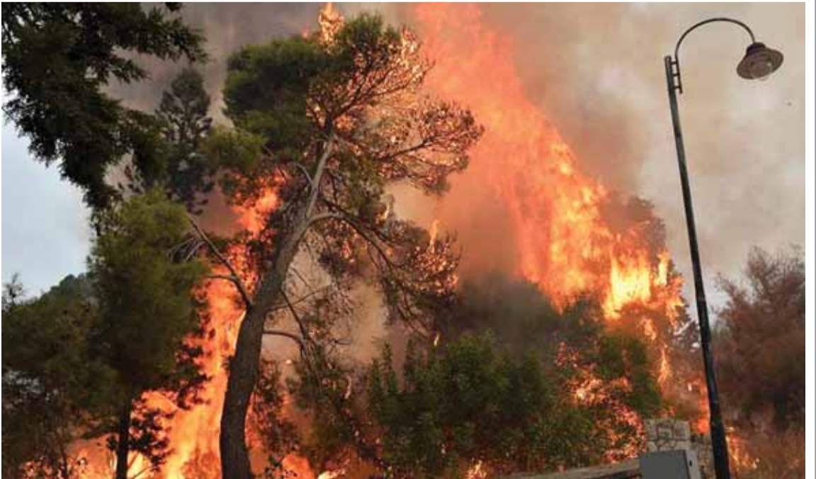
(التفاصيل ص ٤)