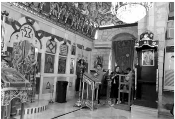
كرياكوس يترأس القداس

بوجود هذه الأرواح الشريرة؟ ولماذا يسمح اليوم بهذا الوباء الذي يفتك في العالم؟ يسمح الرب بذلك ربما لامتحاننا لأنه يريد الإنسان أن يتحمل وأن يستدعي الله بإيمانه وبشفاعة القديسين، لذلك نحن لا نياس مهما فعل الشر فينا ودائما بالرجاء والصبر ننتصر على كل الشدائد، والله يرى ذلك في الوقت المناسب».