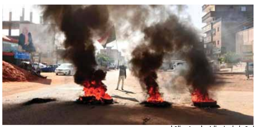
احتجاجات في الخرطوم ضد التطبيع

شدد رئيس الوزراء الإسرائيلي بنيامين نتانياهو على أن توصل بلاده إلى اتفاقات على تطبيع العلاقات مع الإمارات والبحرين والسودان جاء نتيجة لنهج حكومته الرامي لـ «السلام من منطلق القوة». وذكر نتانياهو أمس، في مستهل الجلسة الحكومية الأسبوعية، أن إبرام إسرائيل ثلاثة اتفاقات تطبيع في غضون ستة أسابيع فقط، بعد مرور ربع قرن دون اتفاقيات سلام، ليس من قبيل الصدفة بل نتيجة سياسة واضحة انتهجتها حكومته خلال السنوات الأخيرة و«جهود حثيثة للغاية تم بذلها على الصعيدين العلني والسري على مدار سنوات».