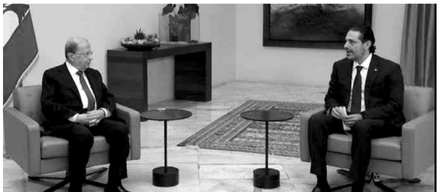
عون مجتمعاً مع الحريري (الداخلي ونهرا)

الجمهورية أو مصادر واسعة الاطلاع على موقف بعبداء، وغيرها من التوصيفات التي ترد في هذه الوسائل. حيايل هذا الامر، يؤكد مكتب الاعلام في رئاسة الجمهورية أن هذه المعلومات كاذبة وأساس لها من الصحة، ويدعو وسائل الاعلام الى العودة اليه في كل ما يخص مواقف رئيس الجمهورية العماد ميشال عون من المواضيع الطروحة، لانه الجهة الوحيدة المخولة تلك هذه المواقف وتعميمها، بالتعاون مع وسائل الاعلام كافة».