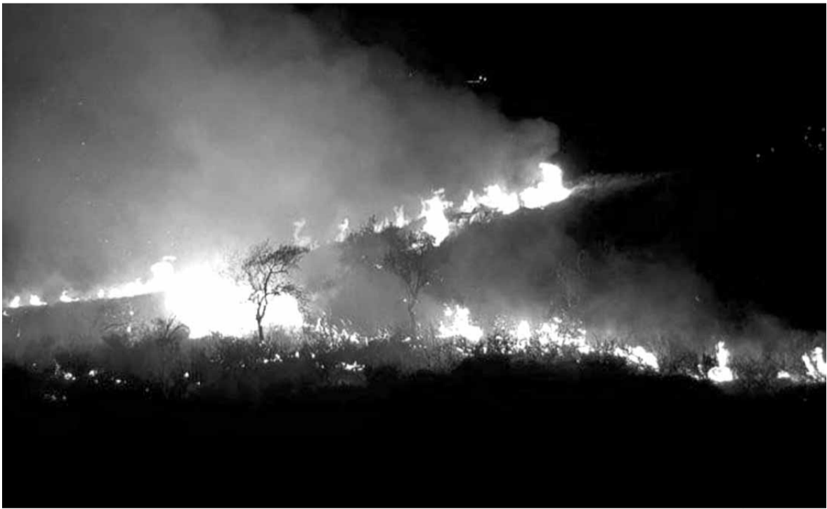
الحرائق في الجنوب