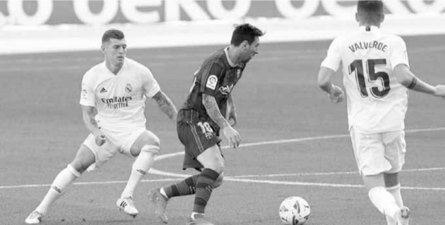
تجم برشلونة ليونيل ميسي بين لاعبي ريال مدريد توني كروس وفيدريكو فالغيريدي

للقطة ١٢، بينما استقر فرانكفورت في المركز السادس برصيد ٨ نقاط.