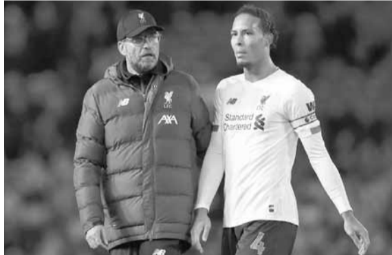
يورغن كلوب وفيرجيل فان دايك