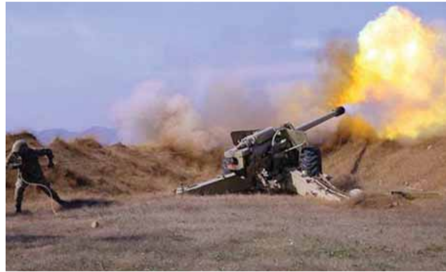
المعارك في قره باغ