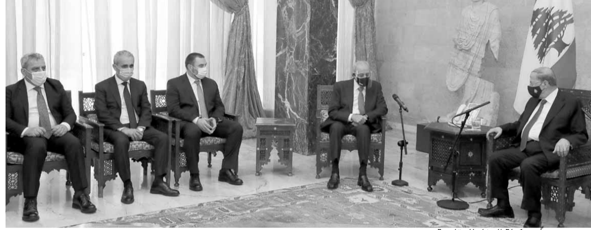
عون مجتمعاً مع كتلة الوفاء للمقاومة

وتكشف اوساط عن مروحة اتصالات بين قوى ٨ آذار