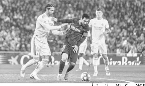
الكلاسيكو الإسباني غداً

وست هام يونايتد – مانشستر سيتي (الساعة ١٤،٣٠)