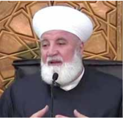
وريفها والمشرق العام على مركز الشام الدولي الإسلامي لمواجهة التطرف.

أقادت وكالة «سانا» السورية للأنباء، عن مقتل الشيخ محمد عدنان أفيوني مفتي دمشق وريفها إثر إصابته بتفجير العبوة الناسفة في بلدة قدسيا في سوريا. ونكرت الوكالة «استشهد الشيخ محمد عدنان الأفيوني مفتي دمشق وريفها جراء استهداف سيارته بتفجير إرهابي غادر مساء أمس في بلدة قدسيا بريف دمشق». ونعت وزارة الأوقاف الأفيوني الذي ارتقى إلى الله شهيداً إثر استهداف سيارته في قدسيا بتفجير إرهابي غادر نتيجة عبوة ناسفة مزروعة فيها. والشيخ الأفيوني من كبار علماء سورية والعالم الإسلامي وهو عضو المجلس العلمي الفقهي في وزارة الأوقاف ومفتي دمشق