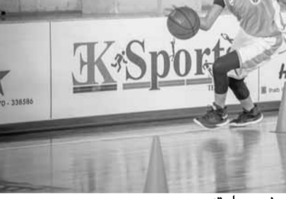
أحد اللاعبين يستعرض مهارته