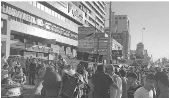
تجمع عند جل الديب

تجمع عدد من الناشطين عند جسر جل الديب، احتجاجاً على تكليف الرئيس سعد الحريري تشكيل الحكومة العتيدة، مطلقين شعار «عن حقاك دافع»، مطالبين بـ«إسقاط المنظومة الحاكمة بأكملها وبشكل نهائي»، وسط انتشار للجيش وقوى الامن الداخلي في المنطقة.