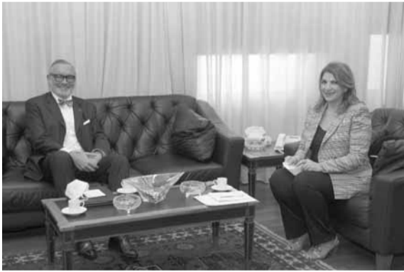
نجم مستقبلة السفير البلجيكي

استقبلت وزيرة العدل في حكومة تصريف الاعمال ماري كلود نجم، ظهر امس في مكتبها في الوزارة، سفير اليابان تاكيشي أوكوبو. وتناول البحث سبل التعاون القضائي بين لبنان واليابان.