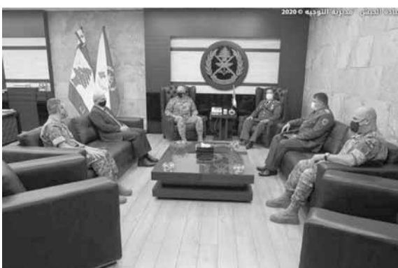
قائد الجيش مستقبلاً المحقق البلغاري

استقبل قائد الجيش العماد جوزاف عون في مكتبه في البرزة، المحقق العسكري البلغاري في لبنان العقيد Zdravko YACHEV، في زيارة ودية قدم خلالها خلفه العقيد Pavlin Petkov BOZOFF.