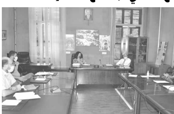
الاجتماع في بلدية طرابلس