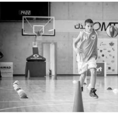
لقطة من التصفيات