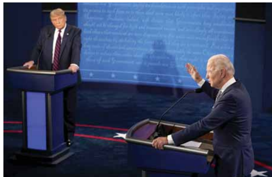
خلال المناظرة الاولى بين ترامب وبايدن

تتاح للرئيس الأميركي دونالد ترامب، فجر اليوم، آخر فرصة لطرح حجج تقنع الجماهير بإعادة انتخابه، حين يواجه منافسه الديمقراطي جو بايدن أمام حشد ضخم من الأميركيين في مناظرة عامة هي الأخيرة بينهما قبل الانتخابات المقررة في ٣ تشرين الثاني. وتأتي المناظرة التي ستنقلها شاشات التلفزيون في وقت يحتاج فيه ترامب بشدة لتغيير مسار السباق، إذ يخلف بدرجة كبيرة عن بايدن في استطلاعات الرأي على مستوى البلاد قبل أقل من أسبوعين على التصويت، وإن كانت المنافسة أكثر احتداماً بكثير في بعض الولايات. وكانت المناظرة الأولى بينهما في نهاية أيلول في كليفلاند بولاية أوهايو انتهت إلى فوزي عارمة، وتبادل اتهامات بين المرشحين.