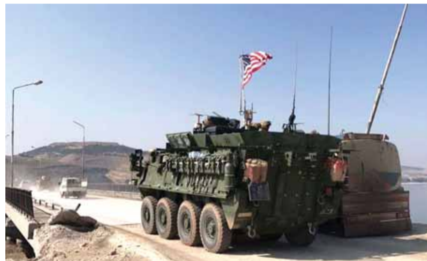
قوات اميركا شرق الفرات

قال وزير الخارجية الأميركي، مايك بومبيو، تعليقا على «زيارة سرية» قام بها مسؤول من البيت الأبيض إلى دمشق، إن السلطات السورية رفضت طلب واشنطن حول مواطنين أميركيين محتجزين لدى سوريا. وقال بومبيو، في مؤتمر صحفي عقده في مقر الخارجية الأميركية، ردا على سؤال حول زيارة المسؤول الأميركي إلى دمشق، إن الولايات المتحدة تسعى إلى دفع الحكومة السورية للإفراج عن الصحفي الأميركي المحتجز، أوستين تايس. وأوضح: «عندما نعمل على قضايا معتقلين نركز اهتمامنا على هذا الموضوع. طلبنا يتمثل في إفراج السوريين عن السيد تايس والكشف لنا عما يعلمون، لكنهم اختاروا عدم فعل ذلك». ويأتي هذا التصريح بعد أن نقلت صحيفة «وول ستريت جورنال»، الأحد الماضي، استناداً إلى مصادر في إدارة الولايات المتحدة، أن نائب مساعد الرئيس الأميركي، كاش باتيل، الذي يعد مسؤولاً بارزاً معنيا بمكافحة الإرهاب بالبيت