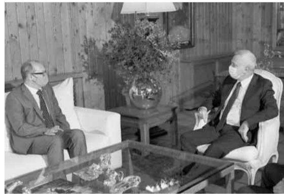
فرنجية مستقبلا السفير النمساوي