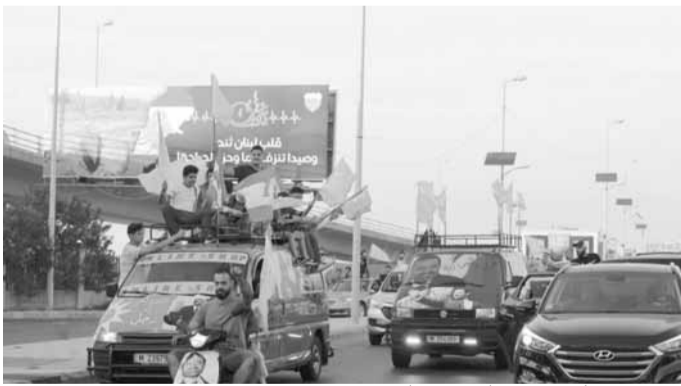
مسيرة سيارة في شوارع صيدا

الجومة، مؤيدة للحريري، حيث أطلقت ابواقها، وعلت منها الأناشيد الحماسية، ورفع المشاركون صورة كبيرة للحريري وشارات النصر واعلام «تيار المستقبل»، للتعبير عن فرحتهم بتكليفه لتشكيل الحكومة الجديدة.