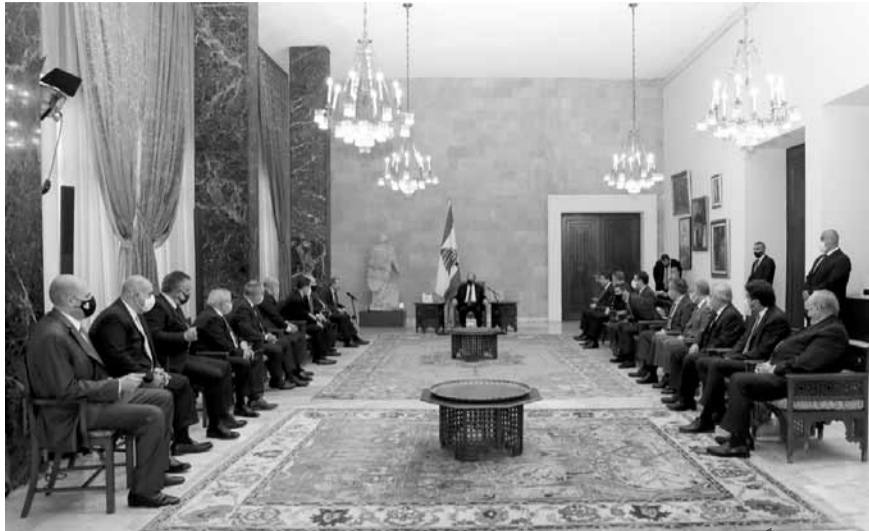
عون مجتمعاً مع كتلت لبنان القوي