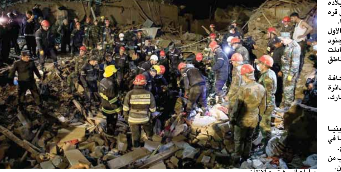
عمليات البحث تحت الأنقاض

أعلنت أذربيجان أن عدداً من المدنيين قتلوا أمس الأول في قصف ليلي أرميني استهدف مدينة غنجه شمال شرقي البلاد، لكن السلطات الأرمينية نفت ذلك وعبرت عن استعدادها لتطبيق الهدنة في إقليم ناغورني قره باغ. في المقابل، شدد الرئيس الأذري على أن بلاده لن تستهدف المدنيين وأنها سترد في الميدان. وأعاد مكتب المدعي العام الأذري اليوم بمقتل ١٢ مدنياً وإصابة أكثر من ٤٠ آخرين في مدينة غنجه شمال شرقي البلاد جراء قصف من قوات أرمينية، مضيفاً أن قذيفتين سقطتا على مدينين سكنيين. ومن جانبها نفت الخارجية في أرمينيا أن يكون جيشها قد قصف مناطق داخل أذربيجان أسفرت عن سقوط قتلى وجرحى. وأعلن رئيس الدولة إلهام علييف السيطرة على مدينة فضولي، قائلاً إن بلاده لن تستهدف المدنيين وسترد في الميدان وإن «هجمات الجيش الأرميني الغادرة ضد المدنيين لن تكسر إرادة شعبنا». وتساءل علييف «من أين تحصل أرمينيا الفقيرة على هذا الكم الهائل من الأسلحة؟ ومن يعطيها السلاح؟ هل يجري تهريبه إليها بطرق غير قانونية؟». سقوط قذائف بإيران من جانب آخر، أصدرت طهران تحذيراً جديداً لأرمينيا وأذربيجان المجاورتين بعد سقوط قذائف جراء معاركهما في الجانب الإيراني من الحدود، مما أدى لإصابة شخص بجروح. وكانت إيران حذرت الدولتين في وقت سابق من الاقتراب من أراضيها، ونشرت دبابات على حدودها مع أرمينيا وأذربيجان.