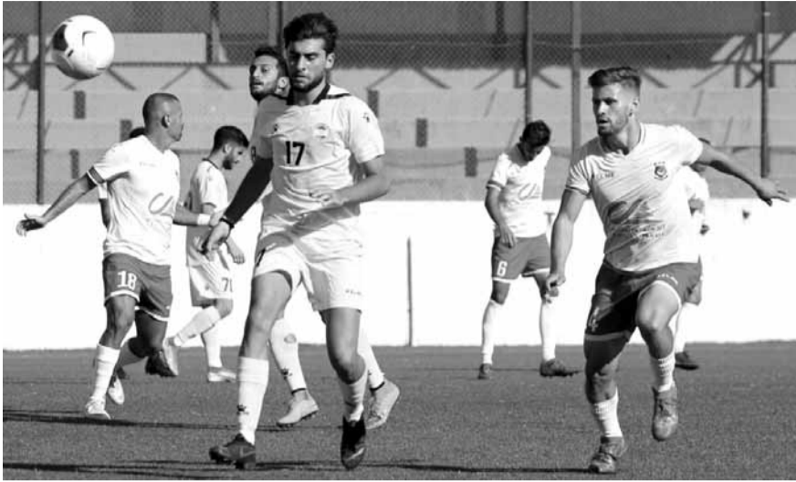
لقطة من احدى المباريات