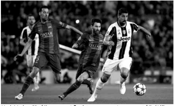
من اللقاء الأخير بين يوفنتوس وبرشلونة في دوري الأبطال عام ٢٠١٧

واعادت الفرق بشكل كبير، غياب الجماهير في الفترة الحالية، لكنها تواجه المزيد من المخاوف بسبب ازدياد جدول المباريات في الموسم الذي تأخرت انطلاقة منافساته بسبب أزمة كورونا.