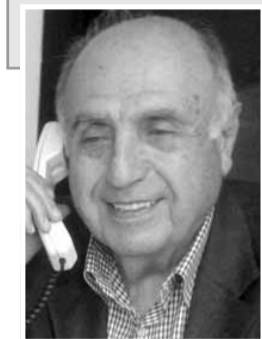
اعداد: لوران ناكوزي