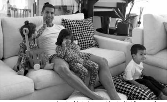
رونالدو مع أطفاله في المنزل قبل اعلان إصابته

واختتم كريستيانو رونالدو: «كل هذا أساسي بالإضافة لتناول الطعام الكثير من الخضراوات، هذا الفيروس خطير لكنني لست خائفا».