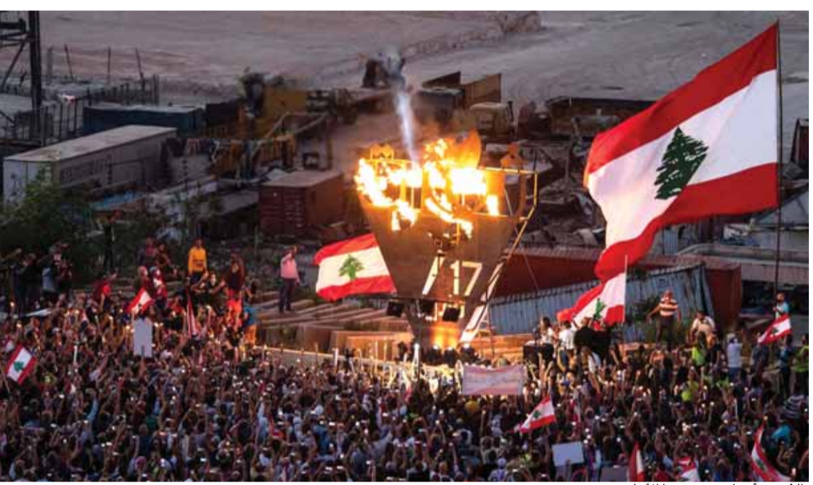
«الثورة» أضاعت شمعتها الأولى

حنا أيوب «لبنان إلى زوال وعلى شفا الانهيار ما لم تتغير المقاربة وتعتمد اصلاحات عاجلة»، هذا ما قاله منذ شهر مضى وزير خارجية فرنسا جان ايف لودريان في احدى مداخلته عن الحالة في لبنان. في الحقيقة، لبنان «الدولة» ينهار، الأدوية مقطوعة في الصيدليات، المواطنون يتوسلون علبه دواء من هنا وهناك، يقفون في الصف لساعات للحصول على جزء يسير من الدواء يكفيهم لايام. في البنزين والمازوت، حدث ولا حرج، الطوابير أمام محطات الوقود لا تعد ولا تحصى، بينما اللبنانيون مقلبون على فصل الشتاء والطلب على المحروقات سوف يزداد. أما المواد الغذائية والمهددة كباقي المواد المذكورة آنفاً يرفع دعم مصرف لبنان عنها جزئياً أو بشكل كامل في مرحلة لاحقة، فهي أصلاً مقننة وأسعارها تفوق بأضعاف قدرة اللبنانيين الشرائية الضعيفة بعد تدهور سعر صرف الليرة اللبنانية مقابل الدولار الأميركي، أضف إلى ذلك تعميم مصرف لبنان الأخير الذي وضع سقفاً للسحوبات الشهرية بالليرة اللبنانية من المصارف، ما أدى إلى تحويل الاقتصاد أكثر فاكثراً إلى اقتصاد «الكاش». تتمة المانشيت ص ١٢