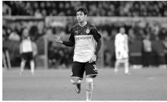
جوهرة دورتموند جوفاني رينا

قبل اتخاذ أي قرار نهائي بشأن ضم اللاعب من عدمه خلال صيف العام المقبل.