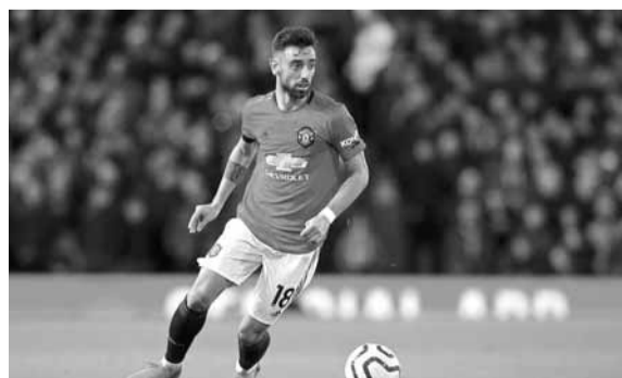
البرتغالي برونو فرنانديز

وجود أي أزمة بينه وبين لاعبي مانشستر يونايتد، أو المدرب أولي غونار سولسكاير. يذكر أن برونو فرنانديز، كان على طاوله اهتمام ريال مدريد بقوة، قبل الانتقال إلى صفوف الشياطين الحمر، خلال الميركاتو الشتوي الماضي.