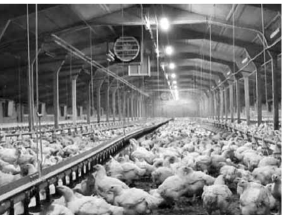
إعادة فتح باب الاستيراد

برزت منذ فترة مشكلة فقدان اللحمة البيضاء من الأسواق، تحديداً صدور الدجاج، عقب القرار المشترك لوزارتي الاقتصاد والتجارة والزراعة القاضي بتحديد أسعار اللحوم بعد تأمين الدعم لها، إلا أن هذه الأسعار لم تناسب مزارعي ومربي الدواجن، وأنهم هؤلاء بالتخزين وتقنين التسليم.