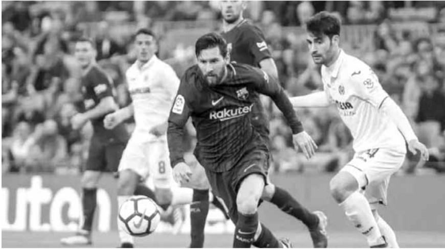
من إحدى مباريات فياريال وبرشلونة

ويريد مدريد، الذي ترك جاريث بيل ينضم لتوتنهام وخاميس رودريغيز لإيفرتون، أن يظهر أوديجارد الأداء الذي قدمه مع ريال سوسيداد في الموسم الماضي عندما كان معاراً له، لضمان أن كريم بنزيما لديه إمدادات مستمرة. وفي بقية مباريات هذه الجولة، يلتقي الأفييس مع خيتافي، وفالنسيا مع هويسكا، والتشي مع ريال سوسيداد، وأوساسونا مع ليفانتي وأتلتيكو مدريد مع غرناطة، وبلد الوليد مع سلتا فيغو.