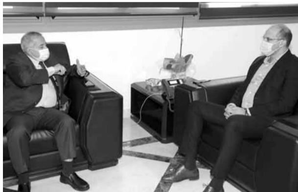
حمد حسن ونقيب الصيدالة