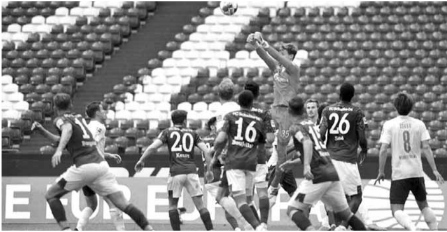
مواجهة شالكه وبريمن غداً قد تحسم مصير مدربي الفريقين

كما أن الارتفاع الأخير في حالات الإصابة بفيروس كورونا في المنطقة جعل الأمور غير واضحة، بشأن ما إذا كانت الجماهير ستكون قادرة على حضور المباراة من عدمه، ويأمل شالكه حضور ١١ ألف مشجع ولكنه لن يبدأ بتوزيع التذاكر قبل الغد.