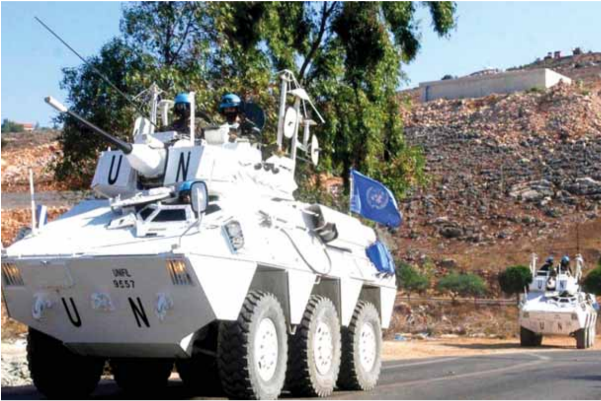
دورية لقوات اليونيفيل في الجنوب