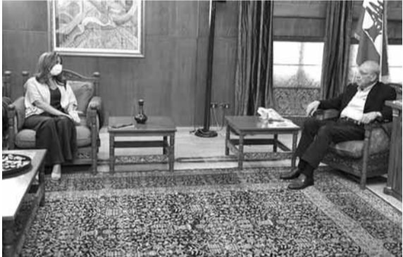
بري مجتمعاً مع عكر (حسن ابراهيم)

عرض رئيس مجلس النواب نبيه بري في مقر الرئاسة الثانية في عين التينة، مع وزيرة الدفاع في حكومة تصريف الاعمال زينة عكر، الأوضاع العامة لا سيما منها الوضع الأمني.