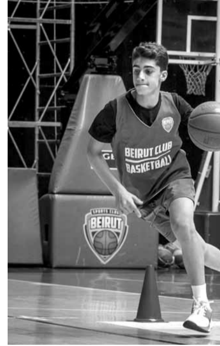
... وأحد اللاعبين في لحظة من المرحلة