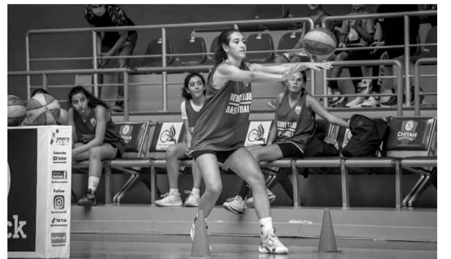
أحدى اللاعبات خلال المرحلة الثانية من أكاديمية نادي بيروت