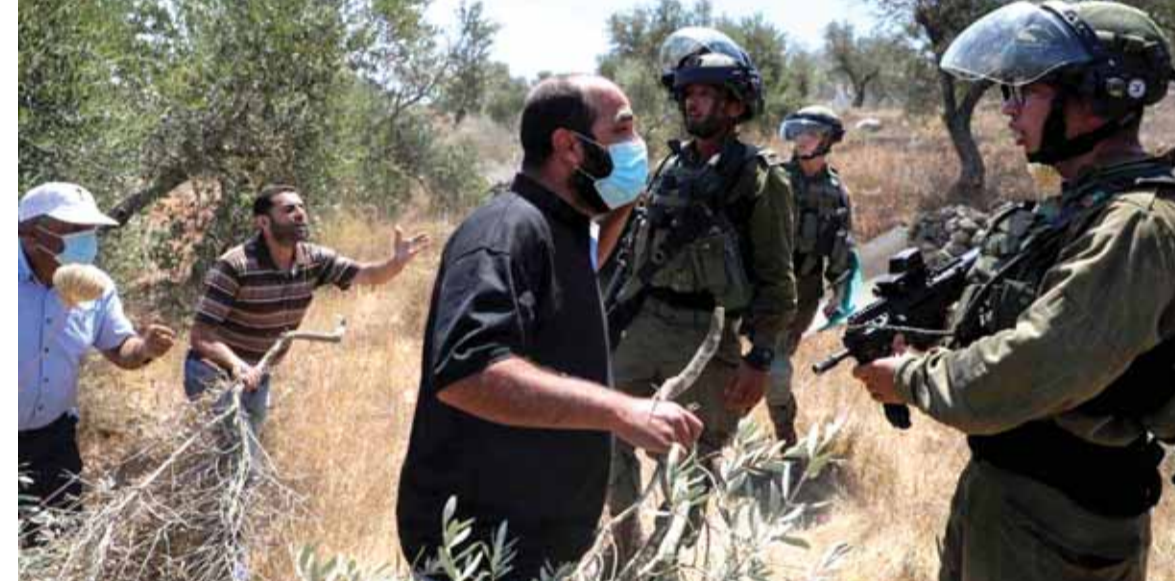
مواجهات مستمرة بين قوات الاحتلال والفلسطينيين

وتحدث عن تعثره في جهود التسوية بين الجانبين الفلسطيني و«الإسرائيلي»، وقال إن هذا الأمر يجب تجاوزه، مشيراً إلى أن بلاده ستواصل العمل على تعزيز فرص التوصل إلى سلام عادل وشامل.