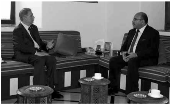
سفير الاردن عند الجميل

زار سفير الأردن في بيروت وليد الحديد الرئيس امين الجميل في مكتبه في «بيت المستقبل» في بكفيا وعرض معه العلاقات الثنائية.