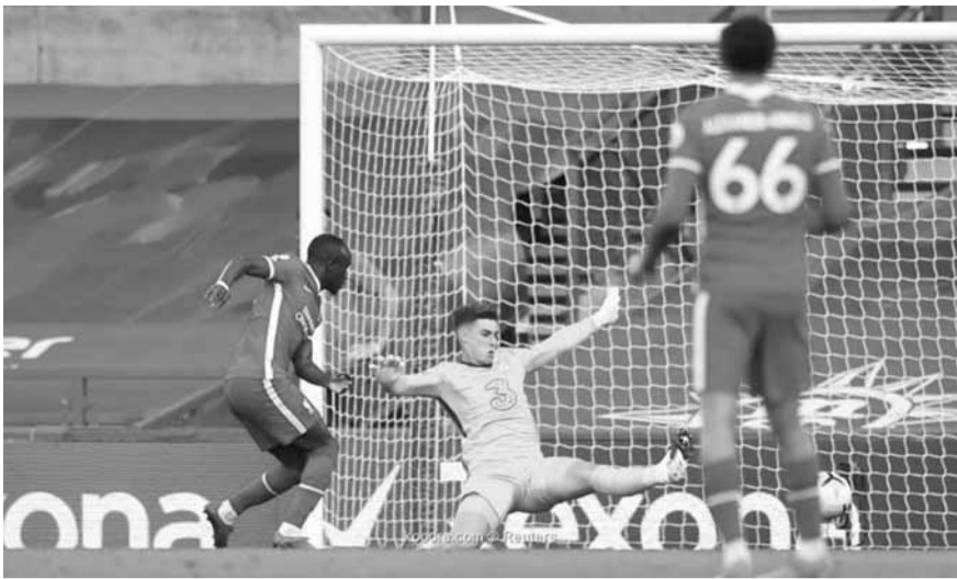
ماني يسجل هدف ليفربول الثاني في مرمى تشلسي

في الدقيقة ٧٧ بتسديدة قوية لم يستطع لويجي سيبسي حارس بارما التعامل معها. وأمط جنى شبك ضيفه كروتوني بأربعة أهداف مقابل واحد.