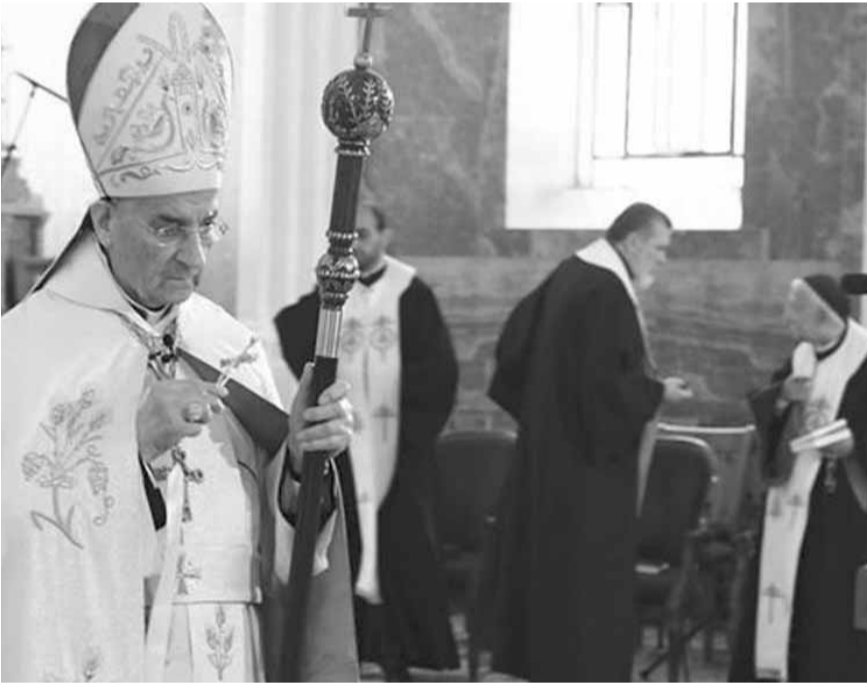
الراعي خلال القداس

بتنازلات على حساب الخصوصية اللبنانية والميثاق والديموقراطية. ولسنا مستعدين أن نبحث بتعديل النظام قبل أن تدخل كل المكونات في كنف الشرعية وتتخلى عن مشاريعها الخاصة. ولا تعديل في الدولة في ظل الولايات أو الجمهوريات بحسب تعبير فخامة رئيس الجمهورية. فاي فائدة من تعديل النظام في ظل هيمنة السلاح المتفقت غير الشرعي اكان يحمله لبنانيون أو غير لبنانيين. إن إعادة النظر في النظام اللبناني وتوزيع الصلاحيات والأدوار يتم إذا كان لا بد منه – بعد تثبيت حياض لبنان بأبعاده الثلاثة: بتحييده عن الأحلاف والنزاعات والحروب الإقليمية والدولية؛ بتمكن الدولة من ممارسة سيادتها على كامل أراضيها بقواتها المسلحة دون سواها، والدفاع عن نفسها بوجه كل اعتداء خارجي، ومن ممارسة سياستها الخارجية؛ بانصراف لبنان إلى القيام بدوره الخاص ورسالته في قلب الأسرة العربية، لجهة حقوق الشعوب، وأولها حقوق الشعب الفلسطيني وعودة اللاجئين والنازحين إلى أوطانهم، ولجهة التقارب والتلاقي والحوار والاستقرار».