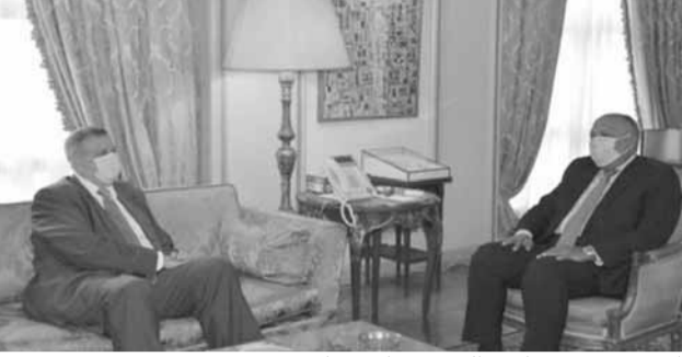
كوبيتش مجتمعاً مع الوزير سامح شكري

أكدت الخارجية المصرية موقف القاهرة الثابت من دعم أمن واستقرار لبنان، داعية إلى الثبات في مواجهة الصراعات الإقليمية، وذلك عبر الإسراع في تشكيل الحكومة اللبنانية الجديدة. وقال أحمد حافظ، المتحدث الرسمي باسم وزارة الخارجية المصرية، إن الوزير سامح شكري استقبل أمس الأحد، المنسق الخاص للأمم المتحدة في لبنان، يان كوبيتش، وبحث معه آخر المستجدات على الساحة اللبنانية، وسبل الاستمرار في دعم لبنان خلال المرحلة الحالية. وأضاف حافظ، أن وزير الخارجية المصري سامح شكري أكد خلال اللقاء موقف مصر الثابت من دعم أمن واستقرار لبنان، وأهمية مواصلة تقديم المساعدة والدعم اللازمين للمساهمة في تجاوز لبنان لأزمته الراهنة، معرباً عن الثقة في قدرة الشعب اللبناني على تخطي تلك المرحلة ومواجهة التحديات التي فرضها انفجار مرفأ بيروت، منوهاً في هذا الصدد بزيارته الأخيرة إلى بيروت لبحث سبل الإسهام في دعم المستقبل الذي يستحقه اللبنانيون، عبر الخروج من الأزمة الحالية.