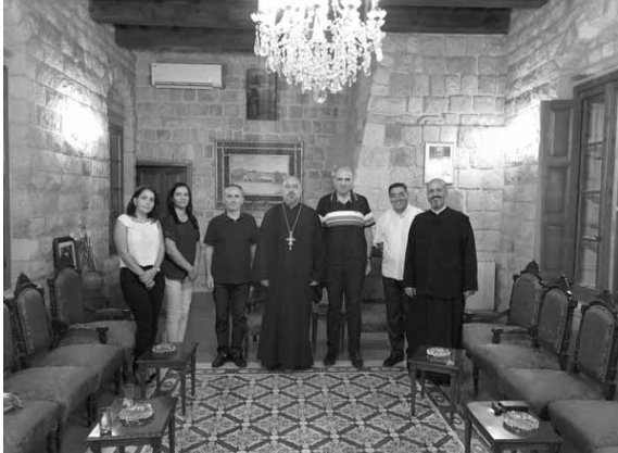
لحدود مع الرهبانية الباسيلية