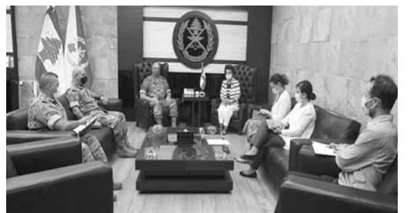
قائد الجيش مستقبلاً رشدي

استقبل قائد الجيش العماد جوزاف عون في مكتبه في البرزة، نائبة المنسق الخاص للأمم المتحدة في لبنان السيدة نجاة رشدي على رأس وفد مرافق، وتناول البحث المهام الإنسانية التي يقوم بها فريقها في المنطقة المتضررة من جراء الانفجار في مرفأ بيروت.