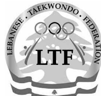
شعار الاتحاد اللبناني للتايكواندو

اللبناني للتايكواندو الدكتور حبيب ظريفه، الاعلان عن تفاصيل الحملة، اسئلة الصحافيين، حفل كوكتيل على شرف الحاضرين.