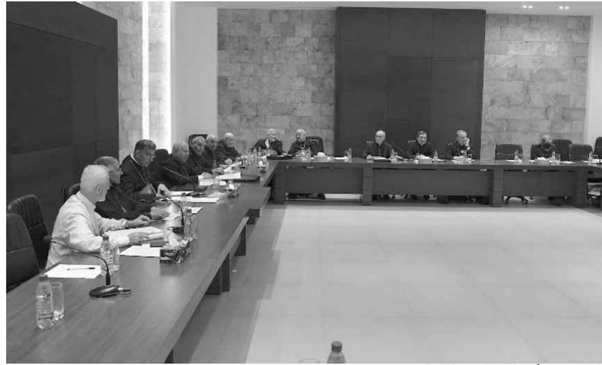
الراعي يترأس اجتماع المطارنة

أكد المطارنة الموارنة في اجتماعهم الشهري الذي عقد برئاسة البطريرك الماروني الكاردينال مار بشارة بطرس الراعي في الصرح البطريركي الصفي في الديمان، «أن الآباء ينتظرون من رئيس الحكومة المكلف الإسراع في تأليف حكومة ائقافية بعيدة عن الانتماءات الحزبية والسياسية مع ضرورة منحها صلاحيات استثنائية لازمة لتتمكن من القيام بالإصلاحات ومكافحة الفساد والنهوض الاقتصادي.»