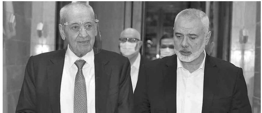
بري مستقبلاً هنية (حسن ابراهيم)

عن موقف لبناني فلسطيني مشترك يرفض كل المشاريع التي تستهدف تصفية القضية الفلسطينية وخاصة ان ثوابت القضية هي ثوابت واضحة وخطوط حمراً لا تنازل عنها، الأرض والقدس والدولة وحق العودة وحرية الاسرى والأسيرات في سجون الاحتلال الصهيوني. وأيضا أكدنا أن شعبنا الفلسطيني الذي يعيش في لبنان هو ضيف على لبنان ويرفض أي شكل من أشكال التواطؤ أو التهجير وان مخيماتنا في لبنان هي سنيق عنوان استقرار وعنوان أمن ولا يمكن ان نتدخل في الشأن اللبناني الداخلي».