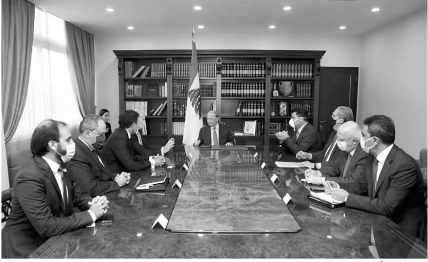
عون مع وفد سيمينز

وفي ختام زيارته، شدّد بحصلي على «ضرورة الإسراع في