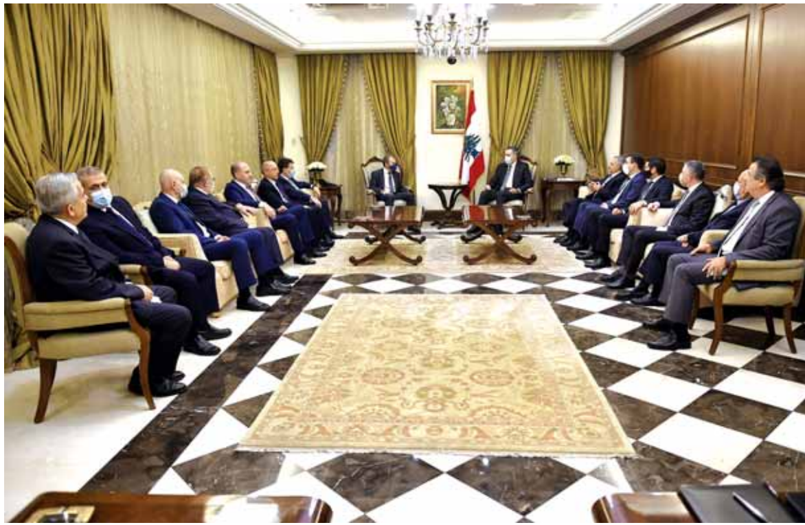
الرئيس المكلف يستقبل كتلة لبنان القوي

محمد بلوط بدأ العد العكسي لتأليف الحكومة الجديدة في ضوء شحنة الدفع القوية التي اعطاها الرئيس الفرنسي ايمانويل ماكرون لهذه العملية، واضعا امام اللبنانيين خارطة طريق للالتزام بها من اجل الانقاذ والخروج من الازمة والا سيكون هناك منحى اخر. وكشف مصدر مطلع لـ«الديار» امس ان ماكرون قبل مغادرته بيروت الى بغداد ابلاغ المسؤولين وقيادات لبنانية انه سيتابع تطورات تأليف الحكومة عن كثب في اطار المساعدة على ولادتها في اسرع وقت ممكن. واضاف المصدر ان هناك رغبة بل حاجة لتتطلق الحكومة الجديدة في عملها بعد اخذ الثقة قبل نهاية هذا الشهر على ان تباشر فوراً الاصلاحات المطلوبة على الصعيد الاقتصادي والمالي والمصرفي، بحيث تبدأ النتائج بالظهور اعتباراً من النصف الاول من تشرين الاول وتتعزيز وتبليغ تدريجياً. وصار معلوماً ان ماكرون اخذ وعوداً من القوى التي سمت السفير مصطفى ادب لرئاسة الحكومة بتسهيل تشكيل الحكومة بأقصى سرعة وبالتعامل مع هذه العملية بكل مسؤولية بعيداً عن المناورات والمحاصصات الضيقة. وسالت «الديار» امس احد هذه الاطراف عما اذا كان يتوقع تأليف الحكومة خلال اسبوعين فاجاب: عادة نحن