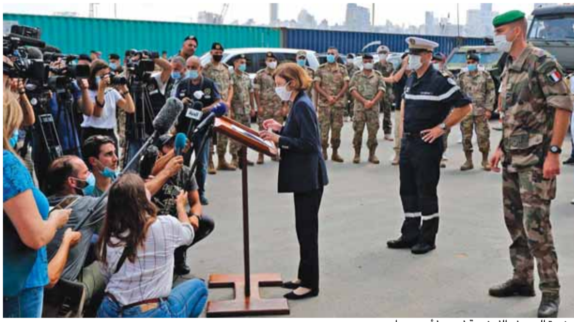
وزيرة الجيوش الفرنسية في مرفأ بيروت امس

ادارة التحرير هل يكون تاليف الحكومة بعيداً أم قريباً؟.. الجواب ان الرئيس ايمانويل ماكرون وزير خارجيته والسفير الفرنسي فتحوا خطوطهم الهاتفية مع كل الجهات من اجل تاليف الحكومة الجديدة على ان تكون سياسية مطعمة بتكورات واصحاب اختصاص خصوصا في مجال الكهرياء والمال والبيئية. سماحة السيد حسن نصرالله اعلن في خطابه ليل امس ان حزب الله هو مع حكومة وحدة وطنية ولها غطاء سياسي تكون فاعلة، وتقوم بالإصلاحات ومعالجة الملفات كلها بجدية وفاعلية. اما وكيل وزارة الخارجية الاميركية دايفد هيل فقال: لن نقبل بعد الان بالوعود الفارغة ولن ندعم الا حكومة تقوم بالإصلاح والتغيير السياسي وتمثل الشعب اللبناني. في وقت دخل على الخط رئيس تركيا رجب الطيب اردوغان وهاجم الرئيس الفرنسي ماكرون قائلاً انه يقوم بحملة استعمار جديدة مرفوضة من تركيا وان الرئيس ماكرون يريد انتداب لبنان كما انتدبته فرنسا