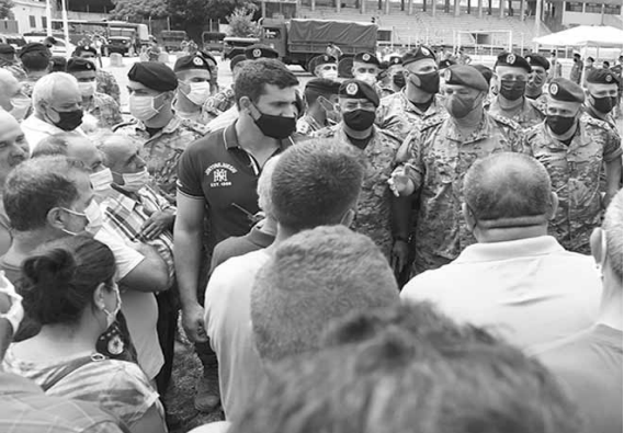
قائد الجيش يتفقد المستشفى الميداني المقدم من الاتحاد الأوروبي في المدينة الرياضية

تفقد قائد الجيش العماد جوزاف عون، قبل ظهر امس، المستشفيات الميدانية المقدمة من الاتحاد الروسي في المدينة الرياضية في بئر حسن ودولة قطر في باحة مستشفى الروم – الأشرافية، والمملكة المغربية في الكرتينا، والمملكة الأردنية الهاشمية في تل الزعتر. بداية الجولة في المدينة الرياضية حيث كان في استقبال العماد عون رئيس الفريق الطبي الروسي الذي أوضح أن فريقه يعمل بإشراف وزارة الصحة، وأن