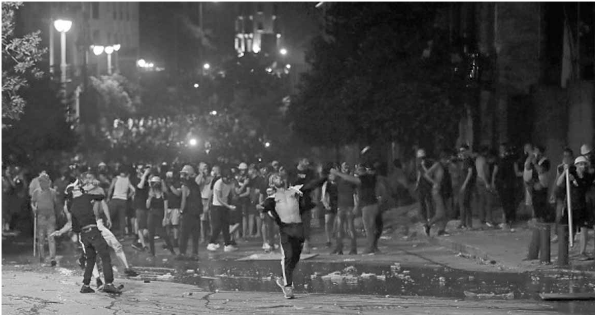
لاتخاذ القرار المناسب».

وكان وصل النائب شامل روكز عصر امس إلى ساحة الشهداء للانضمام إلى المتظاهرين. وأعلن أن موضوع الاستقالة من مجلس النواب ستمت «دراسته اليوم مع مجموعة من النواب