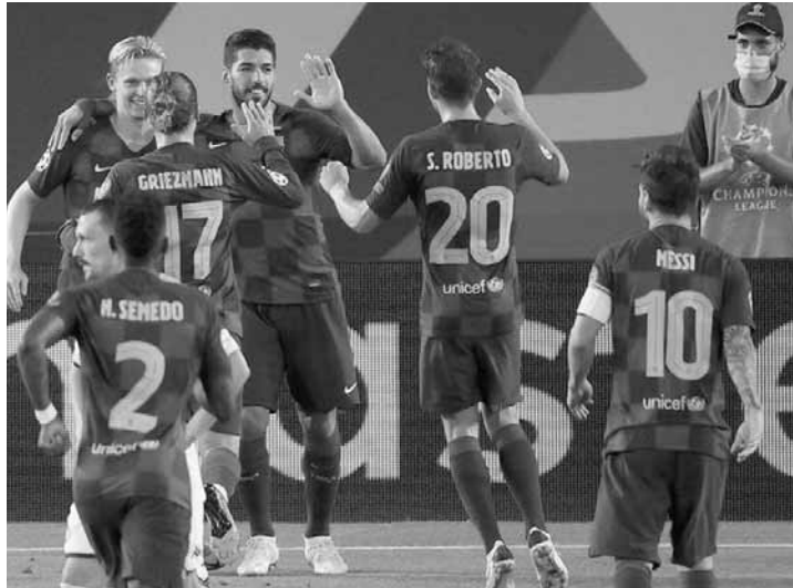
لويس سواريز يتلقى تهاني رفاقه بعد تسجيله هدف برشلونة الثالث

ليونيل ميسي، قائد برشلونة، مضيئاً «نحن بحاجة للحد من كافة اللاعبين».