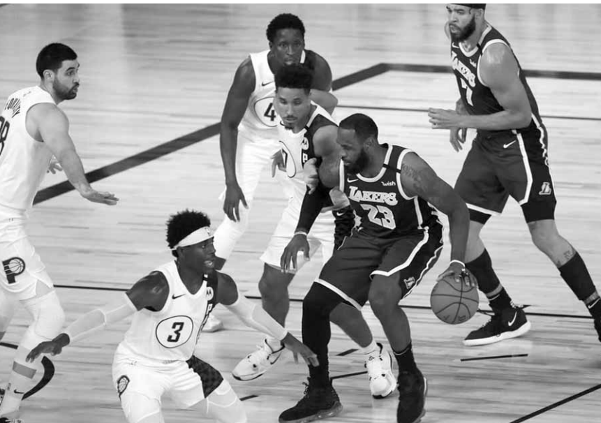
ليبرون جيمس من ليكرز بمراقبة أربعة لاعبين من انديانا

وقاد الصربي نيكولا يوكيتش دنفر ناغتس إلى الفوز على يوتا جاز ١٣٤-١٣٢ بعد وقتين إضافيتين بتسجيله ٣٠ نقطة و١١ متابعة.