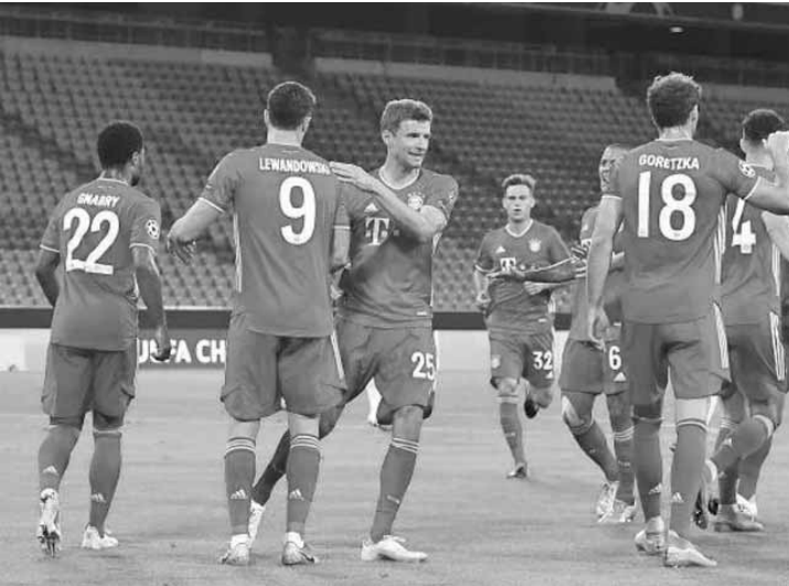
فرحة لاعبي بايرن ميونخ