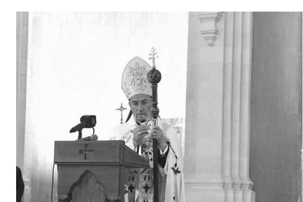
الراعي يترأس القداس

ووضعت الوزارات قدراتها في تصرف أي قطاع من أجل المساعدة، خصوصاً في ظل وباء «كورونا»، كما طرح المشاركون ضرورة اعتماد الشفافية واصدار تقارير عامة ودورية. وتم التأكيد على «أهمية تعزيز التنسيق بين غرفة عمليات الجيش، وخلية الأزمة في مجلس الوزراء والأقرقاء المعنيين المحليين والدوليين».