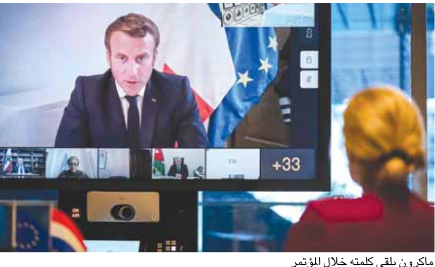
ماكرون يلقي كلمته خلال المؤتمر

على طريق الديار كانت الاجواء السياسية كلها مقلقة، وجاءت الحكومة وكانها يتيمة، مع العلم انها راغبة في إجراء تقدم في العمل التنفيذي واحداث تغييرات واجراء اصلاحات، إلا ان انفجار المرفأ في ٤ آب جاء ليطيح بكل شيء، نظراً لهول الكارثة مع تدمير أكثر من ٨ آلاف منزل وتشريد ٣٠٠ ألف نسمة. وبعد هذه الصدمة المفجعة، فاذا بالرئيس الفرنسي إيمانويل ماكرون في بيروت في زيارة لها مدلولاتها. ثم انعقد مؤتمر المانحين بدعوة فرنسية وكان ناجحاً. ورسم كلام البطريك الماروني الكاردينال مار بشارة بطرس الراعي في عظته امس خارطة طريق، كما استقال نواب ووزراء، وكل ذلك يمكن ان يصبغ باعطاء تنبؤات خيرية للبنانيين، سواء حصلت انتخابات نيابية مبكرة ام لا، او اذا استقالت الحكومة ام بقيت، لكن الجميع ادركوا وجوب التغيير وتحمل المسؤولية. المجتمع الدولي لن يتسامح مع المسؤولين في لبنان. واذا لم يتجاوب الحكام والسياسيين، فان فرنسا ستدعو مع واشنطن الى تجريد اربعة كل السياسيين في سويسرا واوروبا واميركا. وتجديد هذه الاموال يعني ان المجتمع الدولي وضع لبنان تحت ادارته، وجعل كل المسؤولين والطبقة السياسية تحت وصاية دولية. نحن لانريد وصاية دولية، نحن نريد تحمل المسؤوليات بشكل يتناسب مع غضب الشارع، وان الناس تريد انتهاء المأسي والفساد في الحكم الذي زاد عمره عن ٣٠ سنة وأكثر. «الديار»