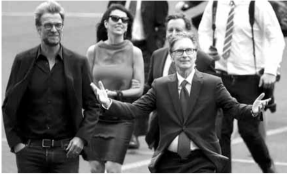
مالك ليفربول جيون هنري مع المدرب يورغن كلوب

بعد حوالي ١٠ سنوات من استحواذ مجموعة فينواي سبورتنس على ليفربول، قال مالك جيون هنري إنه لا يمكن أن يشعر بفخر أكبر من ذلك بعدما حصد لقب الدوري الإنكليزي الممتاز، لأول مرة في ٣٠ عاماً.