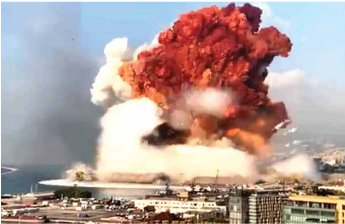
لحظة وقوع الانفجار

المجلس الأعلى للدفاع أعلن بيروت مدينة منكوبة وأعلن حال الطوارئ تعاطف دولي وعربي مع لبنان... دياب: ما حصل لن يمر دون حساب انفجار مواد كيميائية في العنبر ١٢ بمرقاً بيروت يسقط أكثر من ٧٠ شهيداً و٣٧٠٠٠ جريح واضراراً كبيرة