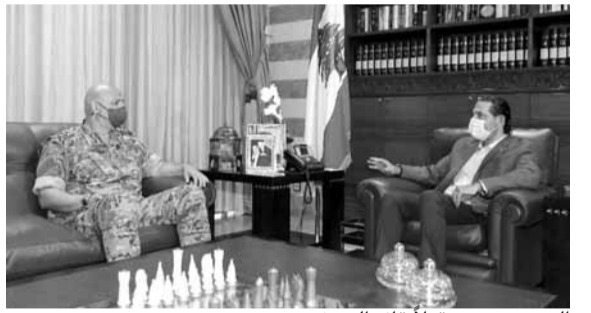
الحريري مستقبلاً قائد الجيش