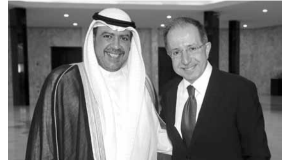
الشيخ أحمد الفهد الصباح جان همام

جان همام (رئيس اللجنة الأولمبية اللبنانية) البروفسور محمد بوش بوبالزاي (أمين عام اللجنة الأولمبية الإغانية) آزاب مورادوف (أمين عام اللجنة الأولمبية التركمنستانية) باتوشيف باتبولد (نائب رئيس اللجنة الأولمبية المغولية) أعضاء من مكتب المجلس الأولمبي الآسيوي - الكويت