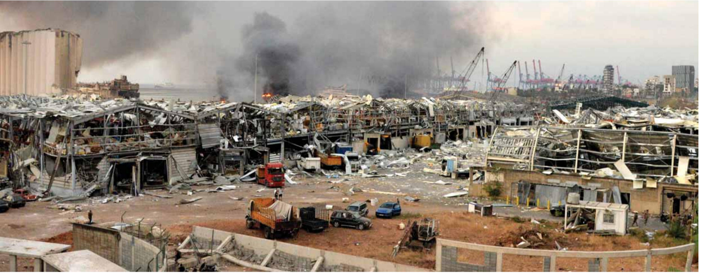
مرفأ بيروت مدمر بالكامل