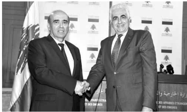
حتى وهبه خلال التسلم والتسليم

وإداريين، الى العاملين في البعثات اللبنانية في الخارج من دبلوماسيين وملحقين اقتصاديين وموظفين محليين بانتي ساكون العين الساهرة على آدابكم وإنتاجيتكم لكي نعمل سوياً على تفعيل عمل البعثات الدبلوماسية في الخارج، وعلى تخفيض النفقات وترشيدها والاستغناء عن كل ما هو غير ضروري وعلى تقوية المبادرات التجارية الخارجية وتقديم أفضل خدمة للبنانيين المنتشرين وتشجيعهم على الاستفادة من قانون استعادة الجنسية وتعميق الروابط التي تجمعهم بلبنان، وخصوصاً في هذه الظروف الصعبة التي يجتازها الوطن اقتصادياً ومالياً».