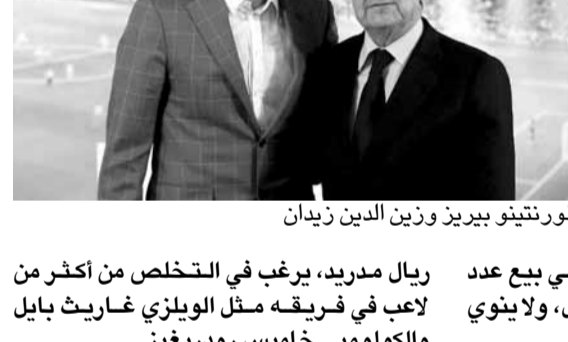
فلورنتينو بيريز وزين الدين زيدان

كشف تقرير صحفي إسباني، أمس الثلاثاء، عن مفاجأة بشأن خطة الميركاتو الصيفي لريال مدريد.