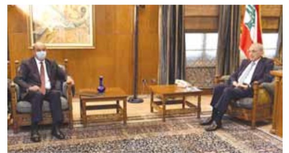
بري مجتمعاً مع سفير تركيا (حسن ابراهيم)

استقبل رئيس مجلس النواب نبيه بري في مقر الرئاسة الثانية في عين التينة سفير تركيا في لبنان هاكان تشاكيل حيث جرى بحث في الأوضاع العامة في لبنان والمنطقة والعلاقات الثنائية بين البلدين.