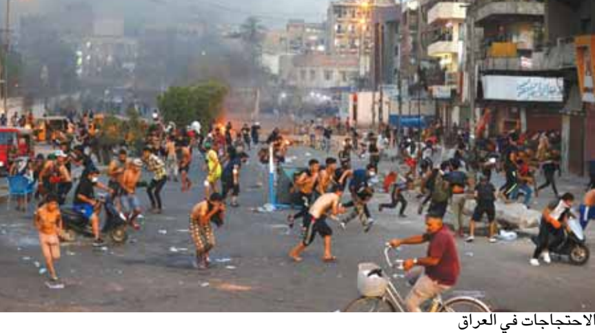
الاحتجاجات في العراق