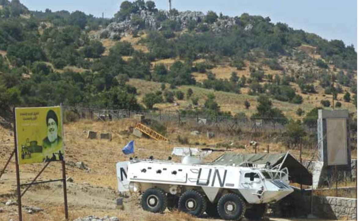
دورية لليونيفيل في محيط مزارع شبعا المحتلة

■ تباين بين موقف عون ودياب حول فرنسا في الشق السياسي، برز تمايز بين الرئيس حسان دياب والرئيس ميشال عون حيث انتقد دياب وزير