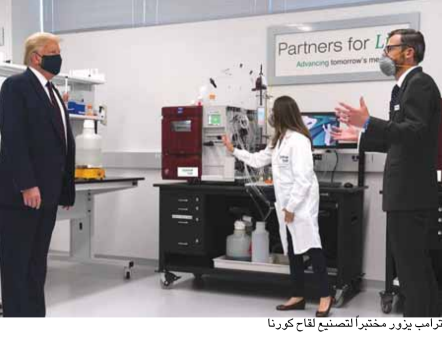
ترامب يزور مختبراً لتصنيع لقاح كورونا

حذرت منظمة الصحة العالمية من الاستكاثرة في مواجهة انتقال عدوى فيروس كورونا خلال الصيف في نصف الكرة الشمالي. وقالت المنظمة أمس الثلاثاء، إن هذا الفيروس ليس مثل الإنفلونزا التي تتبع عادة أنماط موسمية. وأوضحت مارغريت هاريس، المتحدثة باسم المنظمة، في إفادة صحفية عبر الإنترنت من جنيف: «الناس لا تزال تفكر في مسألة الموسم. ما ينبغي أن نفهمه جميعاً أن هذا فيروس جديد، وسلوك هذا الفيروس مختلف».