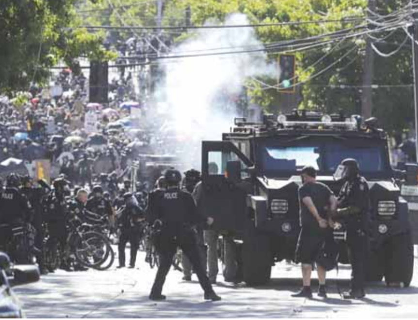
المواجهات في سياتل

في ولايتي واشنطن وسياتل الأميركيين رفضاً للتمييز العنصري، والتي انطلقت بعد مقتل الأميركي الأفريقي جورج فلويد على يد رجل شرطة في أواخر أيار. وتجمّع الآلاف للمتظاهرين في حي «كابيتول هيل» في العاصمة، للاحتجاج على وحشية الشرطة وإظهار التضامن مع المحتجين في بورتلاند، حيث استخدم العملاء الفيدراليون الذين أرسلهم الرئيس دونالد ترامب أساليب عنوانية للسيطرة على الحشود.