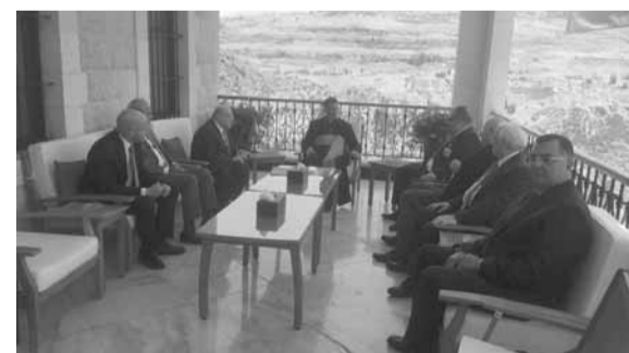
الراعي مجتمعاً مع أبي نصر والوفد المرافق

استقبل البطيرك الماروني الكاردينال مار بشارة بطرس الراعي، في الصرح البطيركي في الديمان، وقدما من المجلس التنفيذي للرابطة المارونية برئاسة النائب السابق نعمة الله الهادي نصر، الذي لقي كلمة أكد فيها «أن الرابطة كعادتها في كل عام تزور الصرح لتستشير بارشادات ومواقف البطيرك الوطنية».