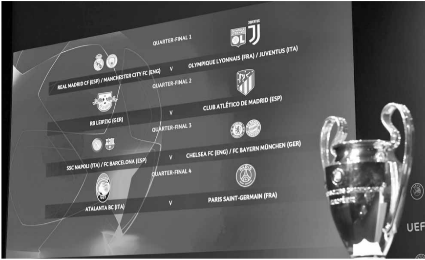
القرعة الجديدة لدوري أبطال أوروبا

المنتصر من مباراة غلاسكو رينجرز وباير ليفركوزن، ما يمهّد لمعركة إيطالية ألمانية منقذرة في ربع النهائي. أما عن المباراتين المتبقيتين في ربع النهائي، فيواجه الفائز من لقاء فولفسبورغ وشاختر، والفائز من مباراة فرانكفورت وبازل، فيما يلتقي المنتصر من مباراة أولمبياكوس ولوفرهامبتون، مغنيله من لقاء إسبيلية وروما.