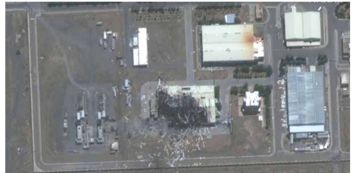
صورة جوية لمنشأة «نطنز»

أعلنت إيران أنه إذا ثبت تورط عناصر خارجية في انفجار منشأة «نطنز» النووية، فستكون لذلك تبعات، وسوف يعلن عن سبب الانفجار بعد استكمال التحقيق.