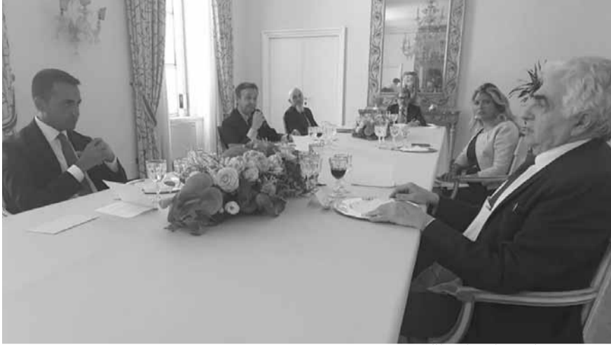
حتى مجتمعاً مع نظيره الإيطالي