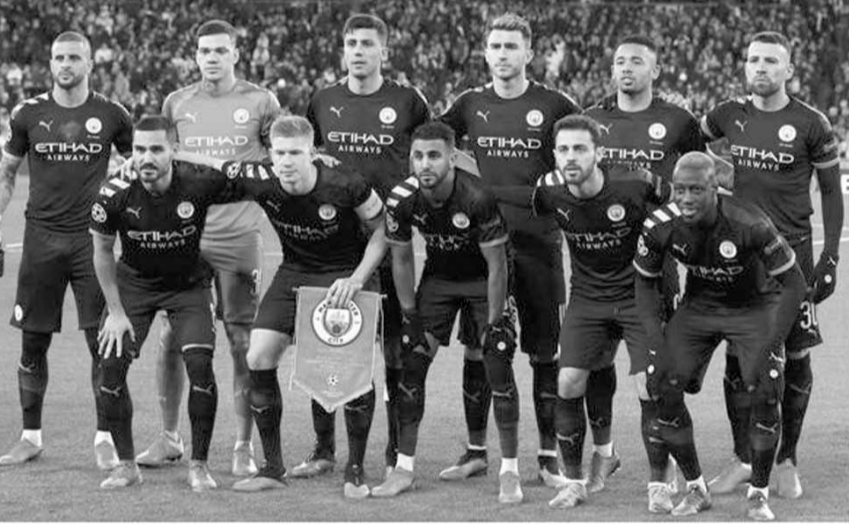
فريق مانشستر سيتي