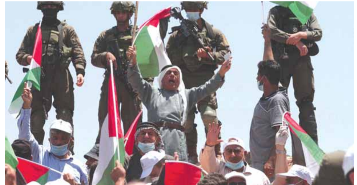
احتجاجات على قرار الضم امس

الدولي وسيقوض إمكان تحقيق حل على أساس دولتين من شأنه إحلال سلام دائم بين الإسرائيليين والفلسطينيين». وكان وزراء خارجية فرنسا وألمانيا ومصر والأردن قد حضوا «إسرائيل» على التخلي عن خططها ضم أجزاء من الضفة الغربية المحتلة.