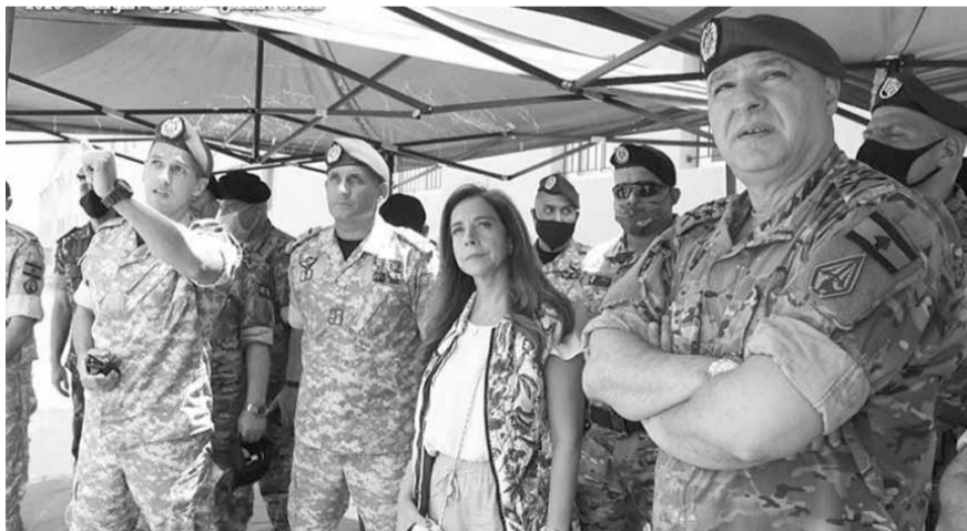
عكر وقائد الجيش خلال جولتهما التقديرية

وقالت عكر: «إن الجيش هو الضمانة والحامي للبنان، بقوة كل قواه، ولنستعمل دوماً على الحفاظ على الأمن والاستقرار، وبسطة سلطة الدولة وسيادتها على كل أراضيها والتصدى لكل من يحاول النيل من المؤسسة العسكرية أو من معنويات عناصر الجيش»، مضيفة «قراراتنا