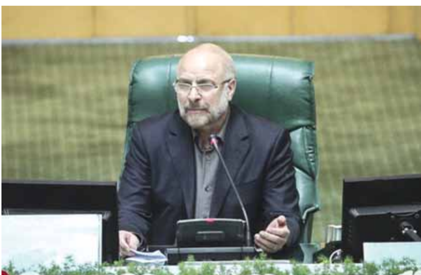
رئيس البرلمان الإيراني الجديد