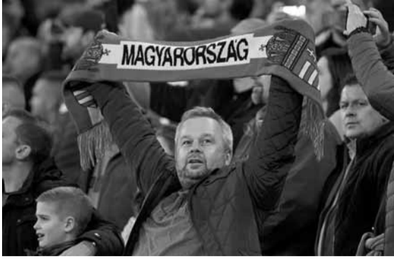
عودة الجماهير المجرية إلى المدرجات

وإجازات الحكومة البولندية فتحت المدرجات نسبياً أمام المشجعين اعتباراً من ١٩ حزيران، موضحة أن عدهم الإصفي سيكون ما نسبته ٢٥ بالمئة من الطاقة الاستيعابية للمدرجات، مقابل ١٠ بالمئة سمحت بها السلطات الروسية لدى استئناف الدوري اعتباراً من ٢١ حزيران. لكن البطولات الكبرى، مثل ألمانيا التي عاودت المنافسات في ١٦ أيار، وإيطاليا وإنكلترا وإسبانيا