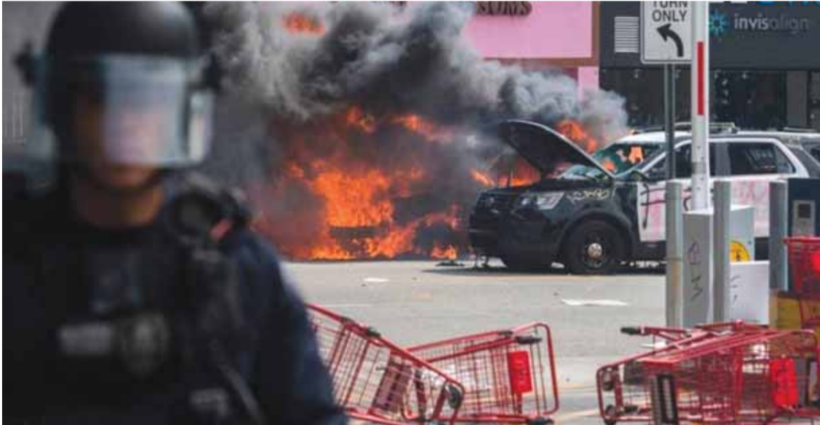
فلويد، و«وقفوا قتلنا» و«من التالي الذي سيحطم عنقه».