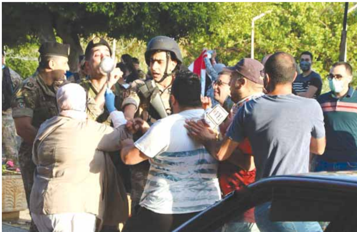
تدافع بين المتظاهرين والجيش على طريق قصر بعبدا

تتعرض الحكومة اللبنانية الى الضغط من كل حذب وصوب، فإلى جانب المشاكل التي تعاني منها منذ ما قبل ولادتها، يبدو أن الأطراف المشاركة فيها لن ترحمها أيضاً، فالابتزاز أصبح سمة الحياة السياسية اللبنانية، الأمر الذي قد يؤدي في نهاية المطاف الى تصدع الركائز التي قامت عليها الحكومة، وعند تصدع الركائز يصبح الانهيار سهلاً.