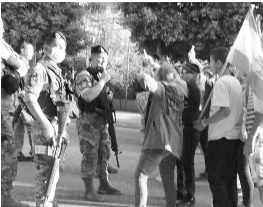
تحرك عند مفرق القصر الجمهوري

تجمع ععدد من المتظاهرين عصر أمس، عند مفرق القصر الجمهوري، هي المرة الأولى التي يصل فيها متظاهرون نقطة قريبة من القصر، على وقع الأغاني الوطنية.