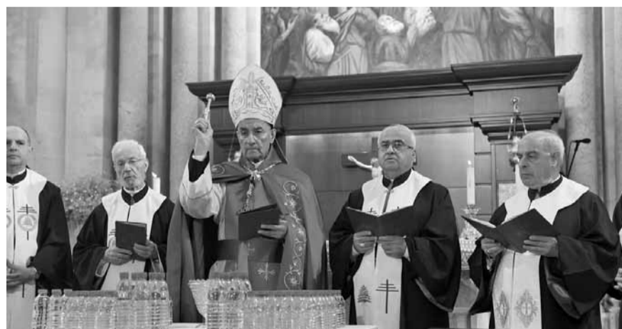
الراعي يترأس القديس

ترأس البطريرك الماروني الكاردينال مار بشارة بطرس الراعي، قداس عيد العنصرة في كنيسة السيدة في الصرح البطريركي، في بركي، بمشاركة لفيف من المطارنة والكهنة.