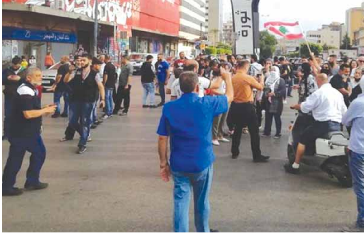
تجمع للمظاهرين في طرابلس

أرسلان، وقال في تغريدة: «أؤيد كلام طلال أرسلان بالكامل حول الشرطة القضائية ويبدو أن بعض الوزراء مش قابضين حائلن ومعودين يكونوا مأمورين.. وهذا الأمر قد يدمر الحكومة لأنها بحاجة لعمل وليس لكلام فقط».