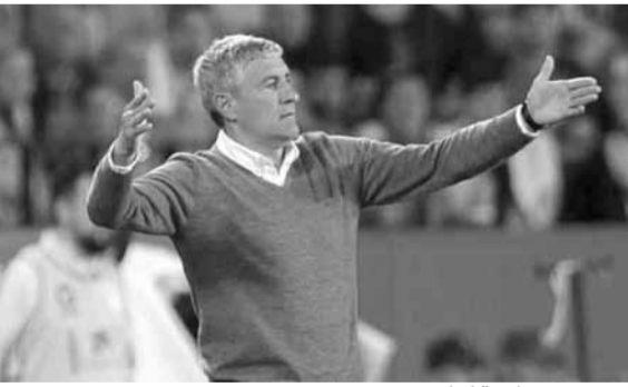
مدرب برشلونة كيكي سيتين

مع الحفاظ على إجراءات الوقاية الصحية. وسيعني ذلك أن الفرق ستحتفظ بأقل من أسبوعين لخوض التمارين الكاملة، وهي فترة يراها المدربون قصيرة نسبياً لبلوغ اللاعبين كامل جاهزيتهم البدنية للعودة إلى المنافسات. وأوضح سيتين «كنا نرغب في الحصول على المزيد من الوقت للعمل مع المجموعة ككل، لكن علينا أن نقوم بذلك بشكل مكثف في نحو أسبوعين. لم نتمكن حتى من الجلوس معاً في قاعة واحدة لمتابعة أشرطة الفيديو».