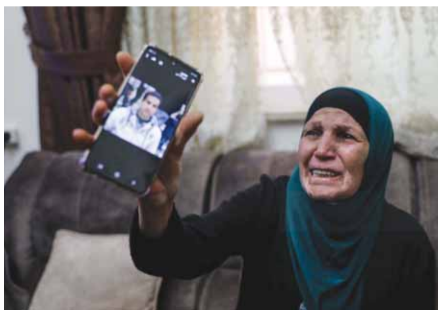
الوادة الشهيد تحمل صورته

اعلن الاحتلال الإسرائيلي عن قتله فلسطيني من سكان القدس الشرقية بذريعة أنه كان يحمل «جسماً مشبوهاً» ولم يخضع لأوامرها بالتوقف.