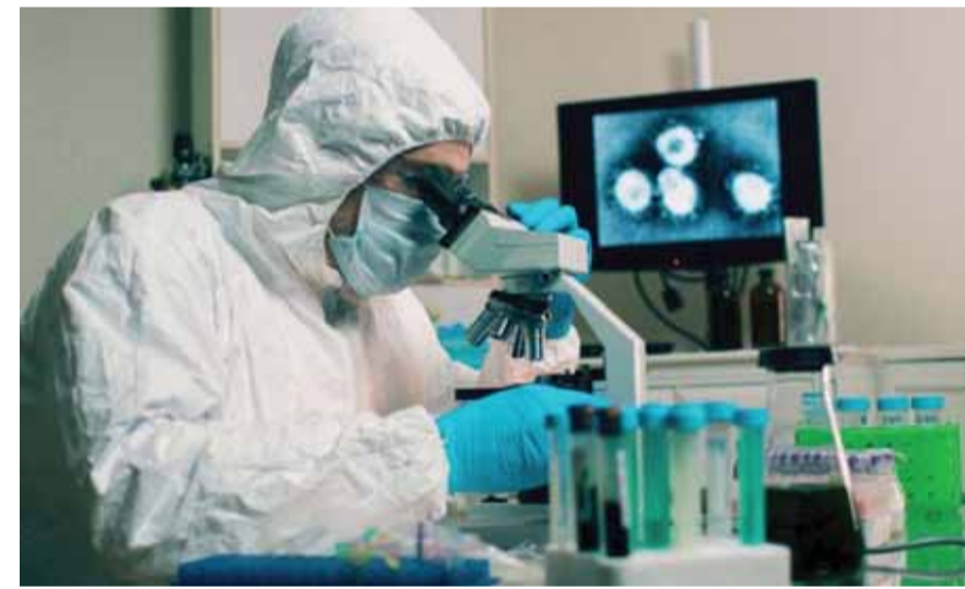
هل يبصر اللقاح النور قريباً؟

ذكرت لجنة مراقبة وإدارة الأصول المملوكة للدولة بالصين أن لقاحاً صينياً للوقاية من كورونا سيكون جاهزاً نهاية العام، فيما أعطى عقار أناكينرا المخصص لأمراض الروماتيزم نتائج «مشجعة» لعلاج الحالات الحادة من فيروس كورونا (كوفيد-١٩). وأشارت اللجنة على مواقع التواصل الاجتماعي إلى أن أكثر من ألفي شخص