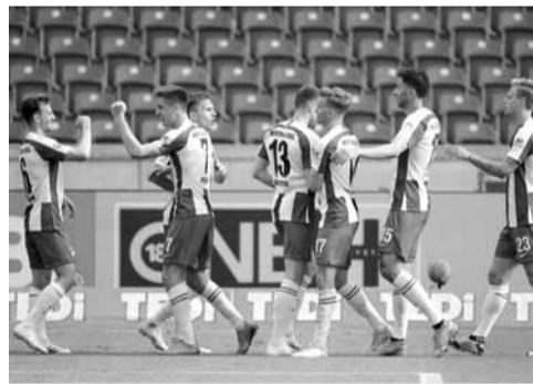
فرحة لاعبي هرتا برلين