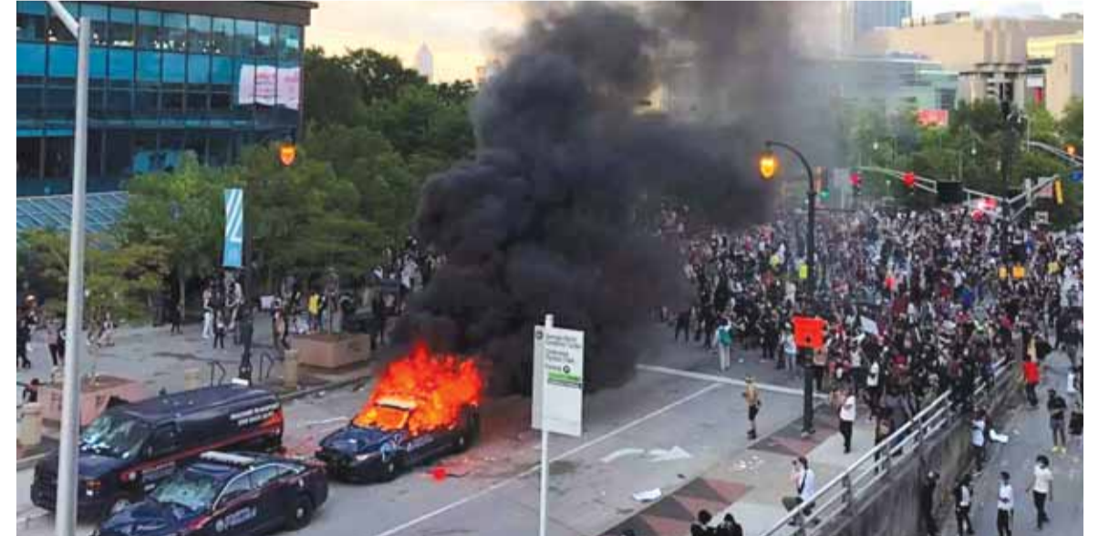
تطعيم وأشغال النيران بأليات الشرطة

قالت وسائل إعلام أميركية إن الرئيس دونالد ترامب أوعز للشرطة العسكرية بالاستعداد للانتشار في مدينة مينيابوليس بولاية مينيسوتا في حال تدهورت الأوضاع الأمنية، في حين اتهمت منظمة العفو الدولية ترامب بالعنصرية. وأمر البنتاغون وحدات الشرطة العسكرية في قاعدتي