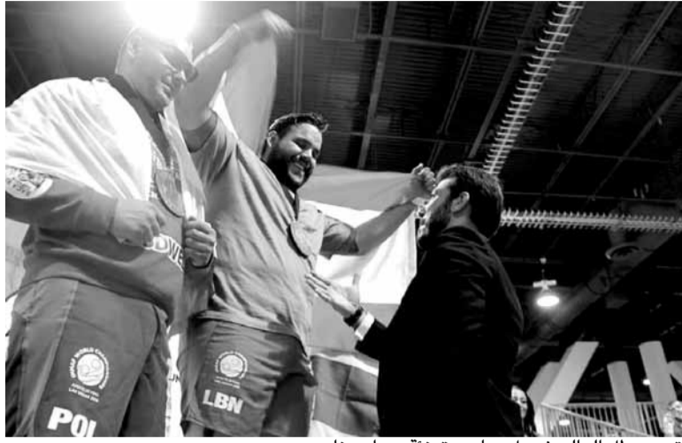
توزيع بطل العالم شربل دياب وتهنئة من أبي نادر