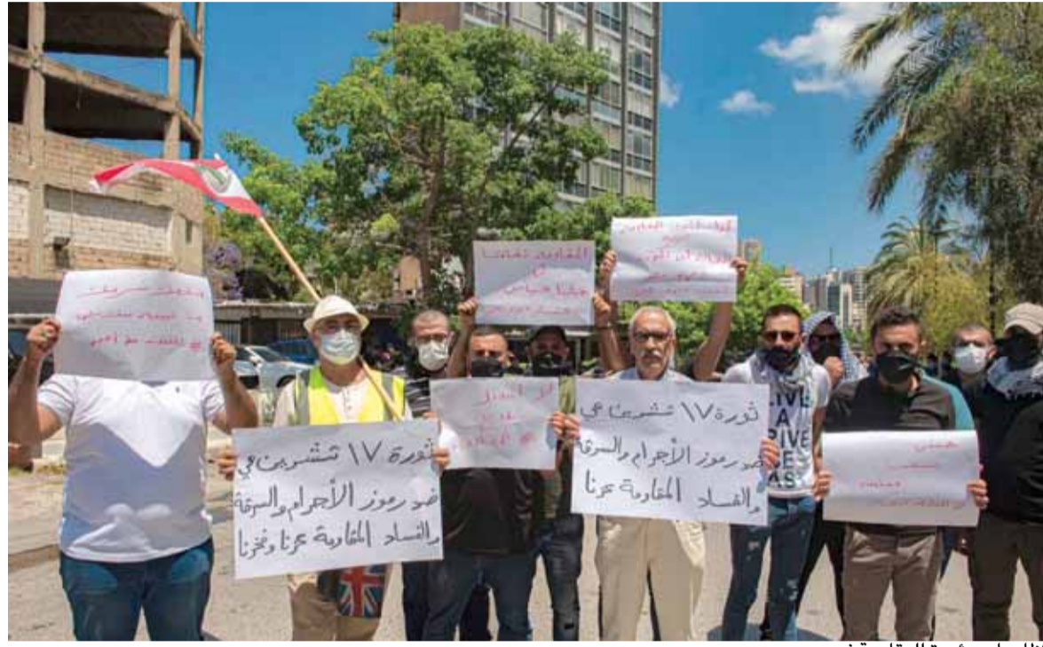
تظاهرات مؤيدة للمقاومة في بيروت

في تحرك مشبوه وخارج عن ثورة ١٧ تشرين الاول، واستحضاراً للقرار ١٥٥٩ و١٦٨ و١٧٠١ والمطالبة بتجريد سلاح «حزب الله» وتحمله المسؤولية عن تردّي الأوضاع الاقتصادية والمالية والعقوبات الاميركية على لبنان وأزمة الدولار والغلاء، نفذت مجموعة من الناشطين وقفة احتجاجية أمام قصر العدل في بيروت تحت عنوان: