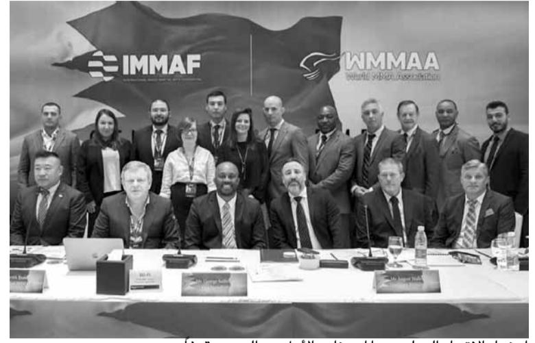
أعضاء الاتحاد الدولي ويدا أبي نادر الأول من اليمين وقوفاً

عناصر كفاءة ليعود النشاط الرسمي الى اللعبة بصورة علمية وليس ممارسة اللعبة تحت جنح النظام».