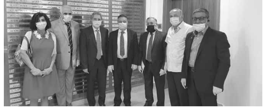
وفد النقابة عند وزني

التقى وزير المال غازي وزني مجلس نقابة محرري الصحافة اللبنانية برئاسة النقيب جوزيف القصبيني، وتم البحث في هموم الصحافيين والأسرة الإعلامية بشكل عام. وتمنى المجلس على وزير المال صبراً والعائدات المتأخرة للنقابة، وذلك لوفاء بالمتطلبات النقابية. ووعده وزني بمعالجة هذا الموضوع في أسرع وقت ممكن. وشدد خلال اللقاء على