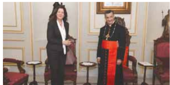
الراعي مستقبلاً شيا

استقبل البطريك الماروني الكاردينال مار بشارة بطرس الراعي، قبل ظهر امس في بركي، السفارة الأميركية دوروثي شيا بعد استلامها مهامها الجديدة في لبنان، وجرى عرض للأوضاع الراهنة التي يمر بها لبنان والمنطقة.