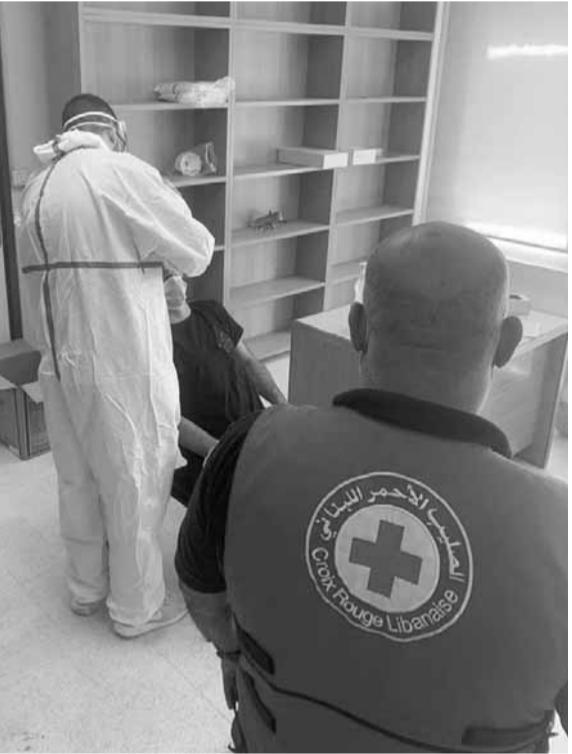
فحوص PCR من وزارة عدل – زحلة

لم يعد مسار تطوّر وباء «كورونا»، واضح المعالم مع تارجح عدد الإصابات اليومية بين معدلات متفاوتة من دون أن يكون عدد الفحوص المخبرية معياراً يساهم في تفسيرها، إلا أن الواضح أن العدد مرتفع مقارنة مع ما شهدناه قبل قرار فتح القطاعات. وسجّلت خلال الـ ٢٤ ساعة الأخيرة ٢١ حالة من أصل ١٦٧٥ فحصاً، ١٦ منها للمقيمين و٥ للوافدين، الأمر الذي يرفع العدد التراكمي إلى ١١٦١ إصابة.