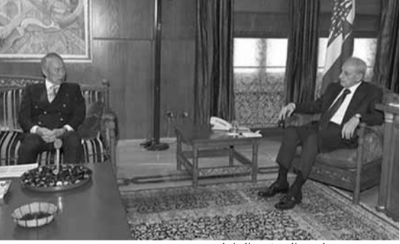
بري مجتمعاً مع السفير الياباني

كذلك، تلقى الرئيس بري رسالة شكر من الوزير المفوض رئيس البعثة الدبلوماسية لجمهورية باراغواي أوسفالدو ادب بيطار، شكره فيها على المساعدات التي قدمها المركز التربوي اللبناني في الباراغواي من خلال تقديم مساعدات عينية للعائلات الفقيرة في مدينة سيوداد ديل استي لواجهة جائحة كورونا.