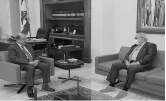
عون مستقبلاً ماريو عون

وأكد النائب عون أن رئيس الجمهورية يولي الشق الإنمائي لمنطقة الجبل اهتماماً لاسيما المشاريع الحيوية التي تؤمن الإنماء اللازم. والتقى الرئيس عون النائب سيمون أبي رميا، وعرض معه حاجات منطقة جبيل ساحلاً ووسطاً وجبالاً وعدداً من المسائل المطروحة على الساحة الجبيلية إضافة إلى مواضيع عامة، أبرزها الاعتداءات التي حصلت على بعض المزارعين في منطقة لاسا. وقال أبي رميا: «تتابع هذا الملف مع الجهات الروحية والسياسية المعنية به لمعالجته بشكل نهائي، وعلى القضاء والأجهزة الأمنية التحرك لتوقيف المعتدين كي لا تكرر مثل هذه الحوادث».