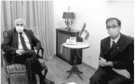
حتى مستقبلاً فوشيه

استقبل وزير الخارجية والمغتربين ناصيف حتي سفير فرنسا لدى لبنان برونو فوشيه، وتم البحث في تطورات مؤتمر سيدر وكيفية تطبيقه بالإضافة إلى تجديد ولاية قوة الطوارئ الدولية العاملة في جنوب لبنان (اليونيفيل). ثم استقبل الوزير حتي سفير مصر لدى لبنان ياسر علوي، وبحث معه في العلاقات الثنائية بين البلدين.