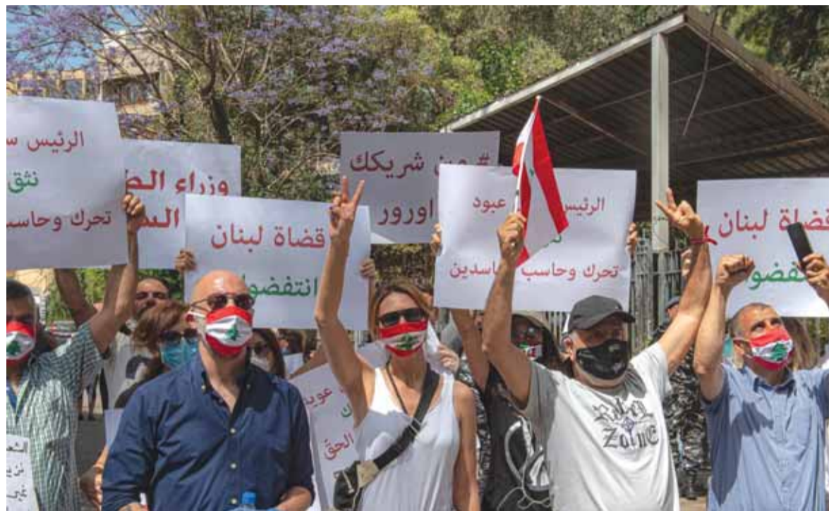
اعتصامات امام قصر العدل في بيروت للمطالبة بحاسبة الفاسدين