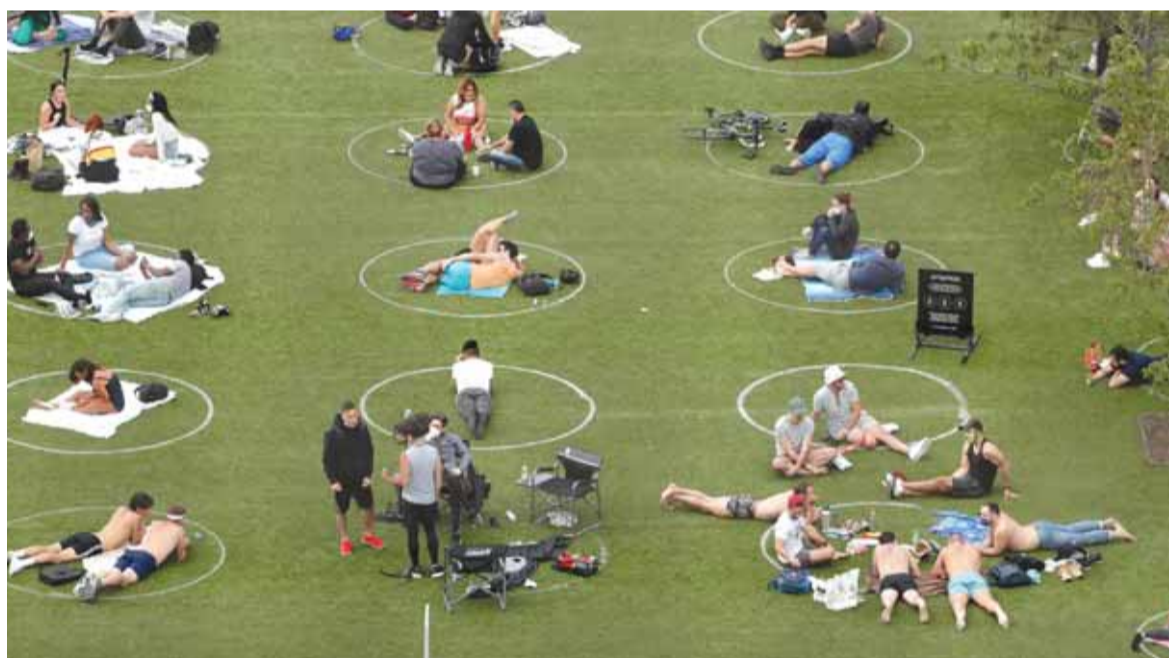
اجراءات اوروبية بهدف التباعد الاجتماعي

على الرغم من استمرار تسجيل معدلات كبيرة من الإصابات والوفيات، قررت العديد من الدول الأوروبية استئناف عمل القطاعات الاقتصادية مجددا، وإعادة الحياة تدريجيا إلى طبيعتها.