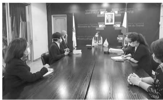
يمين مستقبلة القائم بأعمال سفارة الفلبين وبنغلادش

لبنان والدول التي لديها عمال لأنها تساهم في تطوير العلاقات وحل الكثير من المشاكل وتضمن حماية حقوق العمال»، طالبة من ممثلي السفارتين «ضرورة اعلام الوزارة بأي اجراءات او معلومات تصدر عنهما بهذا الخصوص».