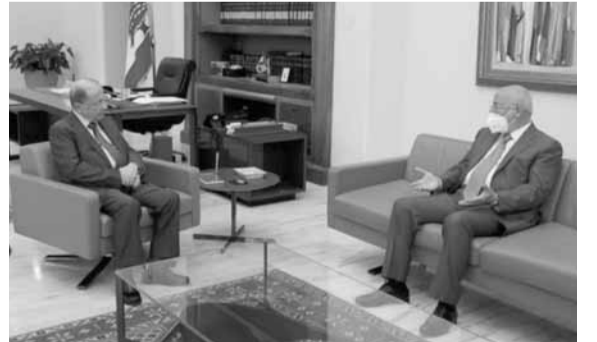
عون مجتمعاً مع العريضي

استقبل رئيس الجمهورية العماد ميشال عون قبل ظهر أمس في قصر بعبدا، النائب والوزير السابق غازي العريضي موفداً من رئيس الحزب التقدمي الاشتراكي النائب والوزير السابق وليد جنبلاط. وتم في خلال اللقاء عرض الأوضاع العامة في البلاد والتطورات الاخيرة، كما استكمل البحث في عدد من النقاط التي اثيرت خلال لقاء الرئيس عون بجنبلاط قبل أيام.