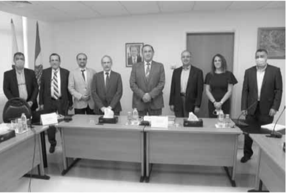
حب الله في معهد البحوث

أشاد وزير الصناعة عماد حب الله بمعهد البحوث الصناعية، ادارة وكوادر، وهنأهم على اداثهم وجهوزيتهم واستمرارية عملهم خدمة للاقتصاد والصناعة والقطاعات الاخرى، من دون انقطاع طوال الفترة الماضية التي سجلت اقفالا للمؤسسات». وقال الوزير حب الله خلال ترؤسه مجلس ادارة المعهد: «يشكل معهد البحوث الصناعية أحد أبرز المؤسسات الناجحة والمهمة والمنجحة والجديرة على المستوى الاقتصادي والعلمي والتفقيزي، ونحن اليوم في دينامية جديدة على صعيد دعم الصناعة وتطويرها من خلال الرؤية المستقبلية لتطوير الصناعة التي أعلنها. والمعهد قادر على ان يواكب هذه الدينامية وهذا التوجه والمسار الجديد عبر التفاعل أكثر وأكثر مع القطاع الاقتصادي ولا سيما الصناعي منه».