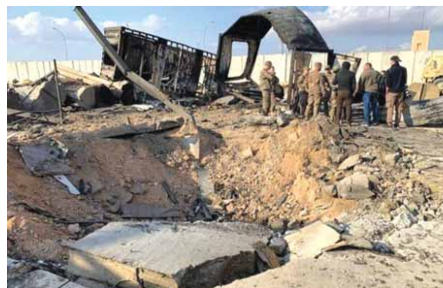
قواعد اميركية في العراق

تحذرت المرشد الأعلى للثورة الإيرانية، السيد علي خامنئي، عن طرد القوات الأميركية من سوريا والعراق، ردا على «إشغال الولايات المتحدة للحروب ودعمها للإرهاب والظلم». وقال السيد خامنئي خلال اجتماع مع طلاب جامعيين عبر الفيديو، إن «سلوك أميركا طويل الأمد، وإشغالها للحروب، ومساندتها للحكومات سيئة السمعة، وتنميتها للإرهاب، ودعمها