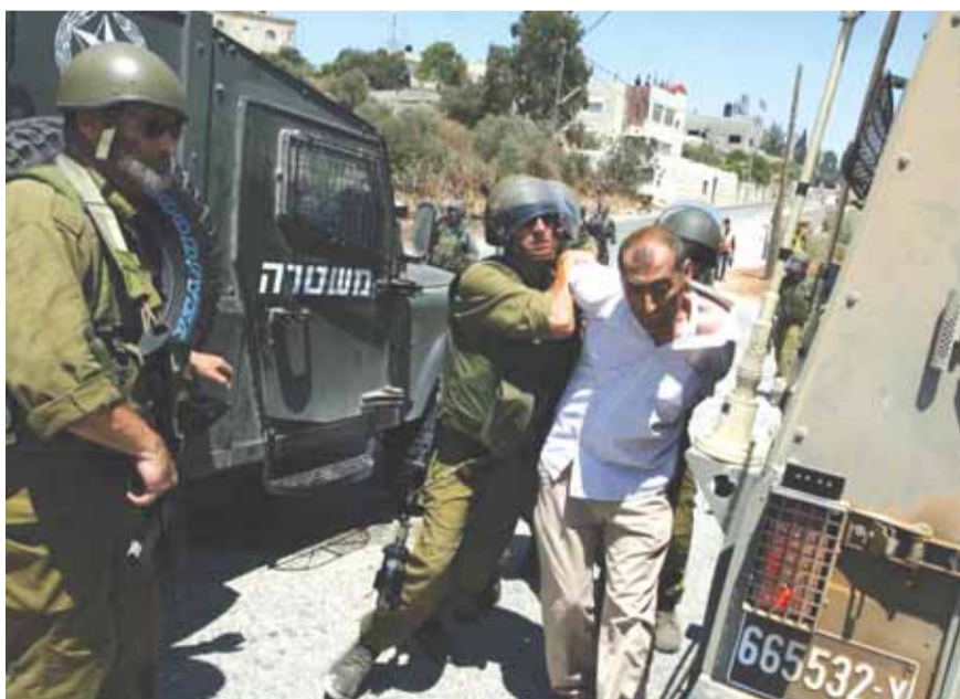
استمرار الاعتقالات في الضفة