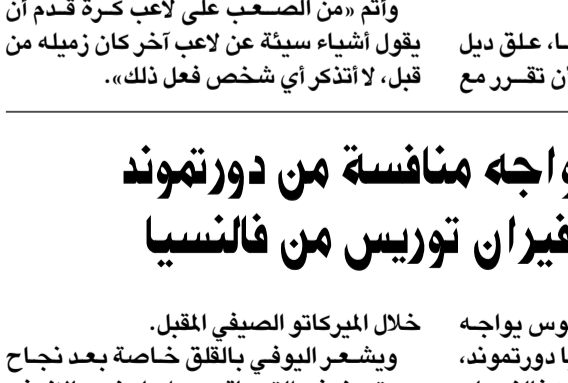
فيستني دل بوسكي

من تتعاقد، لا يجب أن نتخذه لما يقوله اللاعبون، لأن هناك بالفعل مدير رياضي وسكرتير فني».