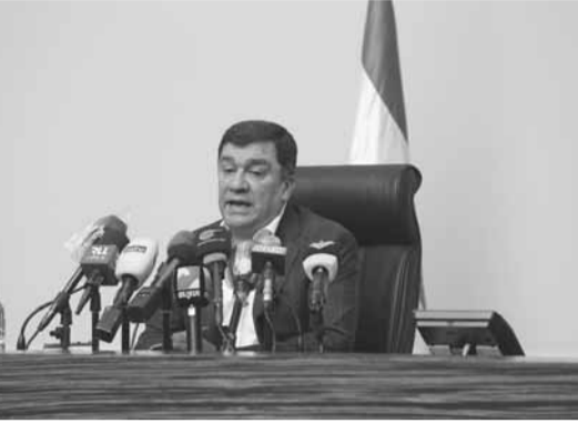
الحوت في مؤتمره الصحفي

الدولة اللبنانية فقط لأهداف تتعلق بالحملات المشبوهة لمحاولة وضع اليد على إدارة الشركة او لمطلب من هنا او من هناك، لذا نقول للجميع: رجاء عند تصفية حساباتكم وطالما نحن موجودون في الشركة وطالما هناك مجلس إدارة متمسك بمصرف لبنان مساهم في هذه الشركة لن نغير نهجنا في إدارة الشركة وسنستمر بنفس النهج الذي قمنا به خلال عشرين سنة والذي أدى في اصعب الظروف التي مر بها لبنان ان تستمر الشركة بتحقيق الأرباح ولينذكر الجميع بان الشركة كانت تعاني من خسائر تقدر ب ٧٥٠ مليون دولار، وانه بفضل الخطة الإصلاحية التي اقرها مجلس الإدارة حققنا ارباحا على ١٨ عاما بمليار وثلاثمائة مليون دولار، وان هذا الريح تحقق في اصعب الظروف وخلال الاجتياح الإسرائيلي للبنان في عام ٢٠٠٦ الذي أدى حينها الى خسائر للشركة بلغت ٣٥ مليون دولار ومع ذلك حققنا في نهاية ذلك العام ارباحا وان شركة طيران «عال» الإسرائيلية تكبدت خسائر».