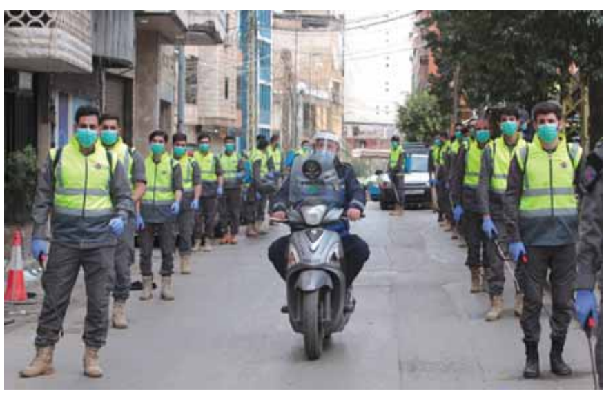
الهيئة الصحية التابعة لحزب الله

نشر موقع «إسرائيل ديفينس» مقالاً لعمامي روكس دومبا حيث نقل عن مركز مثير عميت لمعلومات الاستخبارات والإرهاب» إن لدى حزب الله خطة لمواجهة فيروس كورونا، «فالبنية التحتية التي بنيت على مر السنين بمساعدة إيرانية تضع حزب الله كجهاز رائد في القدرات اللوجستية ضد الكورونا في كل لبنان»، بحسب تعبيره. ويضيف أنه «بحسب معطيات وزارة الصحة اللبنانية (بغاية ٣٠/٠٣/٢٠٢٠)، توجد في لبنان ٤٤٦ حالة إصابة بالكورونا، أول حالتين كانتا لامرأتين عادتا من رحلة من إيران لسبعين والدة شهيد من حزب الله. من بين الحالات كان هناك ١١ وفاة. ووسط التجمعات السكانية الشيعية في لبنان، كان حجم الإصابات منخفضاً نسبياً، ومن الممكن