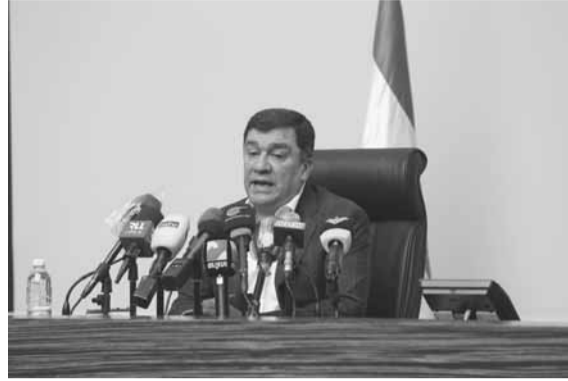
الحوت في مؤتمره الصحفي

الحوت: الميديل ايست شركة تجارية وليست ملك الدولة ومصرف لبنان يملك ٩٩% من أسهمها