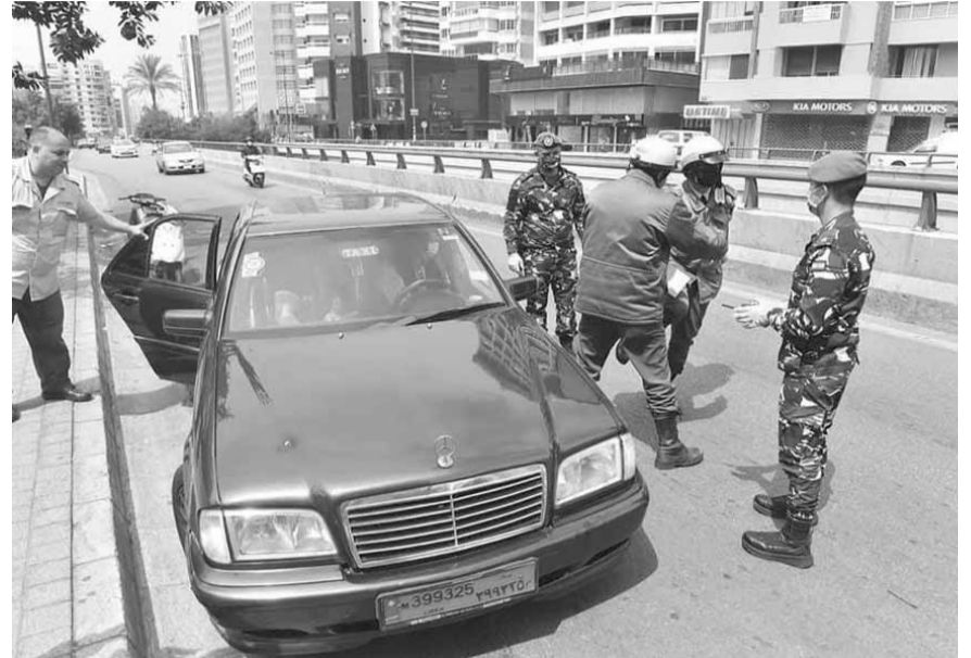
قوى الامن تقمع المخالقات وتسطر محاضر ضبط

عمشيت، محلات ومؤسسات تجارية خالفت قرار التعبئة العامة.