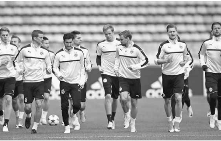
... ولاعبو بوروسيا دورتموند أثناء التدريبات