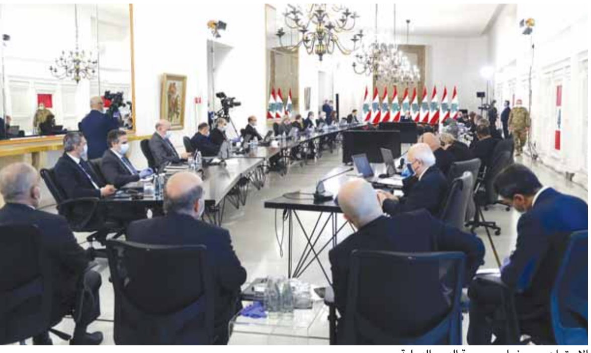
الاجتماع مع سفراء مجموعة الدعم الدولية