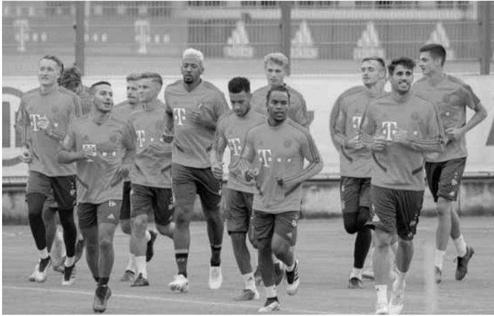
لاعبو بايرن ميونخ خلال التمارين

جاهزته البدنية دون تعجل، ليصبح لائقًا للعودة بكامل قوته فور استئناف النشاط.