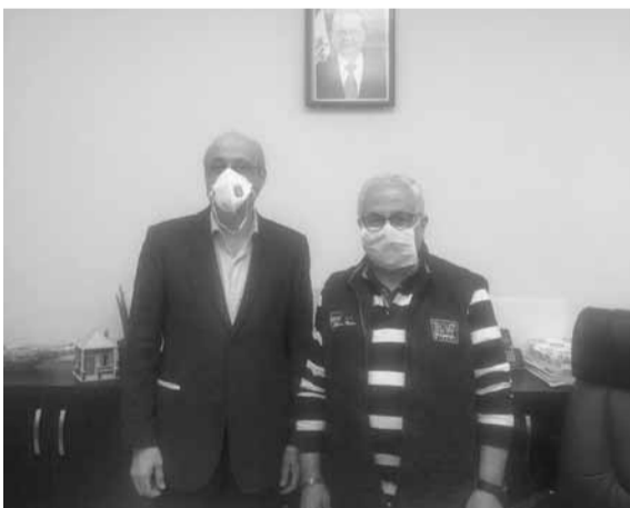
أبو شرف يزور المستشفى

لتأمين الشروط الضرورية كي يصبح جاهزية كاملة لاستقبال المرضى المصابين بفيروس كورونا، في حين غالبة المساعدات تستند إلى المبادرات الفردية، وهذا ما يجعل اكتمال جهوية مستشفى البوار الحكومي يستغرق وقتاً».