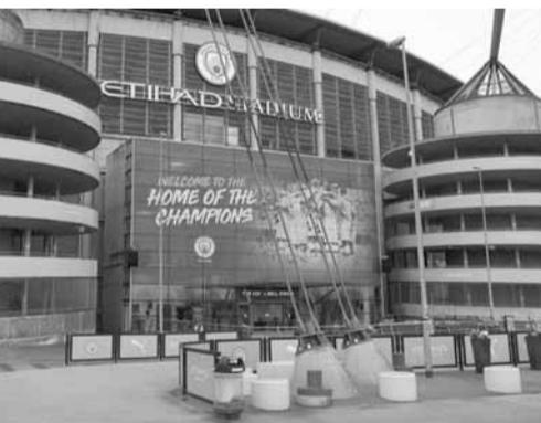
واجهة ملعب الاتحاد مقر نادي مانشستر سيتي

وتابعت الصحيفة أن الفئاتين كشفنا الأمر، بعدما نشر ووكر فيديو يدعو فيه للحجر المنزلي، ونقلت الصحيفة عن إحدى فئاتي الليل: «ما فعله ووكر أمر غريب للغاية، إنه يدعونا لقضاء حفل في منزله، وفي اليوم التالي يطالب الناس بالبقاء في منازلهم من أجل سلامتهم في ظل انتشار فيروس كورونا، إنه منافق».