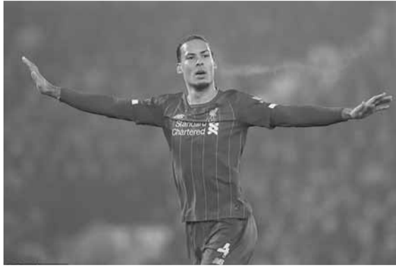
فيرجيل فان دايك

دايك: «حينما كنت في ١٦ من عمري، كنت تظهر أيمن مع فريق غرونينغن، لم أكن جيداً بشكل كافي للعب كمُدافع، لم أتشكل نهائياً كلاعب إلا عندما انضمت لفريق تحت ١٩ عاماً، وأصبحت قائداً للفريق».