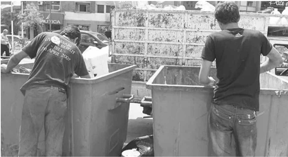
يفشون بين النفايات على بقايا طعام

التوعية الصحية واهمية الالتزام بقرار التعبئة العامة، وثانياً تسطير محاضر الضبط بالمخالفين وقد لاقى الاجراء ارتياحا في الأوساط الشعبية.