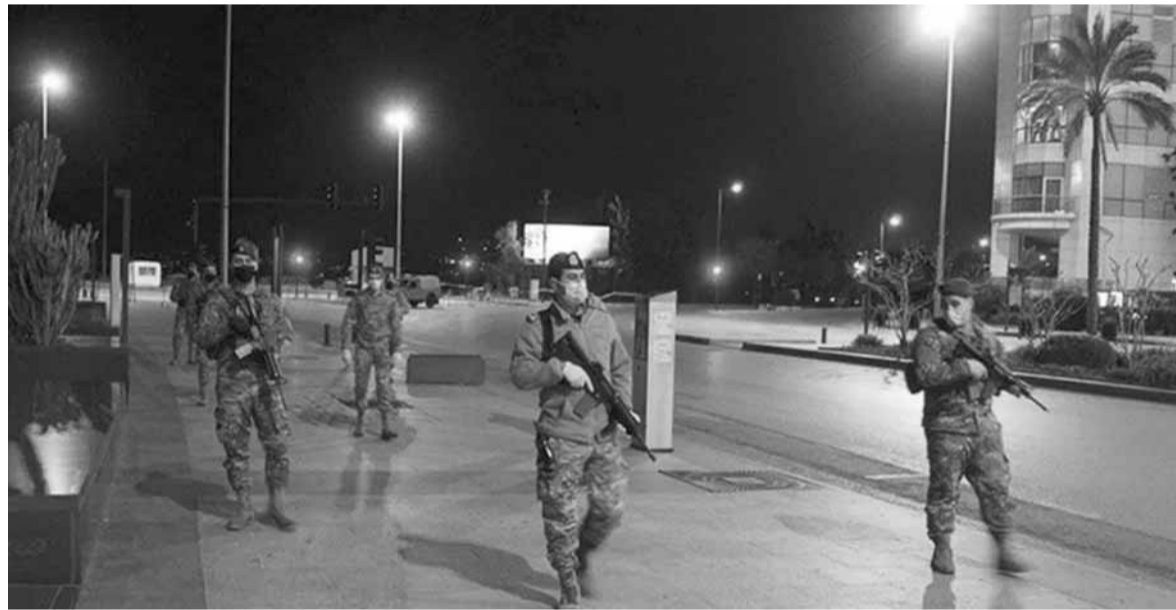
إجراءات الجيش تطبيقاً لقرار حظر التجول