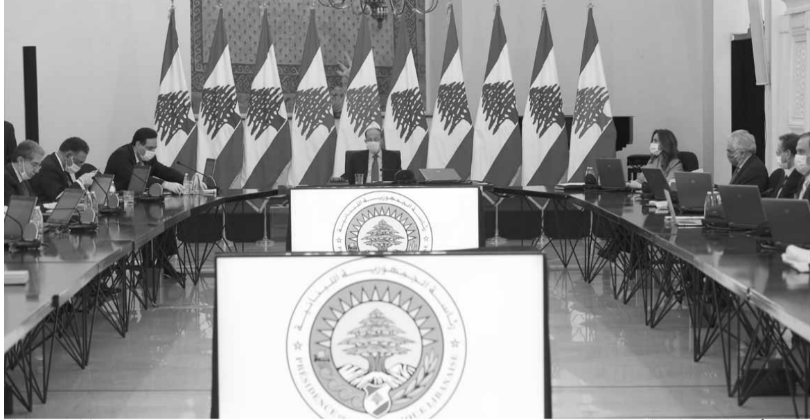
عون يترأس جلسة مجلس الوزراء

بعد ذلك، قال دياب: «من الواضح أن المصاعب التي تواجه البلد تتزايد وتكبر، وتهدد اللبنانيين بمستقبلهم وصحتهم ومعيشتهم. قدر هذه الحكومة أن تحمل أعباء هذه التحديات دفعة واحدة، وأن تخوض هذه الأمواج العاتية من المشكلات، وأن تتحمل المسؤولية من أجل تخفيف الأضرار عن لبنان واللبنانيين. هذه التحديات الوطنية، تقترض من المسؤولين، خصوصا من القوى السياسية، حدا أقصى من الحجر الصحي على المصالح والحسابات والمزايدات، لأن الوضع في البلد وعلى كل المستويات، لا يحتمل مزيدا من التناحر السياسي و«تتأثر» الحصص، خصوصا أنه لم يعد هناك شيء في البلد يمكن «تتأثره». بكل أسف، لم نشعر أن هناك وعيا وطنيا أو تخليا عن السلوك السابق الذي يتحمل مسؤولية رئيسية وأساسية في الانهيار الذي نعيشه، أو ارتقاء إلى مستوى المخاطر الوطنية. هناك من يعتقد أن شيئا لم يحصل، وأن انتفاضة اللبنانيين في ١٧ تشرين الأول انتهت، ويحاولون طمس حقيقة أن البلد يعيش تداعيات كل السياسات الماضية. نحن لطلما قلنا ورددنا أننا لا نريد منافسة أحد في السياسة، وأنه ليست لدينا طموحات سياسية، وأنا نريد العمل بصمت كي نغذ البلد من الانهيار الشامل. لكن، وبكل أسف، هناك من يصر على عرقلة الحكومة ورميها بالحجارة، لأنه يعتقد أن نجاحها يؤدي إلى كشف عورات السياسات السابقة، وأن البلد لا يمكنه أن يعيش من دون الدوران في فلكهم. في كل الأحوال، يبدو أن فيروس كورونا كان مرضا منتشرا في مختلف مفاصل الحياة في لبنان قبل أن يتحول إلى وباء مرضي في الصحة. حظ هؤلاء المتحاملين أننا في هذه الحكومة مصررون على مواجهة الوبئة المالية والصحية والاجتماعية والمعيشية. وهي أوبئة تكاد مكافحتها تكون مستعصية، بسبب عمقها