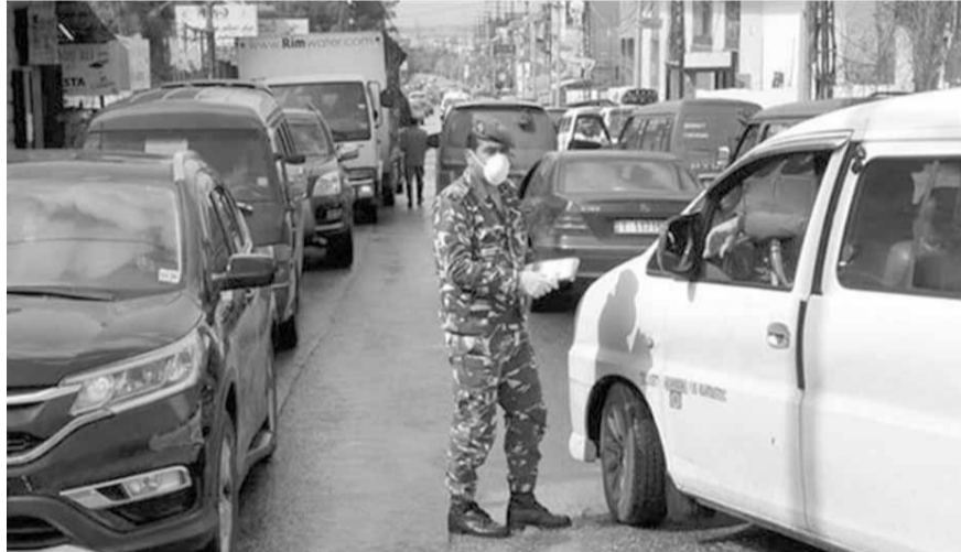
خرق التعبئة في عكار

وتم الزام المودعين والموظفين والعاملين الذين توافدوا لانجاز معاملاتهم المصرفية وقبض رواتبهم، بمعايير الصحة والسلامة العامة لجهة وضع الكمامات والقفازات، وعلى المسافة الآمنة صحياً بين بعضهم بعضاً، الأمر الذي خفف كثيراً من حال فوضى الازدحام التي سادت خلال الايام الماضية.