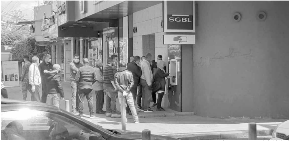
اكتظاظ أمام أحد مصارف صيدا

على حساب الأزمة المعيشية الخطرة التي تضاف اليوم إلى الإنهيارات المتتالية في الأشهر الماضية، الأمر الذي يجعل من الإنهيار العام حتمياً، إذ أن دولاً متقدمة وتمتّع بإمكانات مالية هامة وباقتصاد قوي، باتت على شفير أزمة مالية غير مسبوقة جراء أزمة «كورونا»، فكيف ستكون الحال في لبنان. ومع انتهاء فترة السماح للحكومة الحالية، كما تشير المعلومات نفسها، فإن كل ما يرافق القرارات الحكومية المرتقبة، وبشكل خاص على المستوى