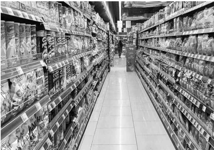
ارتفاع أسعار السلع

أعلنت جمعية المستهلك - لبنان أن سجل تطور أسعار السلع والمواد الغذائية أظهر منذ ١٥ شباط الى ٣١ آذار ٢٠٢٠، ارتفاعاً بلغ ١٣,١٧٪ أي أن أسعار هذه السلع والخدمات ذات الاستهلاك اليومي للعائلات ارتفع ما مجموعه منذ ١٧ تشرين الأول ٢٠١٩ حوالي ٥٨,٤٣٪».