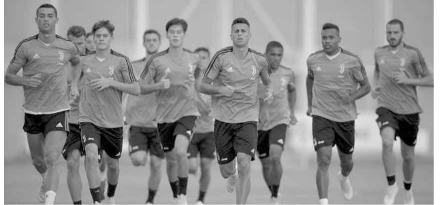
من تمارين يوفنتوس قبل بدء فترة التوقف

إيجابية. إذا بدأنا بتخفيف اجراءاتنا الآن، ستذهب كل جهودنا سدى».