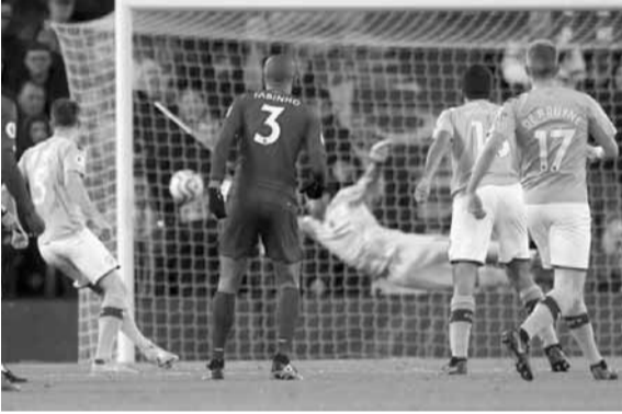
من إحدى مباريات الدوري الانكليزي الممتاز

وأكد: «يجب أن ننظر لأي فترة تعود الأمور لطبيعتها، أعتقد أن هذا يرسل رسالة أفضل من الإلغاء والبدء مرة أخرى».