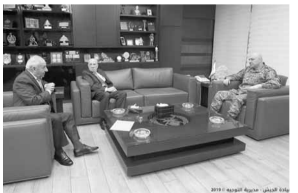
قائد الجيش مستقبلاً ضباطاً متقاعدين

استقبل قائد الجيش العماد جوزاف عون في مكتبه في البرزة، عدداً من الضباط المتقاعدين من دورات مختلفة، الذين قدموا هبات مالية لمصلحة الطبابة العسكرية في الجيش. وشكر العماد عون الضباط المتقاعدين «على هذه المبادرة التي من شأنها تعزيز قدرات الطبابة العسكرية لمواكبة هذه المرحلة الدقيقة التي تشهدهم تقنياً لفيروس كورونا»، مشيراً «إلى أن الطبابة في الجيش التي شهدت مؤخراً تطوراً»، لافتاً «تقوم بالإجراءات الضرورية والاستباقية اللازمة لحماية العسكريين وعائلاتهم».