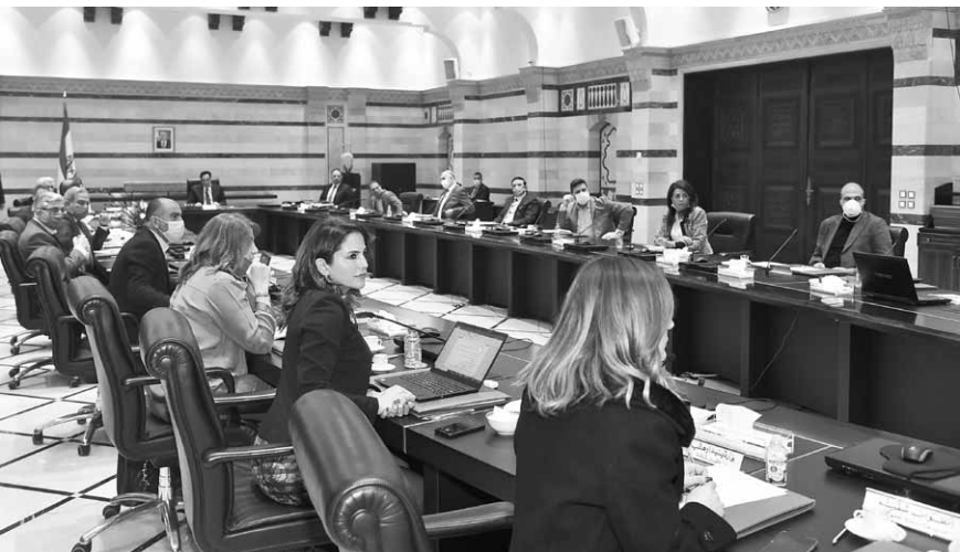
خلال ورشة العمل

على مواجهة العدو الذي يغزو العالم مع تحرك للمجتمع المدني الفلسطيني عبر جمعيات تعنى بشؤون اللاجئين اذ ان الإجراءات المتخذة في المخيمات لا تختلف عن تلك التي قررتها الحكومة اللبنانية ويتشارك المجتمع الدولي فيها وتقوم على التزام المنزل وعدم الاختلاط والعناية بالنظافة واللجوء الى التعقيم وهذا ما حصل في كل المخيمات في لبنان يقول مسؤولون فلسطينيون، اذ اظهر الشعب الفلسطيني انه موحد في الشدائد، واطهر عن تضامن اجتماعي اذ يشير هؤلاء الى ان الحصار على بعض المخيمات التي تشكو من بعض التدابير الامنية المتخذة من قبل القوى العسكرية والامنية اللبنانية لمنع الدخول العشوائي الى المخيمات لا سيما ذات الكثافة السكانية كعين الحلوة وبرج البراجنة وصبرا وشاتيلا ونهر البارد وبالتنسيق مع الفصائل الفلسطينية التي تشكو من بعض التدابير المشددة التي اتخذت بعد الاحداث في سوريا وتسلب ارابيين الى بعض المخيمات والتي تفهمها المسؤولون الفلسطينيون الذين يؤكدون ان المواطنين منهمول للإجراءات وهم امتنعوا عن الاختلاط فيما بينهم وحُفّت الفصمات وتجري عمليات تعقيم وتطهير يوميا وعلى مدار الساعة للاحياء والأرقّة المكتظة بالسكان والتي تحولت الى مريمحات وقد نُحِحت اللجان الشعبية مع الامن الوطني الفلسطيني والكفاح المسلح في ضبط حركة المواطنين، ومنع الدخول الى المخيمات والخروج منها وفرضت اقفال المحلات ونظمت الدخول الى تلك التي تباع المواد الغذائية.