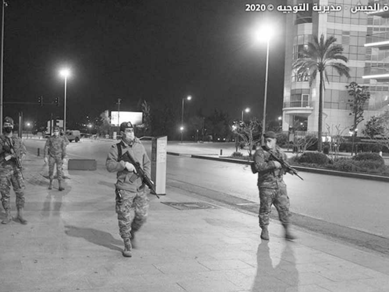
ع. الخيس - مديرية التوجيه © 2020

غرد رئيس الحزب «الديموقراطي اللبناني» النائب طلال أرسلان على «تويتر»: «إن الاتصال الذي جرى أمس الأول من قبل دولة الإمارات العربية المتحدة مع الشقيقة سوريا، إن دل على شيء فإنما يدل على النخوة العربية الصادقة بل أكثر من ذلك، تاركين لأيام المقبلة لإظهار التعاون والتفاعل بين القوى كافة».