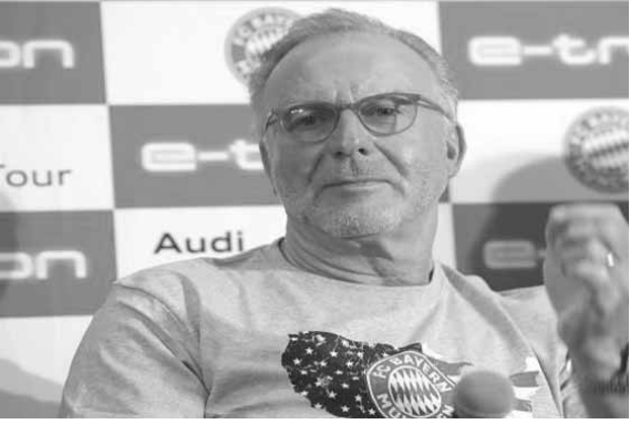
كارل هاينز رومينغه

مفاوضات هذه الأيام مع اللاعبين، الذين تنتهي عقودهم بنهاية الموسم المقبل، على رأسهم مانويل نوير، توماس مولر وديفيد ألبا.